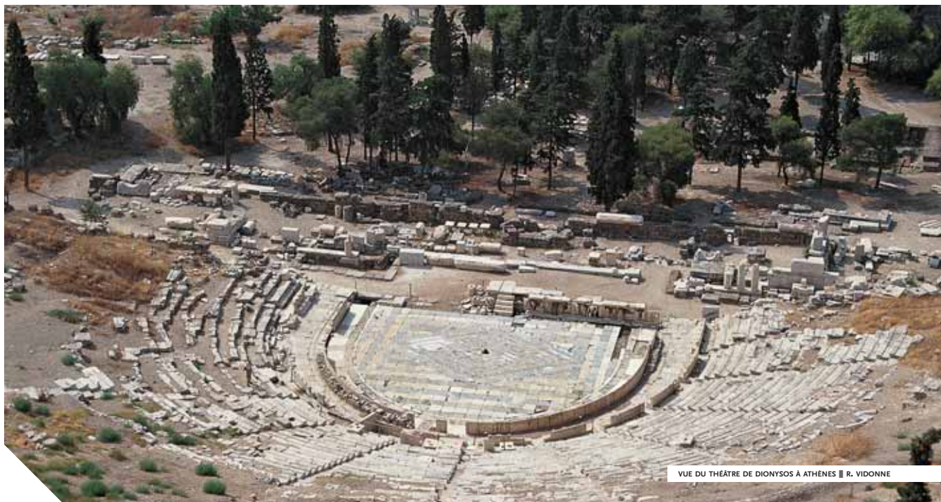
VUE DU THÉÂTRE DE DIONYSOS À ATHÈNES ■ R. VIDONNE

On connaît la suite. Rome vint. Mais, comme le reconnaît le poète latin Horace, "la Grèce conquise conquiert son farouche vainqueur", non par les armes, mais par l'esprit. À la chute de Rome, Byzance assura l'héritage et conserva, dans ses monastères et ses bibliothèques, une vaste partie de la culture antique. Au moment où Byzance cédait sous la pression des Turcs, les ouvrages passèrent dans les cités d'Europe occidentale, qui sortaient du Moyen Âge, cependant que d'autres œuvres, que l'on croyait perdues, se transmettaient en belle écriture arabe. Tout était prêt pour une Renaissance, qui allait être celle de la culture antique. Alors, les fils de la raison, un temps distendus, se renouèrent. Partout, la révolution culturelle était à l'œuvre. L'Occident proche ne lui suffit plus : elle atteignit bientôt les pays du lointain Occident, comme ceux de l'Extrême-Orient, et se déploya jusque dans des contrées où les astres inversent leur course. Même les chemins du ciel lui étaient désormais ouverts. Athènes, qui avait porté, sur les fonts baptismaux de l'histoire, la Raison, cette approche inédite de la pensée humaine, était bien la mémoire de l'Occident, ce prisme au travers duquel nous décodons inlassablement le monde et qui constitue la marque la mieux assurée de notre identité.