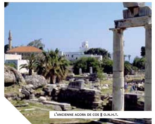
L'ANCIENNE AGORA DE COS ■ O.N.H.T.