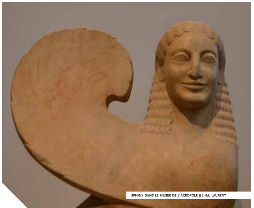
SPHINX DANS LE MUSÉE DE L'ACROPOLE ■ J.-M. LAURENT

leur force aux matrices premières de l'univers et pénétrant "dans la chambre des archétypes", comme le chantaient les Mésopotamiens, ces épures – esquisses parfaites de toutes les copies à venir – régénèrent l'éther et réactualisent le monde : l'harmonie du cosmos n'a alors d'égale que la concorde retrouvée dans la société des hommes et l'équilibre restauré au cœur des individus qui la composent. Dans ces vieilles civilisations, la vertu ne réside pas dans l'innovation, mais dans la tradition. Elle ne prône pas l'adaptation, mais la restauration. Elle se nourrit de la mémoire du passé et se méfie de toute amnésie comme la cause la plus assurée de mortalités individuelle et collective. Hors de la tradition, point de salut ! La révolution, pourquoi pas ? À condition que la société revienne, à l'image des astres et de leur course circulaire, à son point d'origine. En ces temps-là, c'eût été un presens absolu que de penser qu'un jour certains voudraient faire table rase du passé. Cette façon de voir les choses, qui perdure d'ailleurs dans quelques civilisations actuelles, se vérifie partout, y compris dans l'espace et le temps où vint s'inscrire la civilisation grecque.