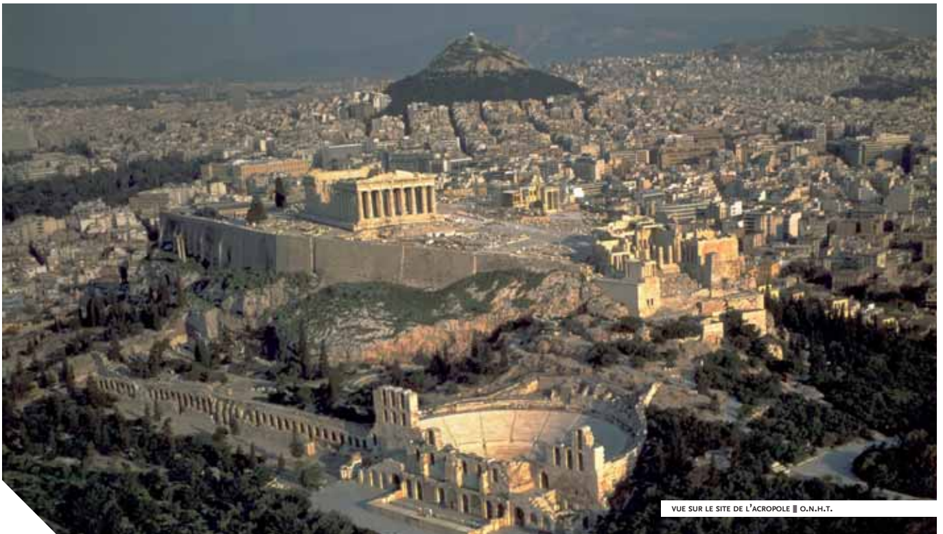
VUE SUR LE SITE DE L'ACROPOLE