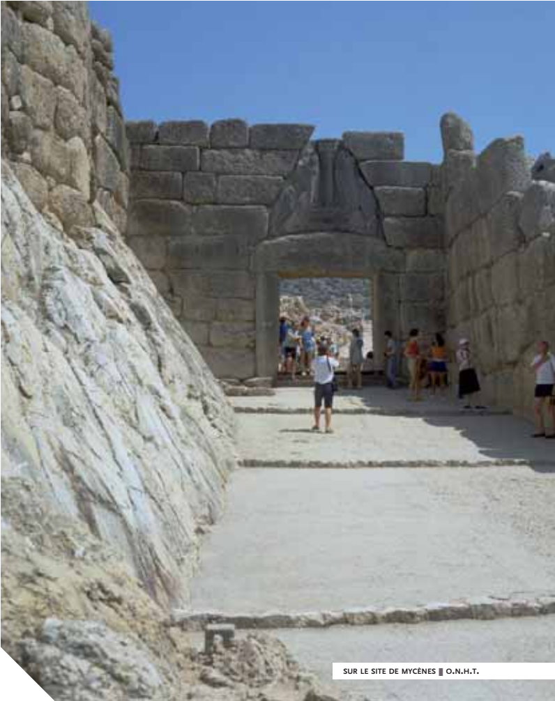
SUR LE SITE DE MYCÈNES ■ O.N.H.T.