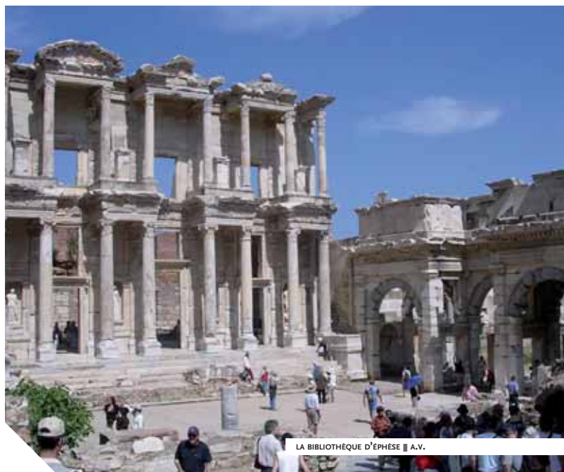
LA BIBLIOTHÈQUE D'ÉPHESE ■ A.V.