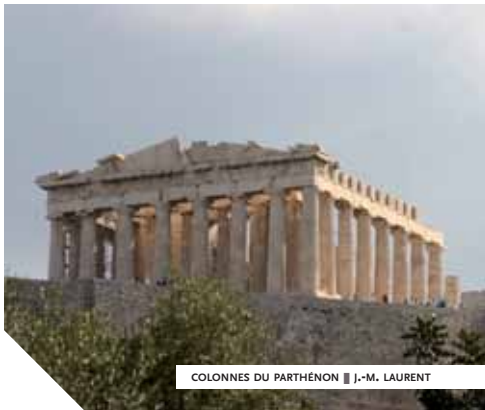
COLONNES DU PARTHÉNON ■ J.-M. LAURENT

Peu de voyages ont des allures de pèlerinage comme celui à Athènes, où l'on chemine parmi les oliviers de la voie Sacrée. On se hisse, de marche en marche à travers le site des Propylées, jusqu'aux grâces studieuses des colonnes du Parthénon. Parvenu sur l'esplanade éblouissante de lumière et le temps d'une méditation, le visiteur devine qu'il vient de renouer avec l'antique fil de sa mémoire. C'est en effet à Athènes que le voyageur occidental est né, qu'il vienne d'Occident ou qu'il ait été nourri de cette culture. En ces lieux, une sorte de renaissance s'est accomplie, portant celui-ci sur les fonts baptismaux de la pensée moderne. Il est sur la ligne de rupture qui sépare les vieilles et grandes civilisations de Mésopotamie, d'Égypte, du proche et du lointain Orient – parmi lesquelles il sera toujours un étranger – de cette civilisation de rocailles et d'anses marines où il se sait déjà chez lui. Mais il ne le perçoit jamais avec autant d'intensité que dans la cité d'Athéna, cette Athènes en laquelle semble se résumer toute l'histoire de la Grèce, antique comme moderne.