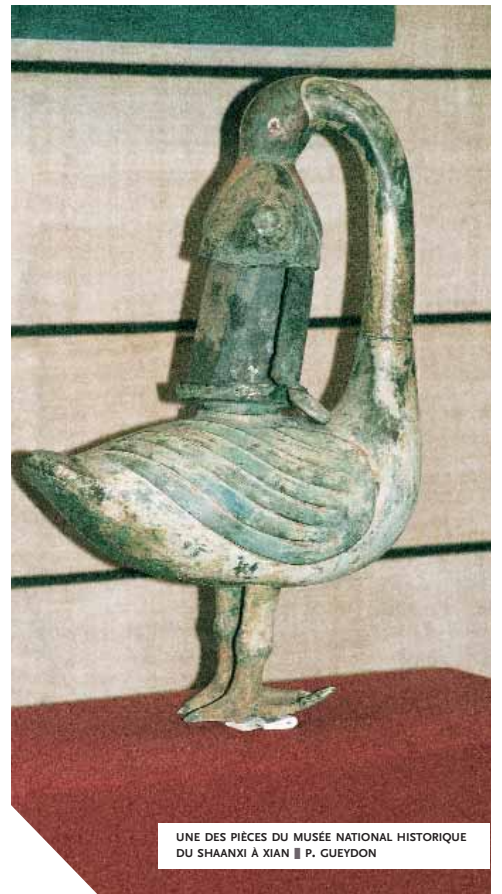
UNE DES PIÈCES DU MUSÉE NATIONAL HISTORIQUE DU SHAANXI À XIAN ■ P. GUEYDON

Les plus belles découvertes archéologiques (qui commencent à apparaître dans le cadre d'une politique résolument tournée vers l'exhumation du passé afin de mieux légitimer le présent) sont donc systématiquement exposées à Pékin ; mais elles font aussi l'objet de multiples copies et reproductions qui, déposées dans les nouveaux musées des provinces, servent à l'enseignement. Le résultat (imprévu et gênant à nos yeux) est que l'on ne sait jamais, si l'on se trouve devant une copie plus ou moins heureuse, ou bien devant un original abîmé, ou encore mal éclairé (ce qui est fréquent). Cela, en fait, ne gêne pas grand monde, pour diverses raisons dont une qui tient à la position traditionnelle des lettrés sur l'idée d'objet authentique ou de copie : ce qui fait