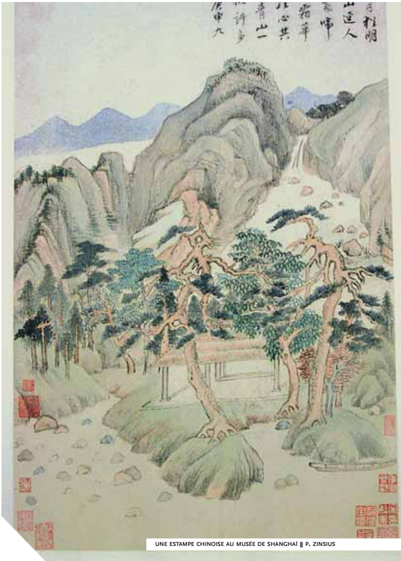
UNE ESTAMPE CHINOISE AU MUSÉE DE SHANGHAI ■ P. ZINSIUS

pièces parfois magnifiques, apparaissent ainsi, de temps à autres, des copies monumentales de certains objets originaux, reproduits dans des proportions plus grandes que nature, et de manière à les rendre plus voyants, plus inoubliables.