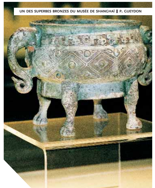
UN DES SUPERBES BRONZES DU MUSÉE DE SHANGHAI

Plus tard, à l'âge du bronze, les souverains installés à Anyang (Henan) se mettent à amasser, vers 1200 avant notre ère, toutes sortes de ces précieux jades : certains fabriqués récemment et d'autres, hérités des aïeux et issus de temps parfois très anciens. La tombe d'une reine, Fu Hao, en contenait ainsi plusieurs centaines. La sépulture, devenue site archéologique majeur, remplit aujourd'hui les espaces d'un nouveau musée qui lui est consacré. Toujours à l'âge du bronze, les puissants prennent aussi l'habitude de garder auprès d'eux certains des récipients de bronze (utilisés notamment lors des banquets funéraires) qu'ils tenaient de leurs parents ou aïeux.