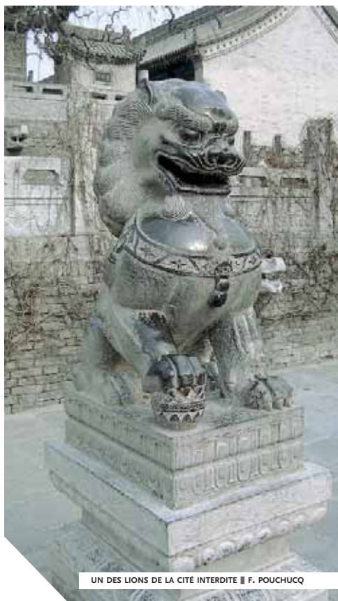
UN DES LIONS DE LA CITÉ INTERDITE ■ F. POUCHUCO

Dans la Chine d'aujourd'hui, les musées poussent aussi vite que les villes nouvelles, au point que la presse parle parfois d'une véritable "fièvre muséale", phénomène majeur qui saisisrait le pays en pleine crise de croissance. Les autorités culturelles en tirent une grande fierté et disent vouloir faire mieux encore. Elles légitiment leur activisme en rappelant ce qu'elles estiment être le grand retard national en la matière ; elles souhaitent qu'en 2008 la Chine, rejoignant enfin le cercle des pays développés, compte en moyenne un musée pour quinze mille habitants, et il se pourrait bien que le pari soit tenu. Cela ne saurait étonner venant d'un gouvernement qui adhère, depuis 1985, à la Convention pour la protection du patrimoine mondial, culturel et naturel signée dans le cadre de l'Unesco, et présente au classement chaque année depuis, avec de longues listes de sites estimés d'importance mondiale ; chaque inscription obtenue correspond, comme il se doit, à l'aménagement, la protection et la mise en valeur des lieux ainsi désignés. La Cité interdite à Pékin, les jardins de Suzhou, les soldats du premier empereur à Xian et les principaux sanctuaires bouddhiques (Dunhuang, Yungang, Longmen, etc.), par exemple, ont figuré parmi les premiers sur une liste qui englobe aussi un certain nombre de sites naturels.