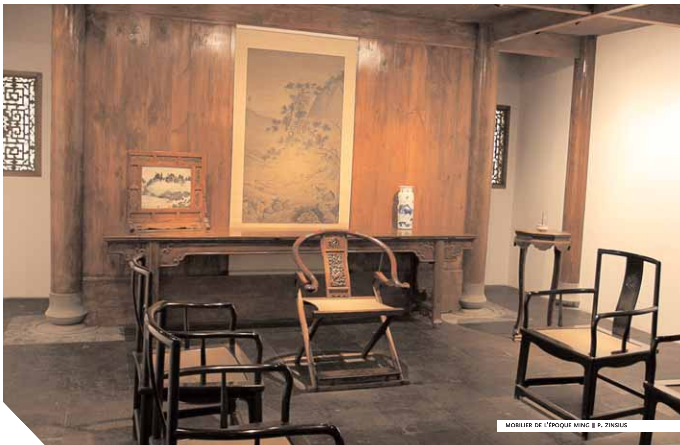
MOBILIER DE L'ÉPOQUE MING ■ P. ZINSIUS

Lorsqu'à nouveau le cataclysme d'un changement dynastique secoue la Chine (1644) et qu'une dynastie mandchoue prend le pouvoir (les Qing), le goût des objets s'affirme de nouveau. L'idée d'inventaire, née au XI e siècle sous les Song, trouve ainsi sa pleine expansion sous les règnes des empereurs Kangxi ( reg. 1661-1722), Yongzheng ( reg. 1723-1735) et Qianlong ( reg. 1736-1796). Ils mettent en forme encyclopédique et pérennisent l'héritage textuel et matériel des siècles passés. Le mouvement, tourné d'abord vers l'écrit et la littérature, gagne peu à peu les objets, témoins d'un monde enfoui et plus ou moins idéalisé. L'empereur Qianlong fait acheter à prix d'or les plus belles pièces antiques ; elles lui inspirent des poèmes enthousiastes qu'il n'hésite pas à faire graver partout, même – acte sacrilège à nos yeux – sur de sublimes jades archaïques.