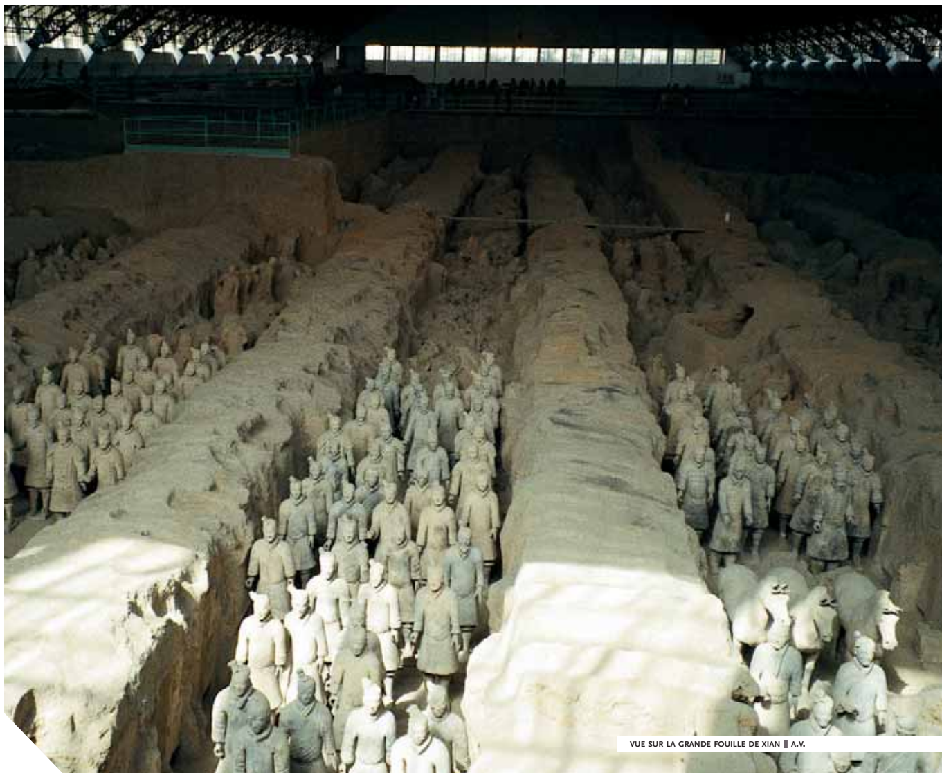
VUE SUR LA GRANDE FOUILLE DE XIAN ■ A.V.

Enfin, les amateurs du monde entier, pour leur part, ne se lassent jamais du musée qui, selon leurs critères, conjugue le mieux pédagogie et jouissance esthétique : le musée de Shanghai. Conçu selon un plan en caravansérail, comme un hôtel Sheraton, il aligne, au fil de ses étages établis tout autour d'un puits central, des collections de bronzes, calligraphies, peintures, jades, céramiques, meubles, monnaies, sceaux et costumes régionaux parmi les plus riches du monde. Les esprits critiques s'étonnent de l'aspect extérieur du bâtiment, évoquant, à l'aide de lanières de béton, la partie supérieure d'un chaudron de bronze, comme on en utilisait jadis pour cuire les ragoûts du banquet offert aux ancêtres. Étrange flacon, assurément, mais l'ivresse de la contemplation est bien au rendez-vous, pour qui tente la plongée à l'intérieur !