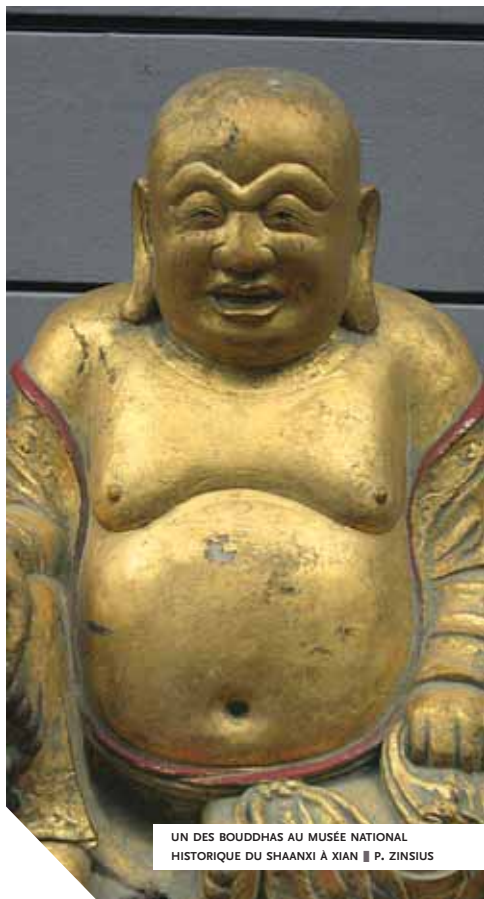
UN DES BOUDDHAS AU MUSÉE NATIONAL HISTORIQUE DU SHAANXI À XIAN ■ P. ZINSIUS

Ce goût des antiquités et des pièces par nature rarissimes dans ce pays que les guerres et les catastrophes naturelles ravagent périodiquement, prend toute son ampleur environ un millénaire plus tard, lorsque, vers 1050, le cours principal du fleuve Jaune se déplace sur plusieurs centaines de kilomètres. C'est dans ce cataclysme qu'apparaissent les tombes royales d'Anyang (au Henan), évoquées plus haut et datant de la fin du II e millénaire avant notre ère.