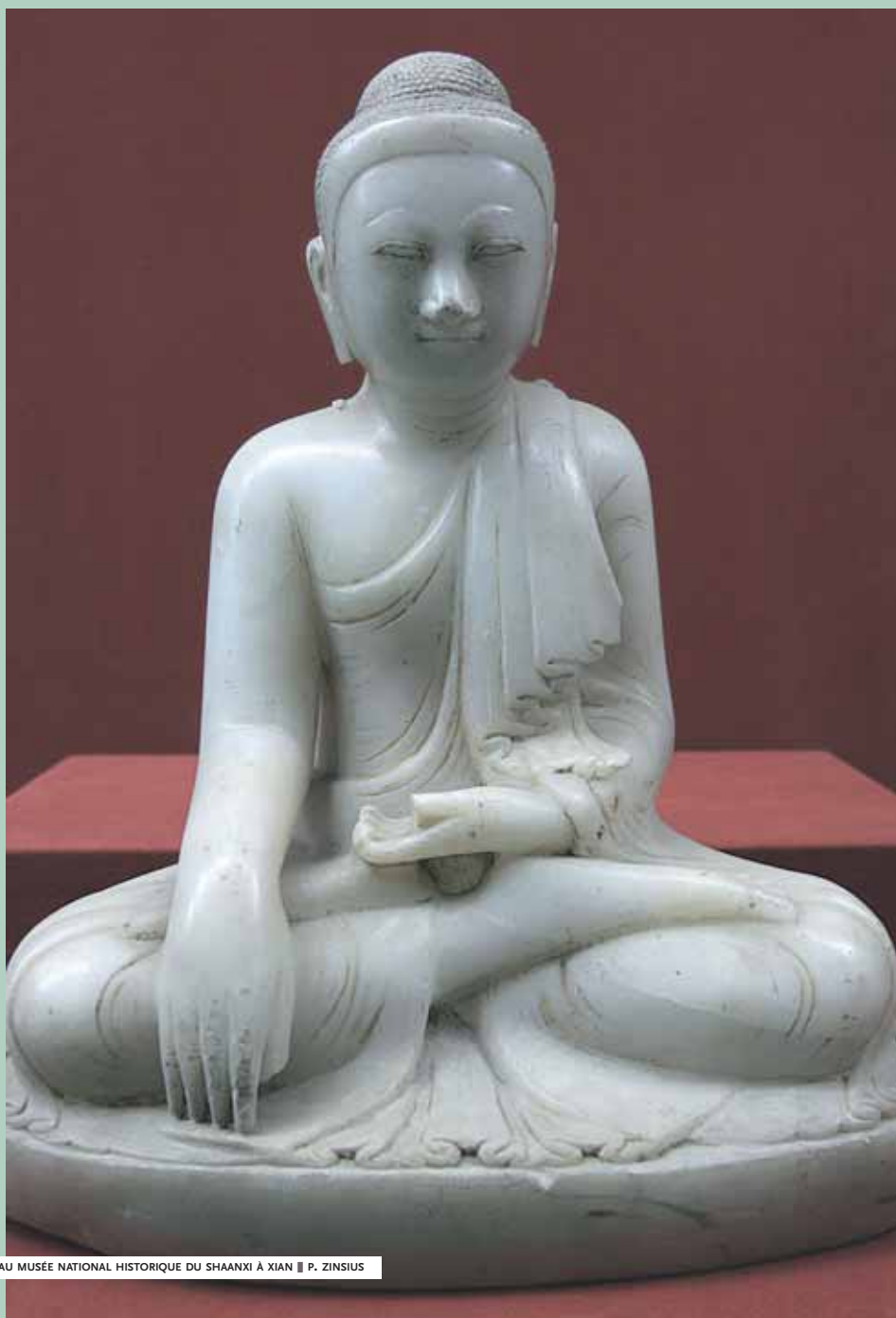
UN BOUDDHA DE JADE EXPOSÉ AU MUSÉE NATIONAL HISTORIQUE DU SHAANXI À XIAN

[ PAR DANIELLE ELISSEFF, DIRECTRICE DE RECHERCHE DE L'EHESS ]