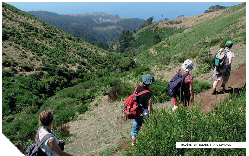
MADÈRE, EN BALADE | J.-P. LEVRAULT

D'autre part, l'acquisition et/ou le transport et l'importation d'objets contrefaits, d'armes (sauf reproductions et armes de collection) et de substances illicites sont prohibés.