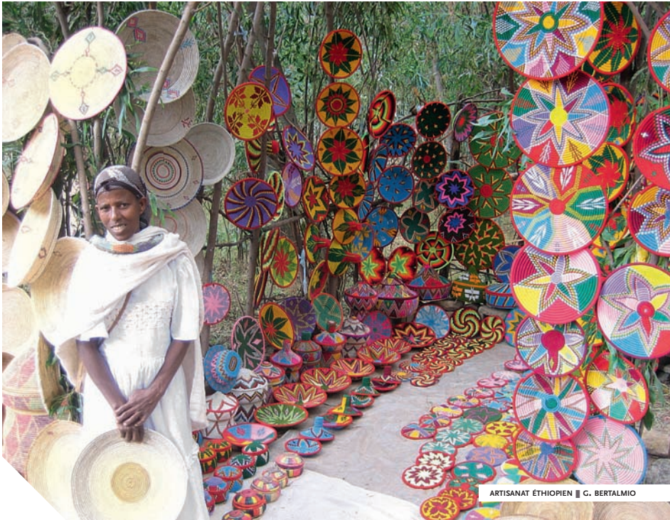
ARTISANAT ÉTHIOPIEN | G. BERTALMIO

pratique anodine. Il est donc impératif de respecter les interdictions, en particulier dans les musées et les zones sensibles, ainsi que les refus, explicites ou implicites. Veillons également à rester discrets, à respecter en toute occasion la dignité et la vie privée des personnes et interrogeons-nous sur l'opportunité d'une contrepartie financière et sur ses éventuelles conséquences.