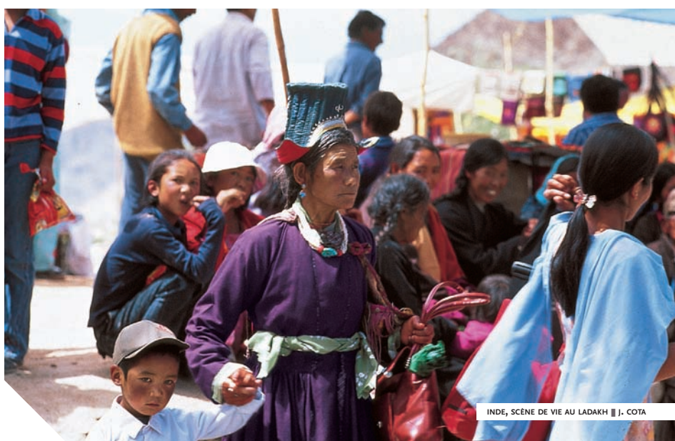
INDE, SCÈNE DE VIE AU LADAKH || J. COTA

Arts et Vie, en tant qu'association culturelle, a eu dès son origine le souci du respect des peuples, des patrimoines et de leur environnement. Les voyages Arts et Vie sont une invitation à la rencontre avec d'autres civilisations, d'autres cultures, d'autres coutumes... mais le développement mondial du tourisme peut parfois entraîner des situations à l'origine d'incompréhensions et de déséquilibres. Il nous semble par conséquent important de rappeler quelques principes simples qui fondent l'identité culturelle et humaniste de notre association et qui peuvent contribuer à ce que notre présence soit perçue comme une source d'enrichissement mutuel.