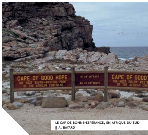
LE CAP DE BONNE-ESPÉRANCE, EN AFRIQUE DU SUD ■ A. BAYARD

En 1434, les navigateurs portugais franchirent le cap Bogador, ou actuel cap Juby, qui était considéré jusqu'alors comme une limite au-delà de laquelle s'ouvrait un monde totalement différent, et par là-même terrifiant. Des expéditions régulières permirent notamment de dépasser le cap Blanc en 1441, d'atteindre l'embouchure du fleuve Sénégal et de franchir le cap Vert en 1445. Au cours des années 1450-1460, les Portugais parvinrent aux îles du Cap-Vert et s'y installèrent, tandis que Pedro de Sintra atteignait la Sierra Leone.