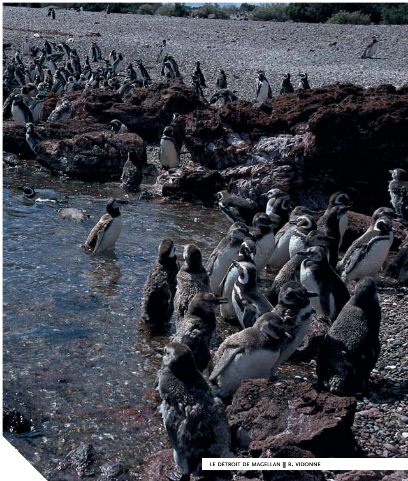
LE DÉTROIT DE MAGELLAN

Henri le Navigateur, Vasco de Gama et Magellan sont trois noms indissociables des découvertes portugaises des xv e et xvi e s. Mais elles furent le fait de centaines de marins, géographes, ethnographes, marchands et linguistes de toutes nationalités. Les avancées techniques en matière de navigation, depuis l'utilisation de la boussole, de l'astrolabe – amélioré par les mathématiciens portugais vers 1470 –, du sextant et du sablier, jusqu'à l'invention portugaise de la caravelle – qui disposait de trois mâts permettant de se jouer des vents et d'un gouvernail d'étambot – ont évidemment rendu ces découvertes possibles, tout comme l'établissement de cartes nautiques et côtières