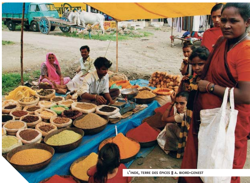
L'INDE, TERRE DES ÉPICES

Les expéditions, financées par la couronne et par les marchands de Lisbonne, se poursuivirent après la mort d'Henri le Navigateur en 1460. Cette année-là, le cosmographe Fra Mauro termina une carte pour le compte du roi et évalua l'armée du prêtre Jean à un million d'hommes, combattant nus ou vêtus de peaux de crocodiles. Après la signature en 1479 du traité d'Alcaçovas, qui mettait fin à la guerre entre le Portugal et la Castille et reconnaissait la souveraineté du premier sur Madère, les Açores, la Guinée et tout ce qui serait découvert et conquis au sud des îles Canaries, les missions d'exploration vers le Congo et au-delà furent confiées à Diogo Cão. Celui-ci érigea diverses colonnes – padrões –, pour marquer l'avancée des Portugais au sud de l'équateur, depuis l'embouchure du fleuve Zaïre jusqu'au cap Noir, ou cap Sainte-Marie. Les missions diplomatiques aboutirent en 1489 à la conversion du roi du puissant royaume du Congo au christianisme, le manicongo Nzinga Nkuwu, dont le successeur prit même le nom d'Alphonse 1 er . Il donna à sa capitale le nom de Saint-Sauveur, ou São Salvador, et envoya son fils étudier la théologie au Portugal. En 1487, Bartolomé Dias reprit le flambeau. Poursuivant la tradition des découvertes, il atteignit l'année suivante le cap de Bonne-Espérance, tandis que Pedro da Covilhão, passant par Alexandrie, Aden et le détroit d'Ormuz, arrivait à Calicut et peut-être au Mozambique, avant de s'enfoncer en Éthiopie vers 1494.