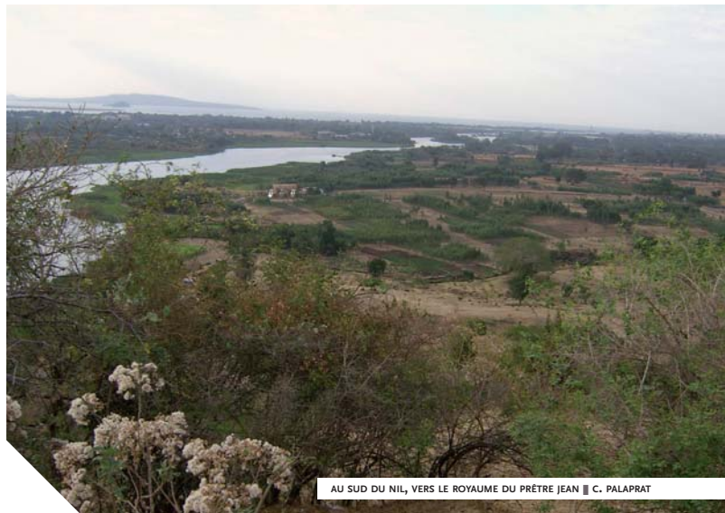
AU SUD DU NIL, VERS LE ROYAUME DU PRÊTRE JEAN ■ C. PALAPRAT

décoration intérieure, et les armes des soldats étaient façonnées dans ce métal. En outre, le Livre de la connaissance de tous les royaumes , rédigé par un Castillan dans la seconde moitié du XIV e s., expliquait qu'en longeant vers le sud la côte occidentale de l'Afrique, on parvenait à un énorme golfe au fond duquel se jetait l'Euphrate. En remontant ce fleuve, l'auteur arriva "à la ville de Malsa où réside le prêtre Jean, patriarche de Nubie et d'Éthiopie". La certitude qu'il existait un royaume chrétien, séparé du reste de la chrétienté par le monde islamique, fut confortée lorsque le prêtre Jean envoya une lettre au roi Alphonse V d'Aragon en 1428 ainsi que des émissaires au concile de Florence de 1441 et en Castille. Dans la seconde moitié du XV e s. fut élaboré en espagnol le Livre de l'infant D. Pedro de Portugal , qui racontait le voyage que le frère de l'infant Henri aurait effectué vers l'est, à Jérusalem et au-delà, jusqu'au royaume du prêtre Jean, qui lui aurait confié une lettre pour les rois d'Occident.