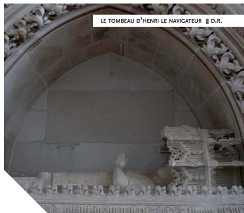
LE TOMBEAU D'HENRI LE NAVIGATEUR

Troisième fils du roi Jean I er de Portugal et de la reine Philippa de Lancaster, Henri naquit à Porto en 1394. En 1411, son père créa pour lui le duché de Viséu. 4 ans plus tard, le jeune prince participa à la prise de la ville de Ceuta au Maroc, grande place commerciale défendue par une imposante forteresse et qui abritait de nombreux pirates ; il en reçut l'administration en 1416. En 1420, à la demande de son père, le pape nomma Henri administrateur de l'ordre militaire du Christ – mouvement issu de la dissolution de l'ordre du Temple.