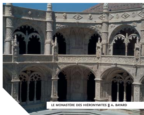
LE MONASTÈRE DES HIÉRONYMITES

Pedro Álvares Cabral, envoyé aux Indes en 1500, découvrit d'abord, peut-être sans le vouloir, le Brésil. En arrivant finalement à Calicut, il apprit que les Portugais restés avaient été tués. Il attaqua la ville puis parvint à Cochin où il fut bien accueilli et d'où il revint avec de l'or et de la soie. Deux ans plus tard, le Grand Amiral des Indes et de l'océan Indien, Vasco de Gama, fut à nouveau envoyé aux Indes : sa flotte s'empara de Kilwa et de Sofala en Afrique orientale, détruisit un grand nombre de vaisseaux musulmans et permit l'installation d'un établissement portugais à Cochin. Il entra au Portugal en septembre 1503 et reçut du roi, en 1519, le titre de comte de Vidigueira et de Vila de Frades. Nommé vice-roi des Indes le 26 février 1524, Vasco de Gama retourna aux Indes, où il mourut le 24 décembre suivant.