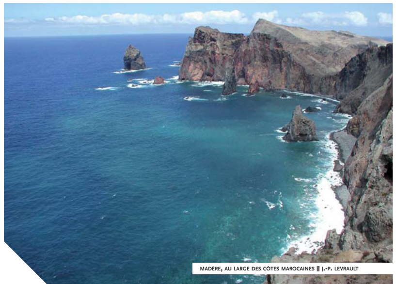
MADÈRE, AU LARGE DES CÔTES MAROCAINES ■ J.-P. LEVRAULT