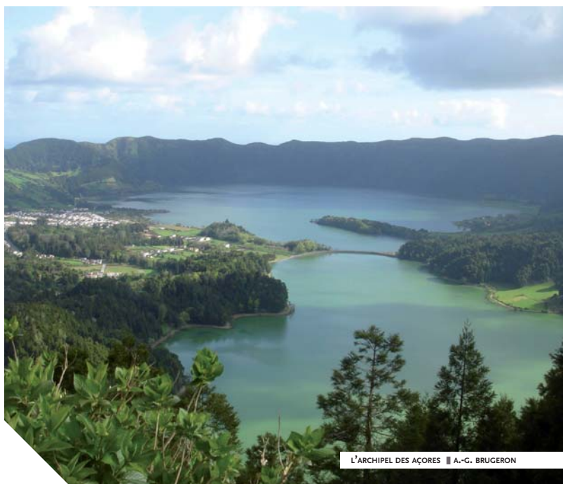
L'ARCHIPEL DES AÇORES

Vers l'ouest, les Portugais découvrirent l'archipel de Madère en 1419 puis celui des Açores une dizaine d'années plus tard. Les îles qui n'étaient pas habitées furent rapidement peuplées et exploitées. C'est dans le dernier quart du xv e s. que les Portugais entreprirent des voyages de reconnaissance, généralement à partir des Açores, après l'expédition menée par Diogo de Teive et le Castillan Pedro Vázquez de la Frontera jusqu'à Terre-Neuve (1452). La découverte quoique fortuite du Brésil, en avril 1500, par Pedro Álvares Cabral, couronna ces expéditions. Il lui donna le nom d'île de la Vraie Croix.