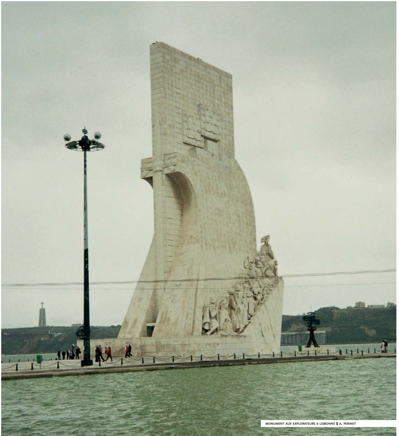
MONUMENT AUX EXPLORATEURS À LISBONNE || A. PERINET

[ PAR ADELINE RUCQUOI, DIRECTRICE DE RECHERCHE AU CNRS, SPÉCIALISTE DE L'HISTOIRE DE LA PÉNINSULE IBÉRIQUE AU MOYEN ÂGE ]