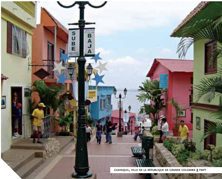
GUAYAQUIL, VILLE DE LA RÉPUBLIQUE DE GRANDE COLOMBIE

marche vers l'émancipation. Le combat est alors loin d'être achevé puisque l'insurrection est rapidement circonscrite, les armées espagnoles étant libérées du poids des guerres napoléoniennes après la chute de l'empereur. Ce n'est qu'en 1822, après bien des combats et des rebondissements, que Bolivar fait une entrée triomphale dans la ville de Quito. La Grande-Colombie qu'il préside devient un état unitaire indépendant regroupant les territoires actuels du Venezuela, de l'Équateur, de la Colombie et du Panama. L'année suivante, en 1823, c'est au tour du Pérou de demander l'aide du général Bolivar face à la division des républicains et à la menace de l'armée royaliste. Il se rend alors à Lima où il est nommé dictateur (dans le sens antique du terme) afin de rétablir l'ordre. La bataille d'Ayacucho, menée par le brillant général José de Sucre, met fin à la guerre d'indépendance en 1824. Mais le rêve de rassemblement de Simon Bolivar, incarné par la République de la Grande-Colombie, sera de courte durée. Alors que le général tente de libérer les pays andins du sud, le Venezuela et l'Équateur font sécession en 1830. L'union tant souhaitée par le général vénézuélien se disloque. C'est dans la plus grande déception qu'il s'éteint alors dans une hacienda proche de Santa Marta, emporté par la tuberculose qui le rongait depuis des années.