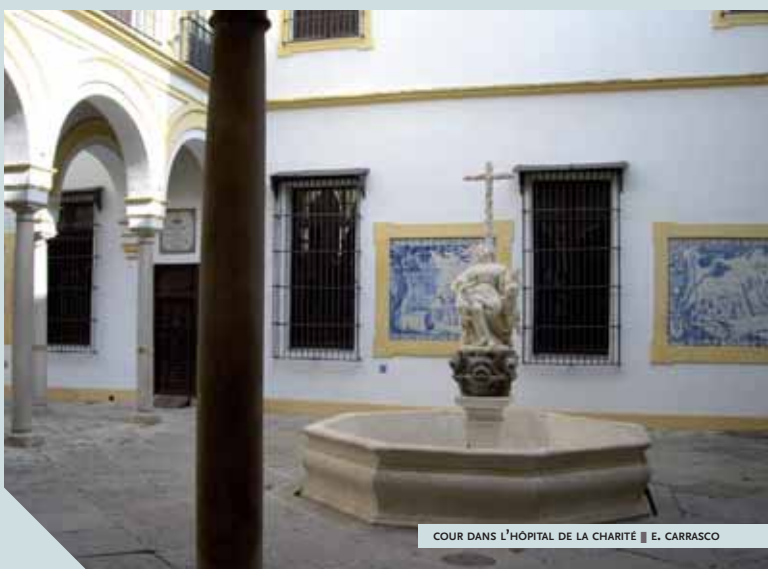
COUR DANS L'HÔPITAL DE LA CHARITÉ

Don Miguel Mañara y Vicentelo de Leca naquit à Séville le 3 mars 1627, dans une famille aristocrate d'origine italienne enrichie par le commerce. Il mena d'abord une vie mondaine et occupa d'importantes fonctions dans la cité après son mariage en 1648. Bouleversé par la mort prématurée de son épouse Jeronima en 1661, il changea radicalement de vie. Convaincu d'avoir été un grand pécheur, il décida de consacrer sa fortune à l'assistance des plus démunis. À trente-quatre ans, il se voua à une vie spirituelle intense dans le cadre de la confrérie