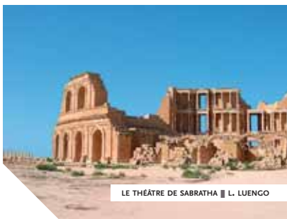
LE THÉÂTRE DE SABRATHA ■ L. LUENGO

Pour beaucoup d'entre nous, le voyage est une aventure unique qui permet la découverte d'une région, d'un pays, d'une ville où nous ne retournerons peut-être pas. Il est donc important d'avoir une vue d'ensemble de la destination tout en allant à l'essentiel. Délaissant l'anecdotique et le superflu, nous préférons nous consacrer aux grandes étapes, aux musées importants, aux principaux sites... Bien souvent, le temps presse et manque, il y a tellement de choses à voir, mais que d'images emmagasinées, que de découvertes passionnantes et combien d'histoires à raconter au retour. Dans cet esprit, Arts et Vie a développé deux types de produits. Les "découvertes" permettent une première approche, sous le signe de la synthèse, et offrent un riche aperçu de la destination. Les "classiques" proposent des itinéraires très complets, à travers les incontournables de la destination.