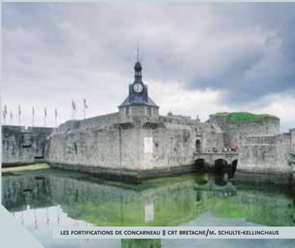
LES FORTIFICATIONS DE CONCARNEAU

Édifiée au Moyen Âge, la ville close de Concarneau est abritée des fureurs océanes par ses remparts fortifiés. Voulant protéger ses habitants de toute intrusion malvenue, il semblerait qu'elle fut également une cache discrète pour les brigands. Mais plus de ça aujourd'hui. En traversant le pont qui la sépare de la ville nouvelle et en se promenant le long de ses ruelles, c'est plutôt le charme d'une cité médiévale et la quiétude d'une bourgade de province qui transparaissent. De la porte principale, gardée par le fameux beffroi, symbole même de la ville, jusqu'au petit bois, paysage étonnant dans un tel environnement, en passant par la rue principale, bordée de maisons de granit soigneusement restaurées et décorées, et la place Saint-Guérolé, située au cœur de la ville close et empreinte de nostalgie, la promenade ressuscite un passé qui n'a rien à envier aux plus grandes capitales. Il suffit de s'attarder un peu pour entendre le vent conter l'histoire de la ville et égrener les noms prestigieux, tels Duguesclin, Henri IV ou Vauban..., ayant contribué à la renommée et à la sauvegarde de la cité.