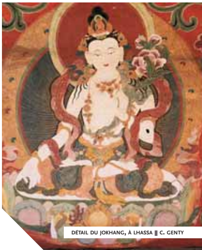
DÉTAIL DU JOKHANG, À LHASA || C. GENTY

liens privilégiés et grâce à qui la jeune femme va supporter sa nouvelle vie. Grâce également à une famille de nomades qui va l'accueillir sans hésiter puisqu'il est dans les traditions du peuple tibétain de recevoir chez soi tout visiteur, que l'on soit pauvre ou riche. Une famille qu'elle va suivre pendant une vingtaine d'années, au gré de leurs déplacements et de leurs besoins, et au sein de laquelle Wen va progressivement prendre une place à part entière. Une famille qui va également l'aider dans sa quête pour retrouver son amour perdu. Une famille qui va surtout lui faire découvrir la beauté de ce peuple nomade, empreint de simplicité et de spiritualité.