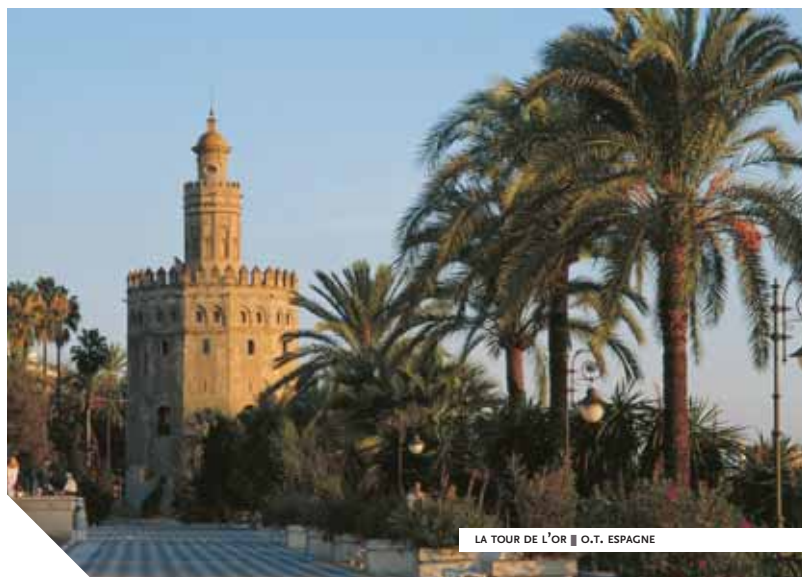
LA TOUR DE L'OR ■ O.T. ESPAGNE

L'Espagne a réalisé la première mondialisation autour de Séville. Avec talent et panache, les conquistadors ont fait de l'expansion outre-mer une "croisade quichottesque". Ils ont seulement tiré les marrons du feu pour permettre l'expansion de la bourgeoisie du nord de l'Europe. Puis Séville est (re)devenue la capitale régionale d'une Andalousie pittoresque et somnolente.