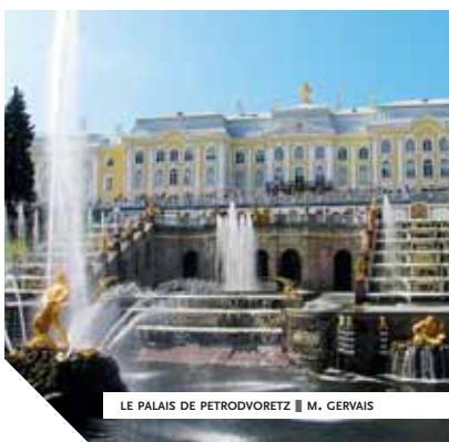
LE PALAIS DE PETRODVORETZ ■ M. GERVAIS

Mais nous avons parfois envie de creuser un sujet, d'aller plus loin lorsque nous retournons sur une terre qui n'est plus incognita . Il s'agit alors de saisir les subtilités du pays, d'en apprécier les nuances, de faire des