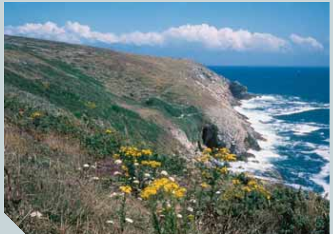
CORNOUAILLE ARMORICAINE || C. DEMOUVEAUX

Longues plages de sable fin, ensoleillées et propices au farniente estival. Éperons rocheux constamment battus par les vents. Falaises verdoyantes qui se jettent dans le bleu atlantique et authentique. Grandes baies peuplées de bateaux. Alternance de criques et de grèves désertiques incitant à la balade. L'Armor, du nom gaulois désignant le "pays au voisinage de la mer", est tout cela à la fois. Et bien plus encore. La diversité des paysages du littoral breton en général, et de Cornouaille en particulier, représente l'un des attraits et des atouts majeurs de la région. Houle, ressac, lames, embruns, large, gréments... tout un vocabulaire qui véhicule une foultitude d'images de mer déchaînée, de marins perdus, de paysages déchirés. Le contact avec la réalité permet de vérifier et de contrebalancer cette imagerie d'Épinal par une atmosphère chaude et tranquille les jours de beau temps, par le calme d'une population qui en a vu d'autres ou la sérénité du chemin des douaniers. Comme un équilibre précaire que la moindre bise peut rompre à tout moment.