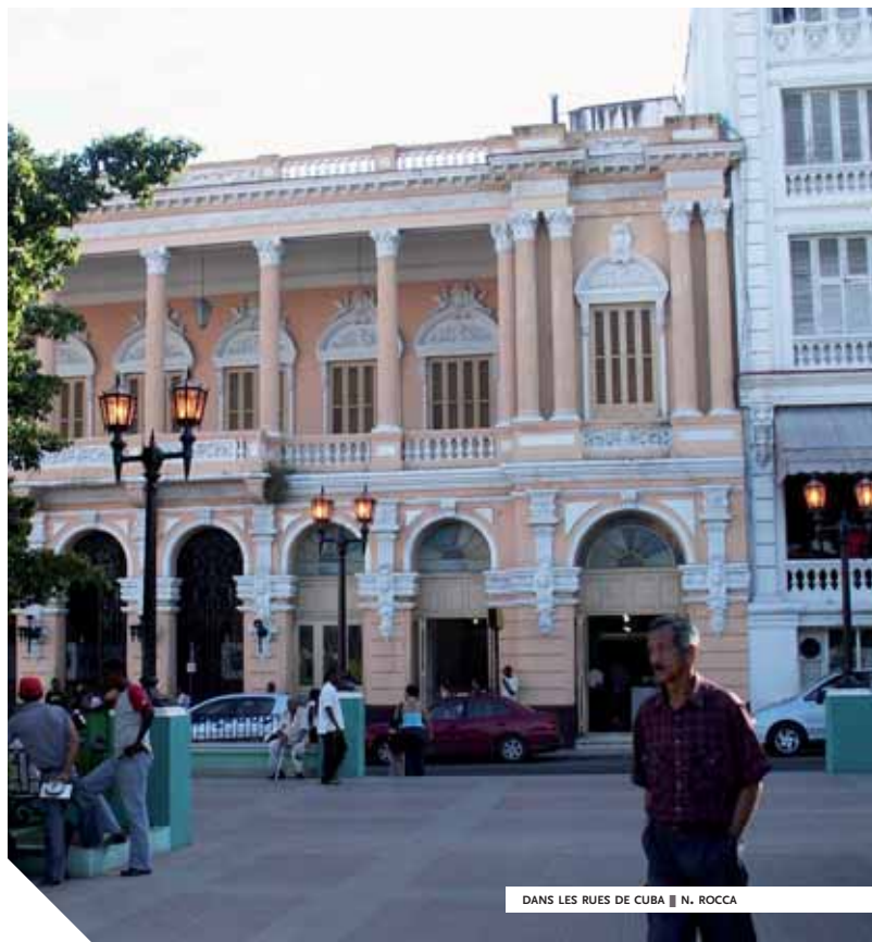
DANS LES RUES DE CUBA

La reine concéda le produit d'une taxe locale et donna une modeste caution (équivalent au coût de la moitié d'un des navires engagés). Elle négocia les Capitulations qui faisaient du navigateur inspiré, sans grand frais, un amiral et un vice-roi des terres “à découvrir” dont il aurait 10 % des bénéfices. Les frères Pinzón, armateurs de Palos, montèrent l'expédition avec des équipages locaux. Trois caravelles partirent le 3 août en utilisant la force de l'alizé et firent escale aux Canaries. Le 12 octobre, alors que les matelots étaient au bord de la mutinerie, Rodrigo de Triana aperçut enfin la côte de Guanahani (Bahamas). Ils abordèrent ensuite à Cuba puis Hispaniola (Saint-Domingue). En mars 1493, deux des trois navires revinrent à Séville en exhibant dix “Indiens” effarouchés. La Santa Maria ayant fait naufrage, les trente-huit marins restés sur l'île furent massacrés.