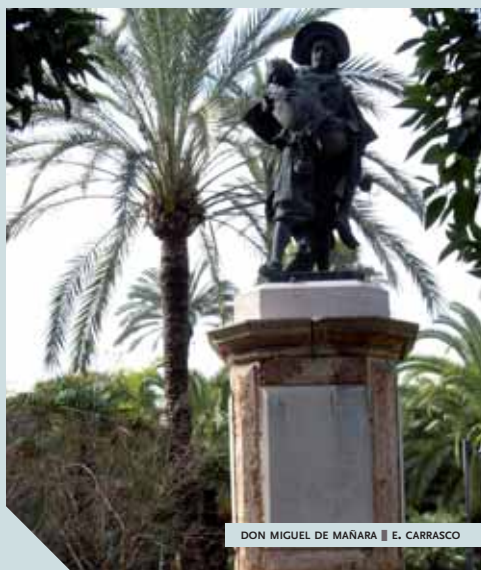
DON MIGUEL DE MAÑARA ■ E. CARRASCO

C'est sur les indications de ce dernier, devenu après sa conversion prieur de l'hôpital de la Charité à Séville, que Juan de Valdés Leal (1622-1690) exécuta deux superbes compositions baroques (vers 1670). Le premier tableau montre le surgissement de la mort "en un clin d'œil" ( In ictu oculi ). Autour du squelette, les signes inutiles du pouvoir, de la gloire et de la richesse. Dans la deuxième image ( Finis gloriae mundi ), la main du divin juge soutient une balance ou les signes des péchés et des vertus s'équilibrent ( ni más, ni meno ) tandis que pourrissent à l'avant-plan les cadavres d'un évêque et d'un chevalier (de l'ordre de Calatrava, comme le commanditaire). La figuration macabre s'exprime à travers un graphisme minutieux (à la flamande) dans une ambiance "ténébriste" qui accroît la densité fantasmagorique. C'est l'une des meilleures représentations de la "Mort baroque" (voir les études des historiens Michel Vovelle et Philippe Ariès), solennelle et théâtrale, l'angoisse exorcisée dans le spectacle.