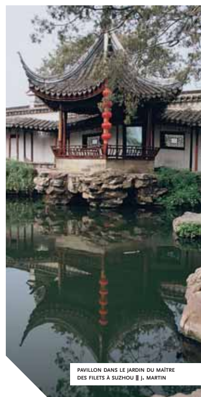
PAVILLON DANS LE JARDIN DU MAÎTRE DES FILETS À SUZHOU ■ J. MARTIN

point de l'héroïne : venant d'une riche famille tibétaine, elle a eu l'occasion de vivre en Chine et livre son point de vue sur le pays, entre choc culturel et fascination. C'est donc avec elle, qui connaît sa langue et a vécu une expérience similaire, que Wen va tisser des