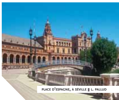
PLACE D'ESPAGNE, À SÉVILLE

Parfois, le choix d'un voyage se fait sur un seul critère, mais non des moindres : l'apport culturel. Il s'agit alors de découvrir de grandes œuvres, d'analyser en détail un aspect bien particulier d'une ville ou d'un pays, comme l'architecture, un courant pictural, les grands maîtres d'une époque, une civilisation... Et cela ne peut se faire qu'avec l'aide de spécialistes, au cours de conférences, de parcours thématiques ou de visites bien ciblées qui nous éclairent et nous guident vers le savoir et la connaissance. C'est pour cela qu'Arts et Vie a créé ses "forums" et ses "routes du savoir". Sédentaires ou ayant la bougeotte, ces voyageurs ont au moins un point commun : leur envie d'apprendre et de se cultiver.