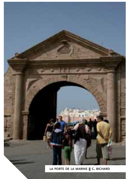
LA PORTE DE LA MARINE ■ C. BICHARD