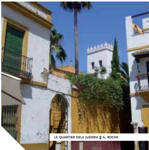
LE QUARTIER DE LA JUDERIA ■ A. ROCHE

administration judiciaire des contentieux et perception de l'impôt royal sur les productions (en particulier minières). Dans la tour de l'Or, jadis dressée par les Almohades sur la rive gauche du Guadalquivir, là où l'ancien rempart rejoignait le fleuve, on entreposait à l'arrivée les trésors venus des Indes. Bien d'autres monuments exprimèrent plus tard l'activité nouvelle, comme la superbe Loge des marchands (casa Lonja).