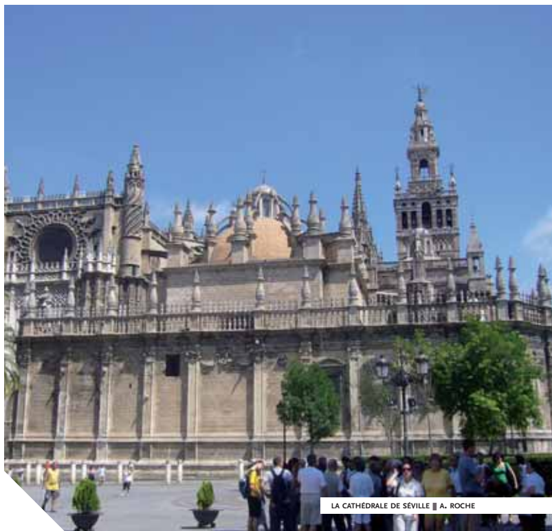
LA CATHÉDRALE DE SÉVILLE ■ A. ROCHE