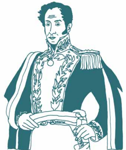
Figure emblématique de l'indépendance de l'Amérique latine, icône révolutionnaire dont l'idéologie influence aujourd'hui encore la vie politique, Simon Bolivar tient une place toute particulière dans le cœur de bien des Sud-Américains. Places, statues, aéroports et universités rendent hommage au Libertador qui incarne la résistance de tout un peuple face à l'opresseur. Ses actions militaires mais aussi ses idées ont laissé une empreinte forte dans l'histoire du continent jusqu'à faire de ce général une véritable légende qui a su traverser les siècles.

Lorsqu'il retransverse l'Atlantique, l'Espagne est affaiblie par l'invasion napoléonienne et les idées indépendantistes prennent de l'ampleur. Commence alors, à l'orée des années 1810, une lutte parfois violente mais toujours passionnée pour libérer les vice-royautés hispaniques de la domination du colonisateur européen. Simultanément, les peuples qui composent la Nouvelle-Grenade se soulèvent. L'ambition du général et membre de la Société patriotique, Simon Bolivar, est alors de réunir les efforts de tous les Sud-Américains pour gagner la guerre et de créer une ligue des nations de l'ancienne Amérique espagnole. Il tente d'unifier des armées disparates et mal équipées afin de lutter contre un ennemi souvent bien mieux armé.