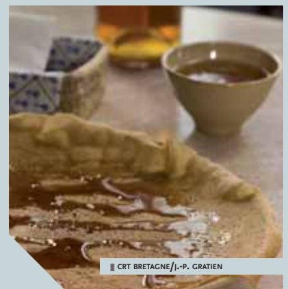
|| CRT BRETAGNE/J.-P. GRATIEN

Difficile de dissocier la Bretagne de sa spécialité gastronomique : la crêpe. Ou plutôt les crêpes, tant les variétés diffèrent d'une région à l'autre, voire d'une famille à l'autre. D'origine très ancienne (vers 7 000 ans avant J.-C.), la recette de base est des plus simples. Il s'agit d'un mélange de farine et d'eau que l'on retrouve dans toutes les civilisations, qu'il soit réalisé à partir de farine de blé (Europe), de farine de riz (Asie), de farine de maïs (Amérique du Sud)... Au XII e siècle, les croisés rapportèrent le sarrasin d'Asie et cette plante trouva en Bretagne une terre tout à fait accueillante. C'est ainsi que se développa dans la région la galette de sarrasin, avant d'être concurrencée par la crêpe de froment, céréale jusqu'alors beaucoup trop chère. Pour les défenseurs de la tradition, la crêpe se nomme galette, ne se prépare qu'avec de la farine de sarrasin et se complète d'une garniture salée, comme les œufs, les saucisses... Pour les adeptes de la friandise, elle est à base de farine de froment, douce et légère, et se mange nature, avec de la confiture, du beurre salé ou toute autre garniture sucrée. Il convient de les accompagner d'une bolée de cidre ou d'un verre de lait ribot – légèrement fermenté et typiquement breton. Bon appétit !