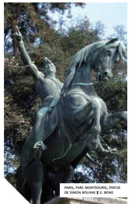
PARIS, PARC MONTSOURIS, STATUE DE SIMON BOLIVAR

Simon Bolivar passe son enfance et sa jeunesse chez son grand-père puis chez ses oncles qui le confient comme interne au directeur de l'école publique, Simon Rodriguez. Le jeune garçon sera certainement très influencé par cet homme, admirateur de Rousseau et de la philosophie des Lumières. À 16 ans, son oncle l'envoie en Europe pour tenter d'assagir l'adolescent devenu agité et fugueur. Il séjourne tout d'abord à Madrid puis à Paris où il mène une vie sociale très intense. Il apprend beaucoup dans les salons qu'il fréquente assidûment. Mais surtout, il observe les événements politiques qui voient l'avènement du jeune général Bonaparte dont il admire le génie militaire. En France, il retrouve son maître et ami Simon Rodriguez avec qui il part à Rome. La légende raconte que c'est là, au sommet du mont Sacré, qu'il jura solennellement de libérer l'Amérique du Sud de la domination espagnole, le cœur et l'esprit pleins des idées de liberté et d'égalité de la Révolution française.