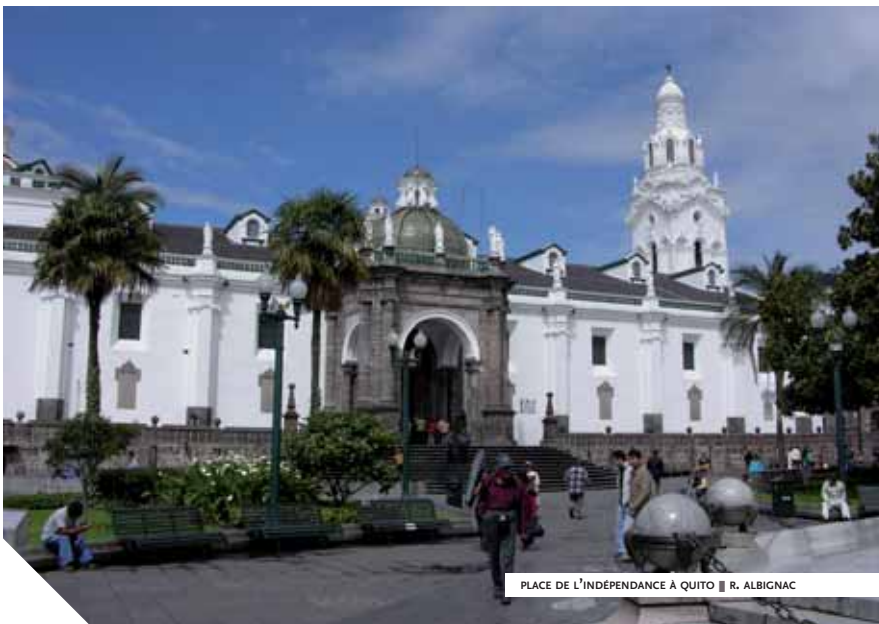
PLACE DE L'INDÉPENDANCE À QUITO

À Quito, un premier coup d'État intervient le 10 août 1809. Aujourd'hui fête nationale en Équateur, cette date restera, malgré les nombreux revirement de situations qui suivront, comme la première étape d'une