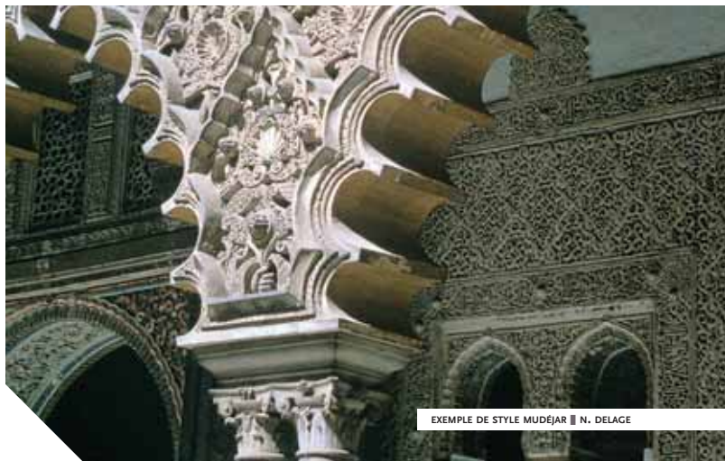
EXEMPLE DE STYLE MUDÉJAR ■ N. DELAÇE

Dans une monarchie farouchement intégriste qui a expulsé les juifs en 1492 et les morisques en 1609, toute exploitation commerciale est exclusivement réservée aux Castillans, mais une licence peut être accordée aux autres sujets du souverain espagnol. Parmi les nombreux étrangers, les Français ont des positions modestes de boutiquiers ou d'artisans, mais certains se font passer pour Flamands ou Franc-Comtois. Les Génois contrôlent l'essentiel des tractations financières de la monarchie espagnole dont ils sont, par contrat, les prêteurs et les banquiers. Très présents à Séville, ils se sont souvent unis à des familles locales et naturalisés. Beaucoup d'autres ont des intermédiaires locaux, des "facteurs" ou simplement des "prête-noms". Les étrangers ne peuvent pas exporter d'argent : il leur faut trouver des stratagèmes pour bénéficier de leur gain. Ainsi au large de Cadix, avant l'arrivée, s'organise une contrebande : des capitaines espagnols livrent aux Anglais ou aux Hollandais la part qui revient à certains marchands.