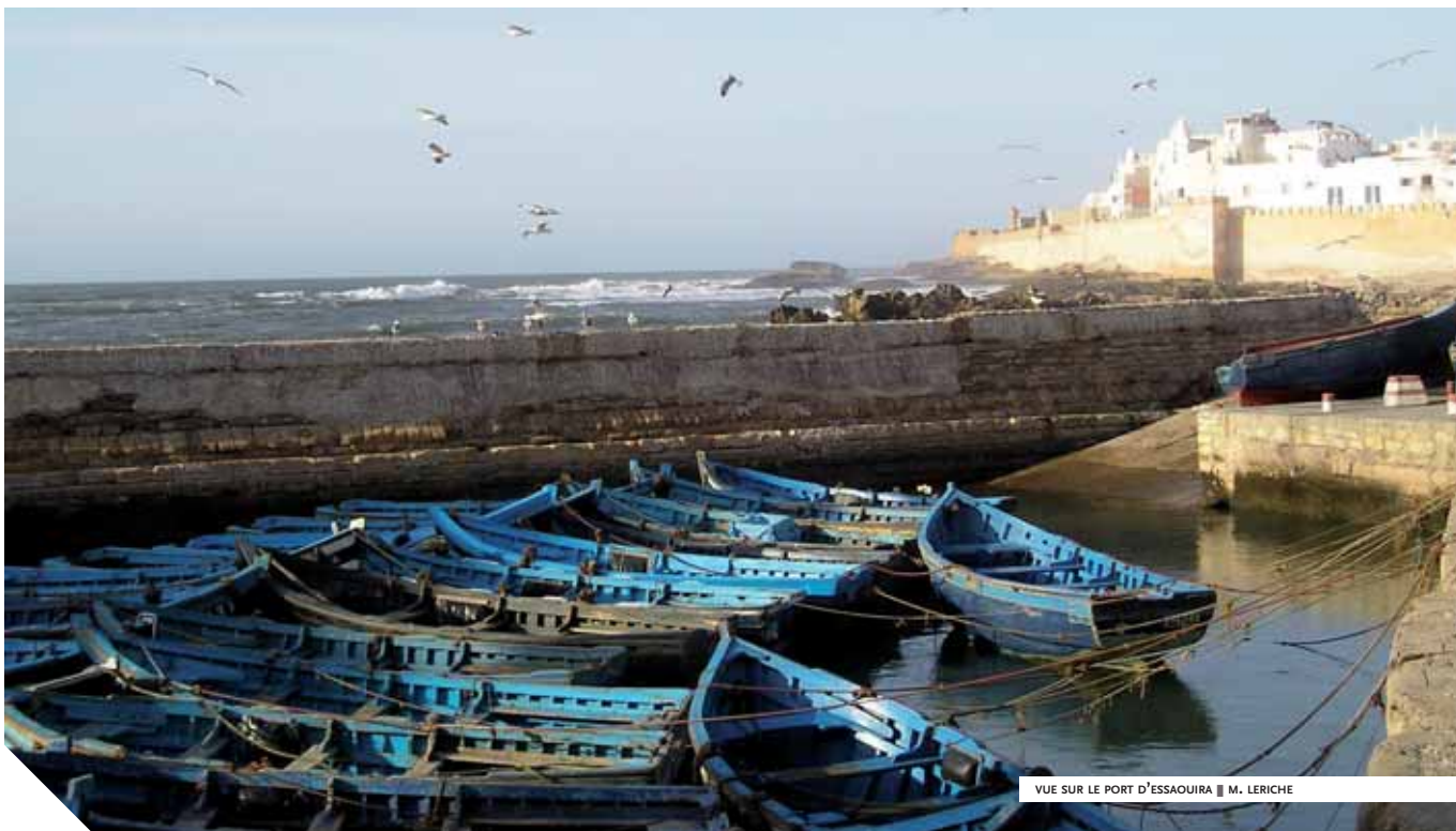
VUE SUR LE PORT D'ESSAOUIRA ■ M. LERICHE

Ici la mer vient se cogner aux sombres rochers, à l'ocre des remparts. Ici la chaleur brûlante du désert laisse place à la fraîcheur d'une brise marine. Essaouira l'océanique, la lumineuse s'avance fièrement et audacieusement en direction de l'Atlantique. Nous sommes dans une ville portuaire tournée vers l'immensité bleue. La foule y est dense et l'activité incessante. L'ancienne Mogador se découvre comme on pénètre un labyrinthe. Il faut savoir s'y perdre... s'étonner des bruits, des odeurs et savourer le charme discret d'une cité envoûtante.