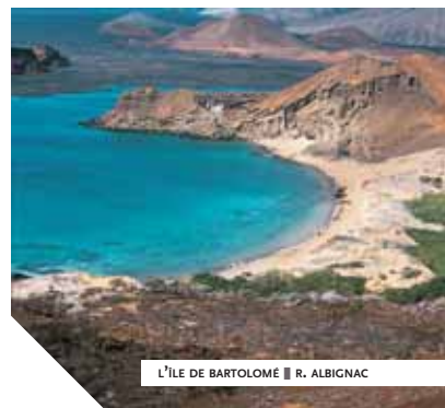
L'ÎLE DE BARTOLOMÉ ■ R. ALBIGNAC

Si le voyage s'entend toujours comme une découverte, certains d'entre nous sont plutôt dans une recherche de l'insolite. Paysages époustouffants, civilisations méconnues, trésors cachés... beaucoup d'endroits correspondent à ces descriptions. Un mode de transport ou d'hébergement différent offre un autre point de vue sur ce qui nous entoure. Voir le monde de la mer, par exemple, grâce aux croisières d'Arts et Vie, permet d'aborder les lieux avec un regard neuf. De la même façon, les périple en train, à travers la Sibérie, la Suisse ou ailleurs, donnent au visiteur une vision totalement différente du pays et de ses réalités. Et pour les plus curieux, c'est un tour du monde qui peut les satisfaire. Parcourir le globe de part en part demeure une expérience inégalée.