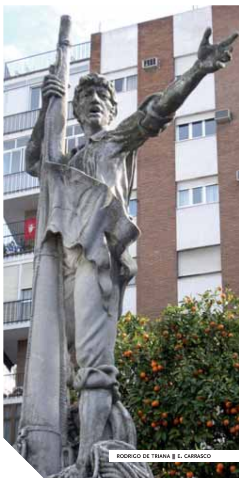
RODRIGO DE TRIANA ■ E. CARRASCO

Colomb s'était trompé dans ses calculs et les archipels orientaux étaient beaucoup plus loin ; personne ne pouvait imaginer qu'au milieu de l'océan il y avait un autre continent. Après un voyage en 1498, Amerigo Vespucci, cartographe toscan avisé, comprit mieux la topographie et sut médiatiser son hypothèse. Le cosmographe Waldseemüller la confirma et proposa le nom d'Amérique en 1507. Entre-temps, Colomb avait réalisé quatre expéditions avec diverses vicissitudes : accusé de malversations et d'abus de pouvoir, il fut jugé et ramené à Séville dans les fers en 1500 avant de repartir, réhabilité, chercher un passage sur l'isthme (1502-1504). Il mourut en 1506, sans comprendre qu'il avait découvert un nouveau continent.