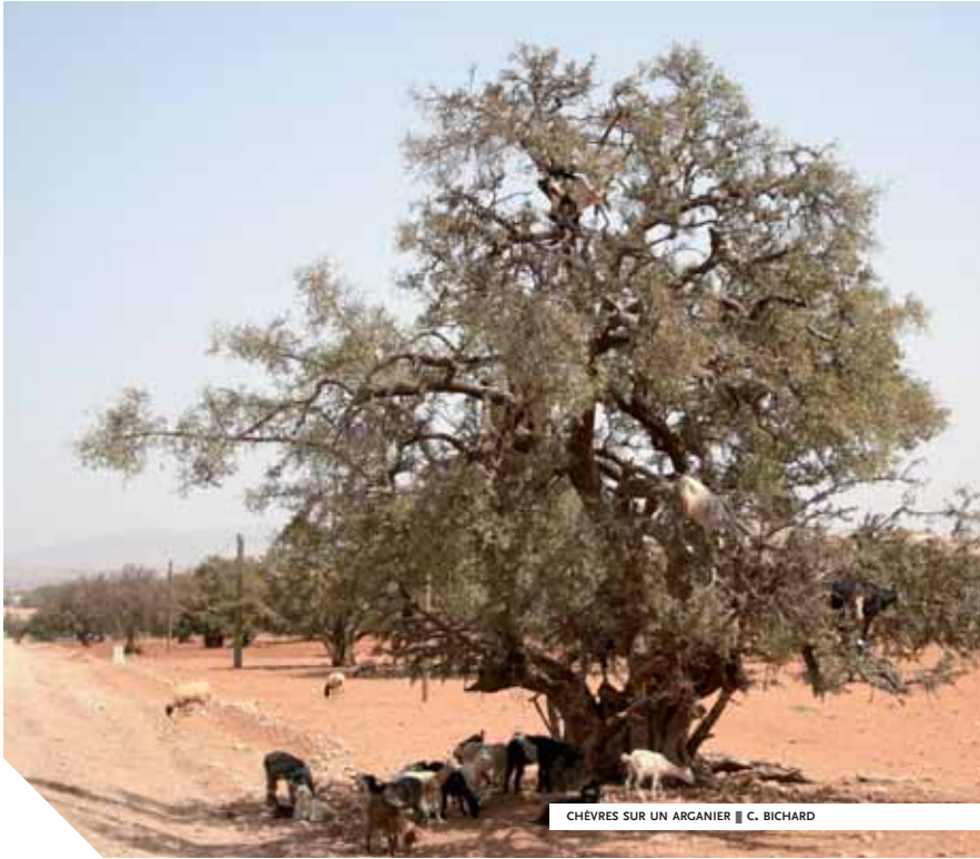
CHEVRES SUR UN ARGANIER

marché à la criée est encore bien vivant. Essaouira n'est pas une beauté que l'on admire dans le silence et le recueillement. On y crie, on y exprime son enthousiasme pour sa richesse architecturale. Les remparts et la médina, très beaux exemples de transposition du modèle européen de fortification en Afrique du Nord, vaut d'ailleurs à la cité marocaine d'être classée au patrimoine mondiale par l'Unesco depuis 2001. Une fois passée la porte de la Marine (construite par un Anglais en 1769), nous arrivons place Moulay Hassan que viennent égayer les terrasses des cafés et restaurants.