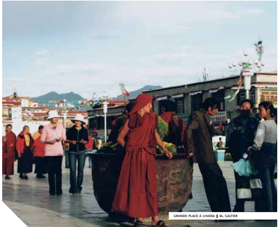
GRANDE PLACE À LHASA