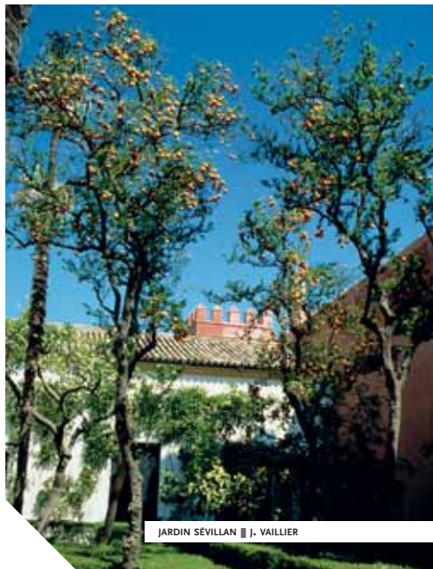
JARDIN SÉVILLAN ■ J. VAILLIER

Les nouveaux riches exhibent une élégance ostentatoire. Dans les beaux quartiers, les belles dames sont au balcon de vastes demeures ouvertes sur la rue. Les Sévillanes sont célèbres pour leur élégance désinvolte.