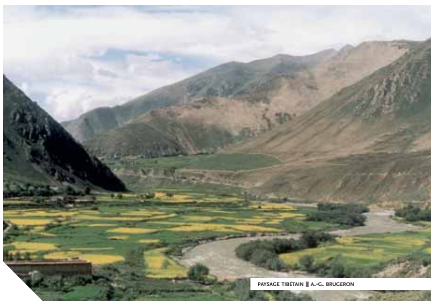
PAYSAGE TIBÉTAIN

Certains voyages se font par curiosité. D'autres par défi. Certains par envie. Et d'autres encore se font par nécessité, parce qu'on n'a pas le choix, qu'il y va de notre survie. C'est l'un de ceux-là qu'a entrepris Shu Wen, de la Chine au Tibet, à la recherche de son mari donné pour mort.