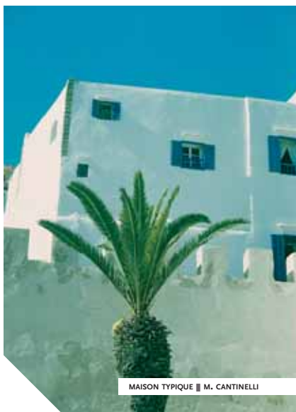
MAISON TYPIQUE ■ M. CANTINELLI

guide nous apprend qu'Essaouira était déjà une escale pour les navigateurs phéniciens durant l'Antiquité, avant d'être fréquentée par les Romains qui venaient y acheter de la