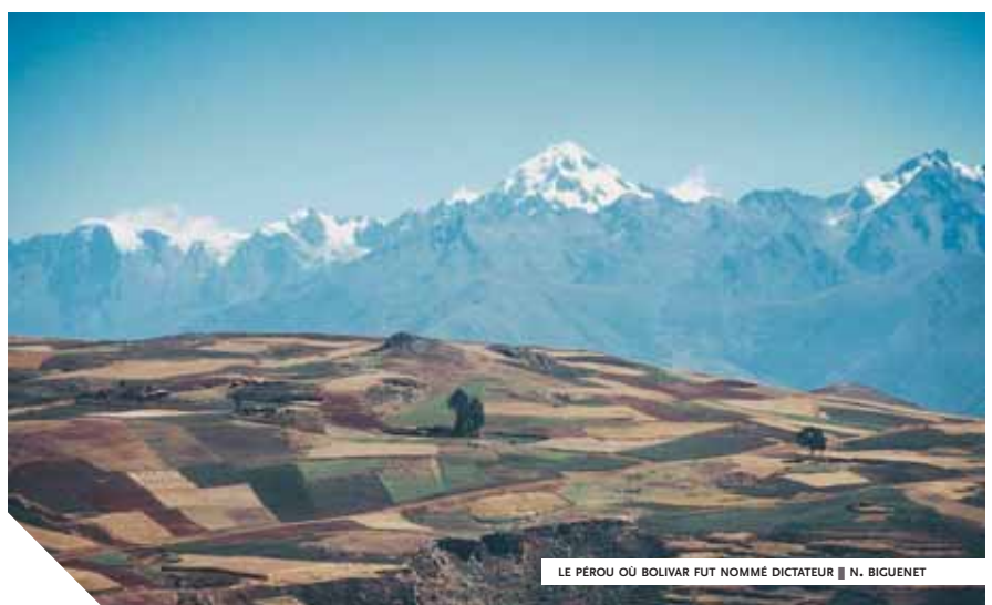
LE PÉROU OÙ BOLIVAR FUT NOMMÉ DICTATEUR ■ N. BIGUENET

Malgré les excès dont il s'est rendu coupable, Simon Bolivar reste un personnage essentiel en Amérique latine. Sa vie entière dévouée à la libération de son continent, son combat pour l'émancipation politique et économique des pays sud-américains sont toujours des exemples pour nombre de politiciens et un idéal pour le peuple. Un pays, deux monnaies (le boliviano en Bolivie et le bolivar au Venezuela), un cigare cubain... portent son nom, comme un hommage à cet idéaliste précurseur qui changea le cours de l'histoire.