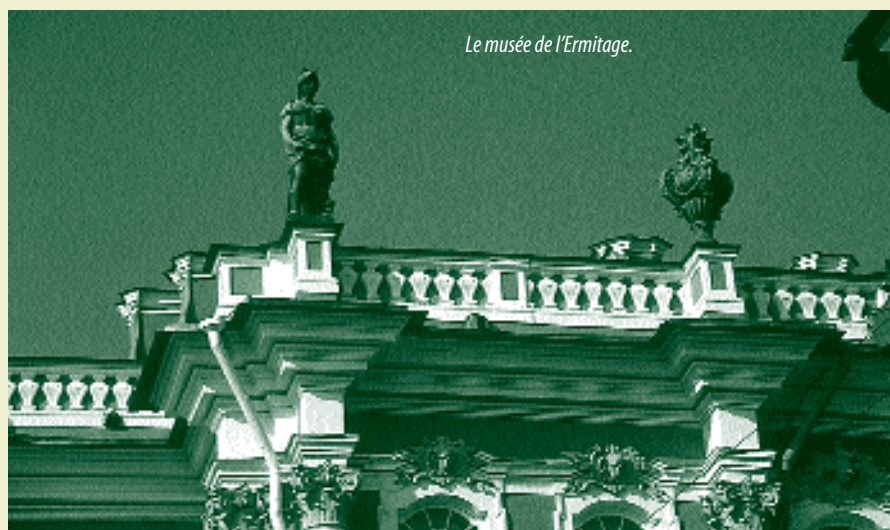
Le musée de l'Ermitage.