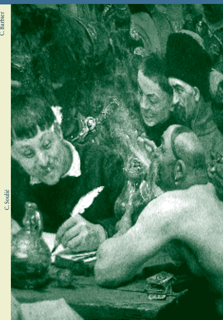
Répine, Les cosaques saporogues, musée de l'Ermitage.

■ À cette occasion sera donné, pour la première fois en Russie, l'oratorio du compositeur polonais Krzysztof Penderecki Les sept portes de Jérusalem , dirigé par le compositeur lui-même et auquel prendront part 400 musiciens venus de six pays d'Europe.