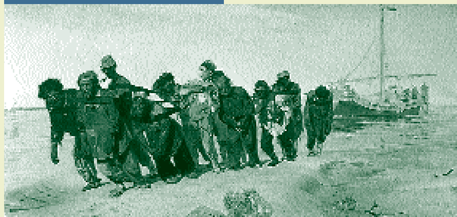
Repine, Les bateliers de la Volga, musée Russe.

Le Musée russe prévoit de nombreuses expositions sur l'histoire de Saint-Pétersbourg.