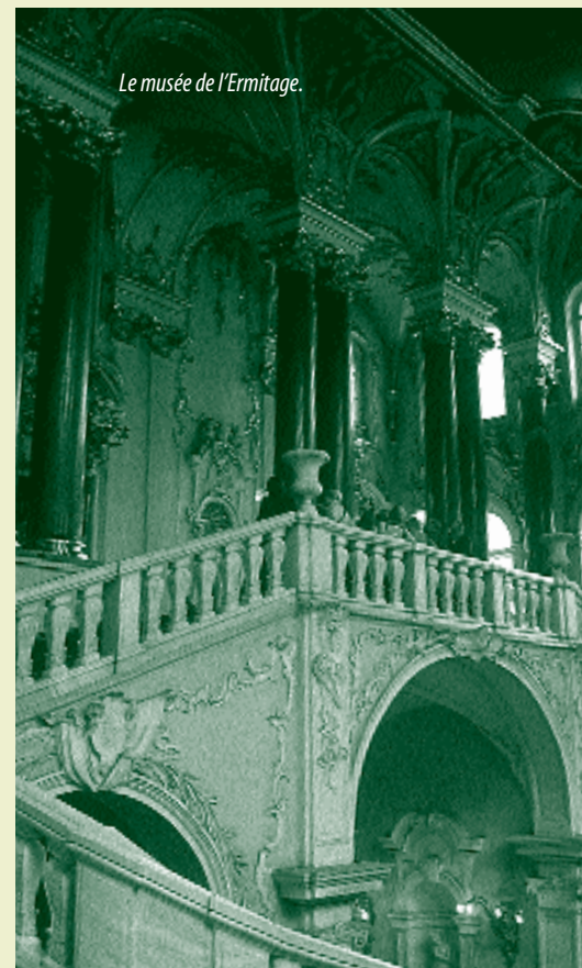
Le musée de l'Ermitage.

Ce fut du reste la dernière œuvre de Rastrelli à Saint-Pétersbourg, mais peut-être pas la meilleure, même si on ne lui conteste pas deux caractéristiques tout à fait louables : le luxe et la solidité. On pourrait penser que la longueur de cette gigantesque façade avec sa lourdeur et son excessive profusion de sculptures et d'ornements divers sont ses points faibles, mais, comme l'écrivit Igor Grabar, éminent peintre et historien de l'art russe,