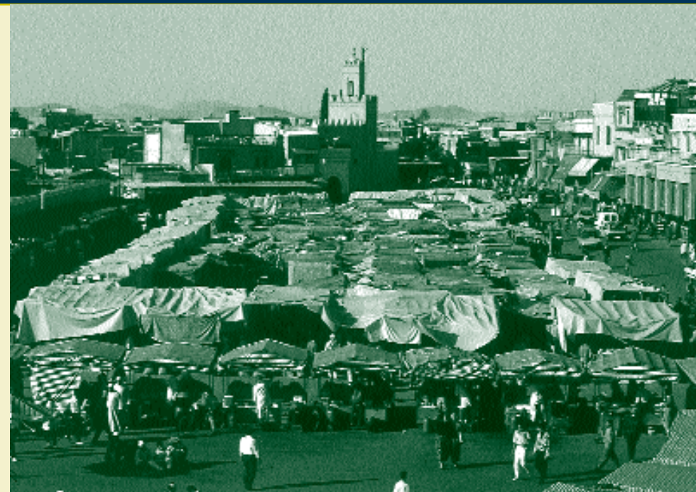
La place Jemaa el Fna.

déforment les cercles ( helqa ) de spectateurs, pour admirer les multiples facettes d'une créativité spontanée et multiforme.