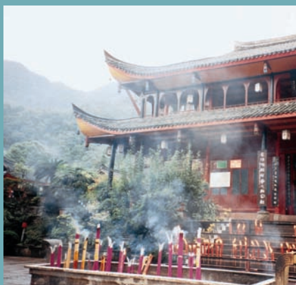
LE TEMPLE WANNIANSI DERRIÈRE UN NUAGE D'ENCENS [ M.-N. RAYMOND ]

Lorsque les premiers Européens (les jésuites) parvinrent à pénétrer l'empire du Milieu, à la fin du XVI e siècle, ils virent en Confucius, à juste titre, le principal référent de la société qu'ils découvraient. Or il se trouve qu'à l'époque, le gouvernement impérial réglementait l'usage des images représentant le grand homme, sous le seul aspect d'un très humain et honorable lettré. Les cérémonies en son honneur, en effet, liées aux pompes de l'État, n'étaient pratiquées qu'au sein des élites instruites, fort méfiantes à l'égard des dévotions populaires, jugées déviantes. La même attitude animait aussi les lettrés à l'égard de tout rituel jugé ésotérique – fût-il taoïste ou bouddhiste (taoïsme, confucianisme et bouddhisme constituant, depuis les travaux des philosophes Song (960-1279), les "trois enseignements" sur lesquels se fonde l'univers intellectuel et religieux des élites chinoises).