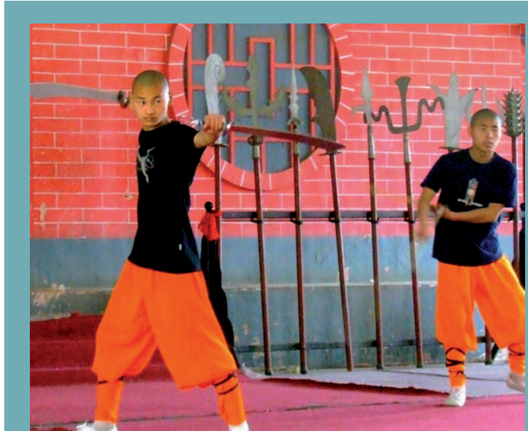
DES MOINES SHAOLIN

Puis vient "l'après-Mao" et donc une forme d'apaisement instable. Le Baiyuguan est rouvert au public (1984), en même temps que l'on revivifie peu à peu les anciennes associations culturelles régionales ou de quartier. Les pèlerins, alors, se précipitent et, dès 1991 puis 1992, Jiang Zimin (secrétaire général du Parti communiste et, de ce fait, chef de l'État) autorise le rétablissement des cultes non chamaniques : ceux qui relèvent des écoles Quanzhen (recherches sur la longévité) et Zhengyi (qui enseigne aux laïcs comment pratiquer dans la vie courante). L'État admet aussi que l'on ordonne des prêtres et consent à la venue de maîtres étrangers ; Hong Kong (la ville ne revient