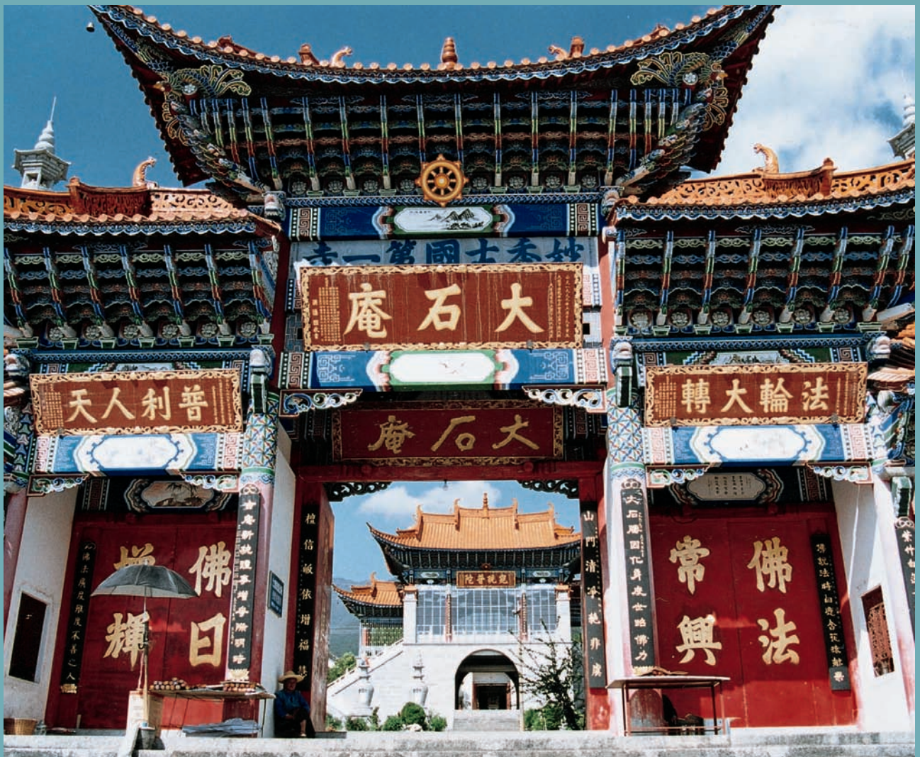
LE TEMPLE DE GUANYIN À DALI - [ B. BONNET ]

[ PAR DANIELLE ELISSEFF, DIRECTRICE DE RECHERCHE DE L'EHESS ]