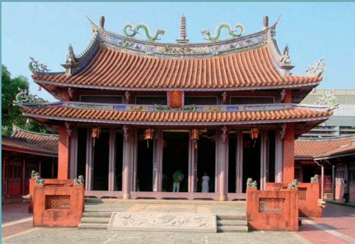
CHUAN TAI SHOU HSUEH, CÉLEBRE TEMPLE CONFUCÉEN DE 1665

Les ancêtres et les dieux locaux que vénérât le peuple perdent aussi leur pouvoir. La jeunesse urbaine et instruite, les partisans du renouveau se tournent vers d'autres héros prêts à prendre la relève : des hommes, toujours vivants ou disparus depuis peu – Karl Marx, Lénine, et bientôt le président Mao. Les grandes religions monothéistes ont beau se battre pour conquérir les cœurs – ce qu'elles font quand le gouvernement ne l'interdit pas – leur message guide un certain nombre de particuliers, mais non la masse des citoyens.