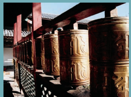
DES MOULINS À PRIÈRE, OBJETS CULTURELS DU BOUDDHISME [ D. BOY ]

Les acteurs de la jeune République (1912-1949), par exemple, n'autorisent (1920) que les temples dédiés à des personnages pouvant constituer des