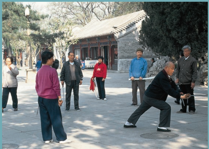
PRATIQUE DU TAI CHI À BEIHAI - [ G. KESLER ]

Enfin, à côté de ce taoïsme spirituel – porté vers la méditation, l'enseignement, l'étude des textes anciens et l'acquisition de la maîtrise de soi – il en existe un autre, beaucoup plus couramment visible et vivant : un taoïsme populaire et protéiforme, avec devins, voyantes, guérisseurs, masseurs, pourvoyeurs de médications plus ou moins étranges et magiciens. Les pratiquants les plus sérieux enseignent le désormais célèbre qigong (gymnastique avec exercices respiratoires) ou tentent d'aider les gens en écoutant leurs angoisses et en cherchant des réponses dans les diagrammes divinatoires du Livre des mutations (le Yijing ).