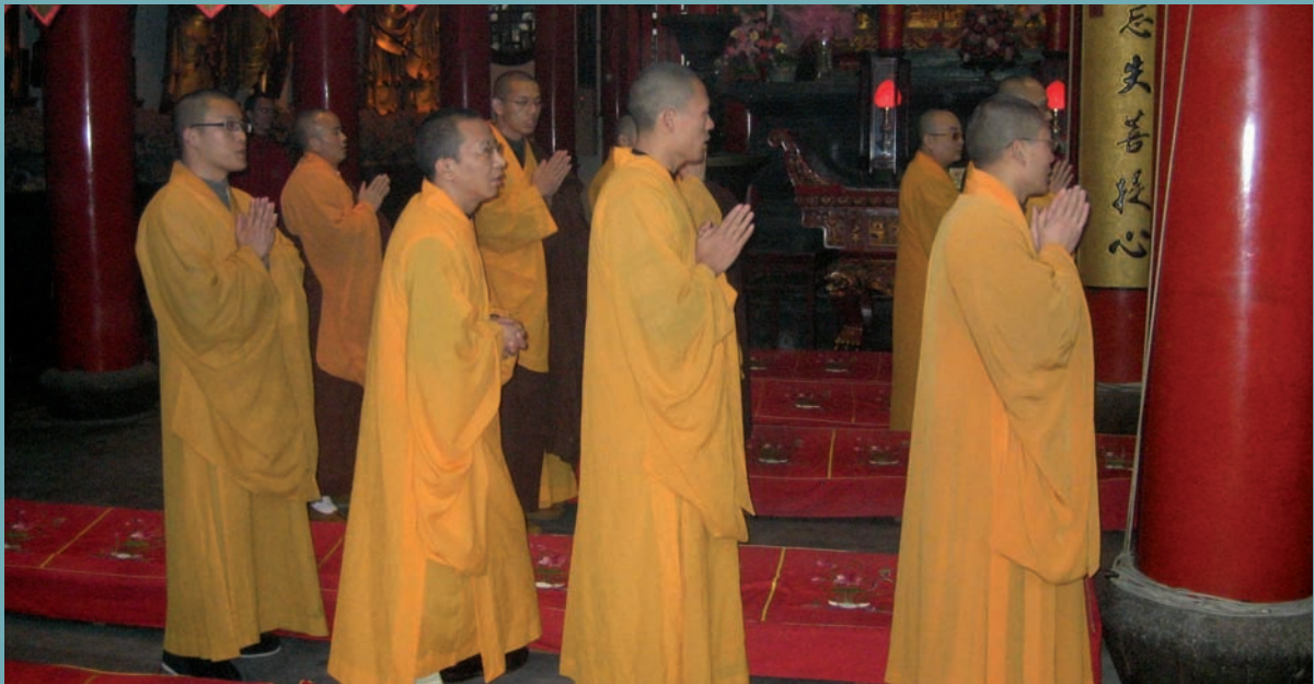
MOINES EN PRIÈRE DANS LA CHINE CONTEMPORAINE - [ B. METZDORF ]

La situation des chrétiens est beaucoup moins assurée, notamment pour les catholiques dont les liens avec la papauté sont mal perçus, comme ils l'étaient déjà sous l'Empire. Il existe en effet deux Églises – celle, officielle, dont les prêtres