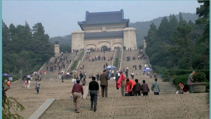
LE RETOUR AU TEMPLE DES CHINOIS - [ B. BAILLOUX ]

Ce renouveau du religieux sert enfin, par le biais d'associations culturelles développées autour des temples locaux, à drainer des fonds pour restaurer ou moderniser les sanctuaires, certes, mais aussi prendre en charge des tâches que l'État ne parvient pas à assumer, notamment dans les zones rurales où l'argent manque cruellement.