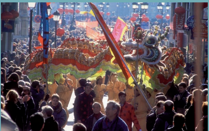
LE NOUVEL AN CHINOIS À PARIS

La nouveauté, car il y en a une, est qu'il commence à s'exporter : Tu Weiming, de l'université Harvard, chante à Boston la valeur universelle et la modernité des vertus confucéennes ; le dalaï-lama, inlassable opposant au régime, a internationalisé et profondément revivifié les valeurs bouddhiques transmises par la pensée tibétaine, tandis que la diaspora chinoise impose pacifiquement au monde entier ses fêtes et ses pratiques taoïstes. Ainsi, la Chine athée devient peu à peu, et paradoxalement, une grande pourvoyeuse d'idées religieuses et de comportements rituels qui, d'un continent à l'autre, tendent à s'unifier.