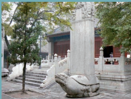
LE TEMPLE DE BAIYUNGUAN

À partir de 1953, de plus, les communautés, particulièrement les taoïstes, sont suspectées de protéger des activités contre-révolutionnaires – ce qui n'est d'ailleurs pas toujours faux. Dès le début de la Révolution culturelle, elles sont donc systématiquement détruites ou transformées en unités de production agricole. Il existe cependant une exception : le célèbre temple Baiyunguan de Pékin ; mais les quelques moines restants reçoivent l'ordre d'enseigner les mots d'ordre du Petit Livre rouge.