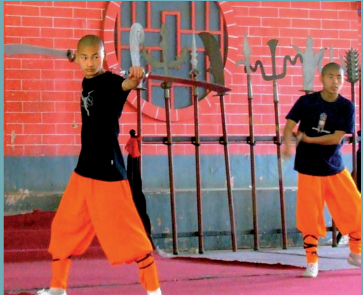
DES MOINES SHAOLIN

Puis vient "l'après-Mao" et donc une forme d'apaisement instable. Le Baiyuguan est rouvert au public (1984), en même temps que l'on revivifie peu à peu les anciennes associations culturelles régionales ou de quartier. Les pèlerins, alors, se précipitent et, dès 1991 puis 1992, Jiang Zimin (secrétaire général du Parti communiste et, de ce fait, chef de l'État) autorise le rétablissement des cultes non chamaniques : ceux qui relèvent des écoles Quanzhen (recherches sur la longévité) et Zhengyi (qui enseigne aux laïcs comment pratiquer dans la vie courante). L'État admet aussi que l'on ordonne des prêtres et consent à la venue de maîtres étrangers ; Hong Kong (la ville ne revient