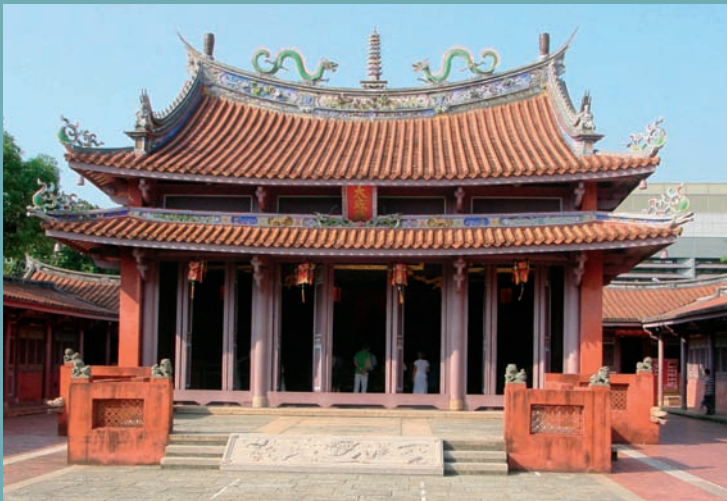
CHUAN TAI SHOU HSUEH, CÉLEBRE TEMPLE CONFUCÉEN DE 1665

Les ancêtres et les dieux locaux que vénérât le peuple perdent aussi leur pouvoir. La jeunesse urbaine et instruite, les partisans du renouveau se tournent vers d'autres héros prêts à prendre la relève : des hommes, toujours vivants ou disparus depuis peu – Karl Marx, Lénine, et bientôt le président Mao. Les grandes religions monothéistes ont beau se battre pour conquérir les cœurs – ce qu'elles font quand le gouvernement ne l'interdit pas – leur message guide un certain nombre de particuliers, mais non la masse des citoyens.