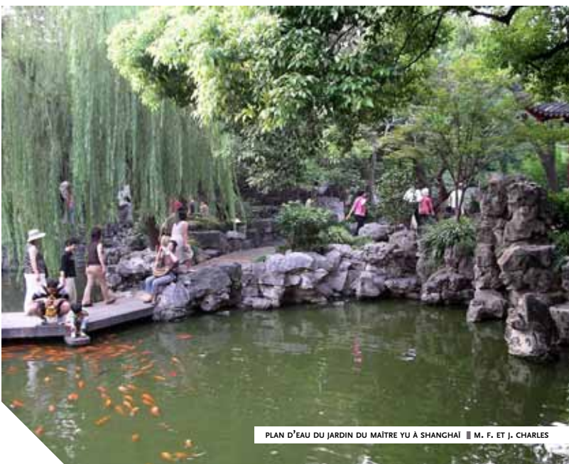
PLAN D'EAU DU JARDIN DU MAÎTRE YU À SHANGHAI ■ M. F. ET J. CHARLES

“ L’eau forme le complément indissociable de la montagne, des pierres et de l’art du jardin. ”