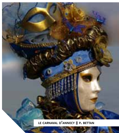
LE CARNAVAL D'ANNECY ■ P. BETTAN

sieurs communautés religieuses viendront renforcer encore le caractère religieux d'Annecy. De cette époque, la ville conserve de beaux monuments venus enrichir