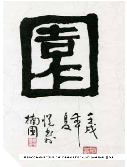
LE SINOGRAMME YUAN. CALLIGRAPHIE DE CHUNG WAH NAN

La dynastie Han a façonné un type spécifique de brûle-parfum, le boshan lu ,