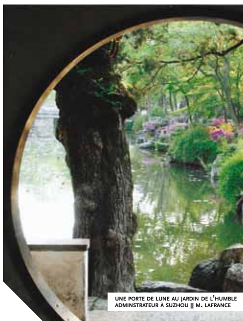
UNE PORTE DE LUNE AU JARDIN DE L'HUMBLE ADMINISTRATEUR À SUZHOU ■ M. LAFRANCE

MÉTALLIÉ Georges, "Lettrés jardiniers en Chine ancienne", Journal d'agriculture et de botanique appliquée , vol. 37, 1995.