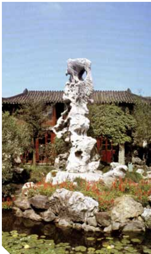
LE PIC DE LA PRIME-NUÉE AU JARDIN DE L'ATTARDEZ-VOUS À SUZHOU ■ C.B. CHIU