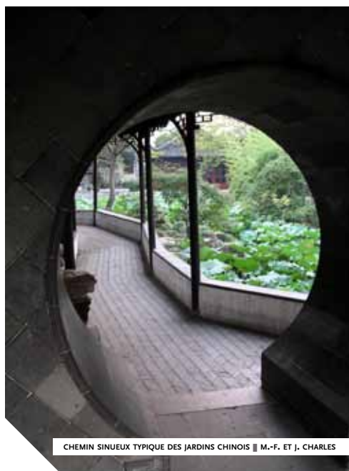
CHEMIN SINUEUX TYPIQUE DES JARDINS CHINOIS

Il "s'en retourne" à la vie érémitique, le tianyuan , pour se consacrer désormais à la culture de ses terres et à l'ivresse que procure l'alcool dans le détachement et la sérénité. Ses écrits, parmi lesquels Retournons-nous-en vivement ! , Retour aux jardins et aux champs et Je bois du vin , vont influencer profondément la création de l'espace paysager. C'est à cette période cruciale que l'esprit lettré prédomine et que l'attrait de la nature propulse la peinture de paysage, dite shanshui , au premier rang des genres picturaux. Parmi les nombreux traités rédigés, le Guhua pinlu du peintre et théoricien Xie He énonce les "six canons de la peinture" dont les principes se transposent parfaitement dans la conception des jardins.