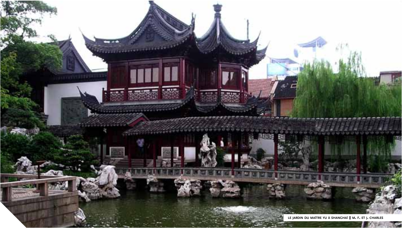
LE JARDIN DU MAÎTRE YU À SHANGHAI ■ M. F. ET J. CHARLES