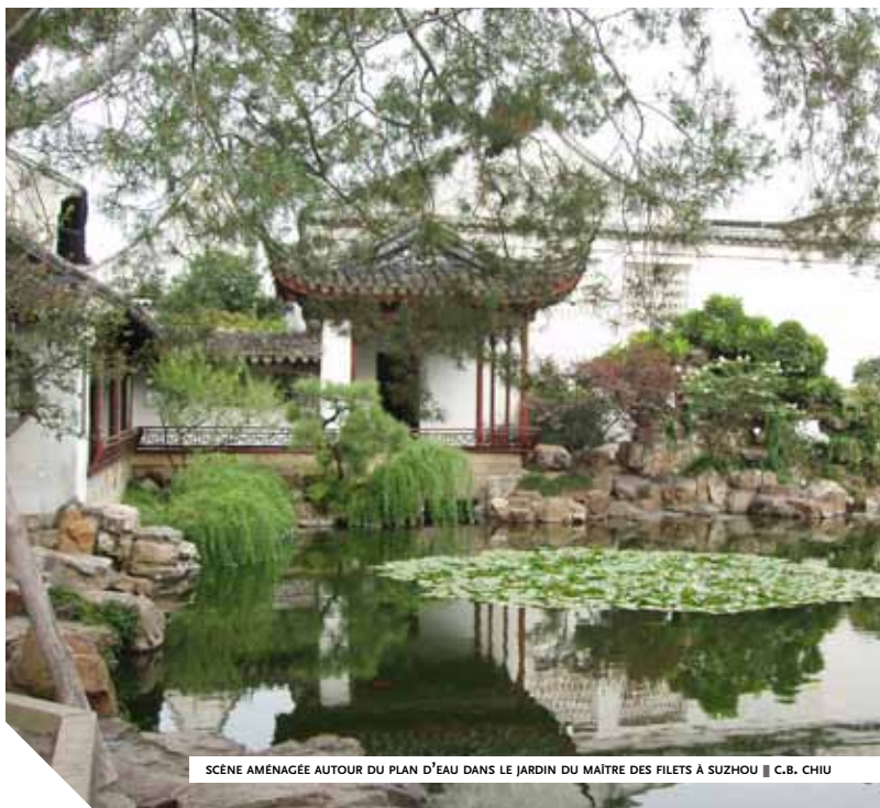
SCÈNE AMÉNAGÉE AUTOUR DU PLAN D'EAU DANS LE JARDIN DU MAÎTRE DES FILETS À SUZHOU ■ C.B. CHIU

Pendant que l'écrivain Tao Yuanming savoure les plaisirs du tianyuan , son contemporain Xie Lingyun s'extasie des paysages qu'il contemple : écrans de falaises qui se pressent au seuil de la porte, flots miroitants qui viennent mouiller l'appui des fenêtres. Ses évocations franchissent les limites de l'enclos et prennent en compte les éléments extérieurs au jardin, établissant un lien entre intérieur et extérieur et créant ainsi l'illusion d'une continuité spatiale avec l'environnement immédiat et plus lointain. Ce principe de prise en compte d'un paysage ou d'un élément extérieur pour les intégrer au jardin constitue l'un des aspects les plus intéressants