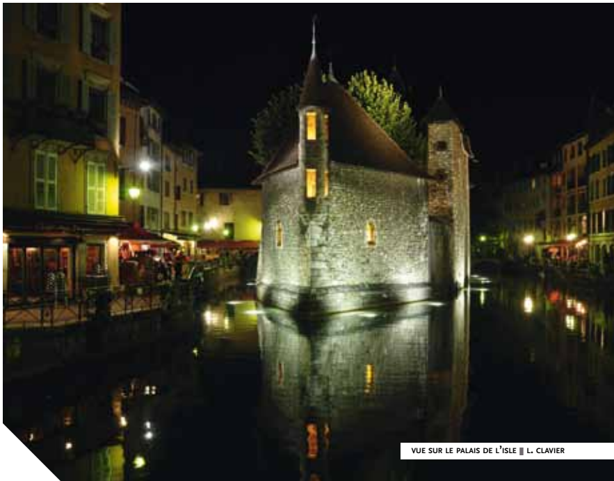
VUE SUR LE PALAIS DE L'ISLE ■ L. CLAVIER