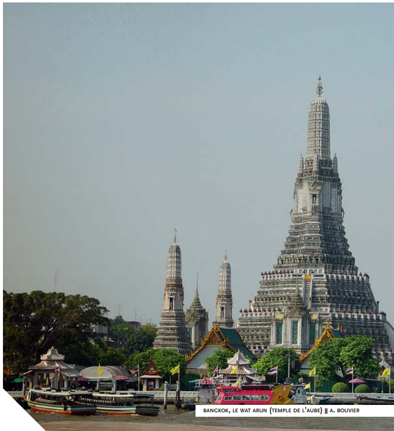
BANGKOK, LE WAT ARUN (TEMPLE DE L'AUBE)

“ Sukhothaï, savant mélange d'urbanisme khmer et de concepts proprement thaïs. ”