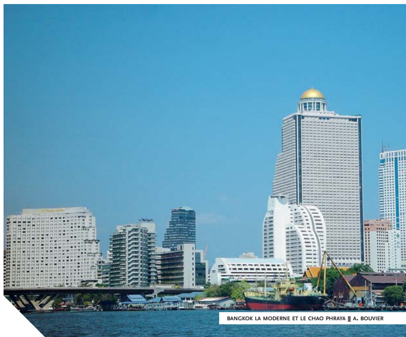
BANGKOK LA MODERNE ET LE CHAO PHRAYA ■ A. BOUVIER

“ Fondé sous le règne de Rama I er , Wat Po, plus populairement appelé temple du Bouddha couché, serait le plus ancien édifice religieux de la cité. ”