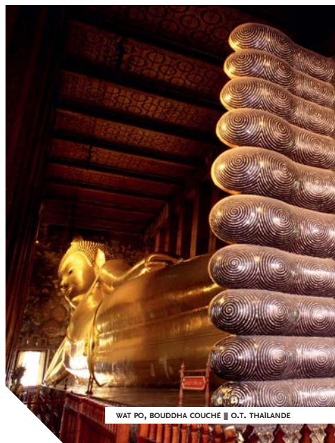
WAT PO, BOUDDHA COUCHÉ ■ O.T. THAÏLANDE

Pour des raisons qui restent aujourd'hui encore assez obscures, Phra Narai délaissa Ayutthaya en 1666 pour s'installer à Lopburi où il resta jusqu'à sa mort. La ville n'en continua pas moins à être fort active et très prospère ; elle redevint l'unique capitale du royaume dès 1688. L'art d'Ayutthaya combine, tant dans son architecture que dans sa statuaire dominée très largement par l'iconographie bouddhique, les apports khmers aux influences singhalaises déjà adaptées à Sukhothai.