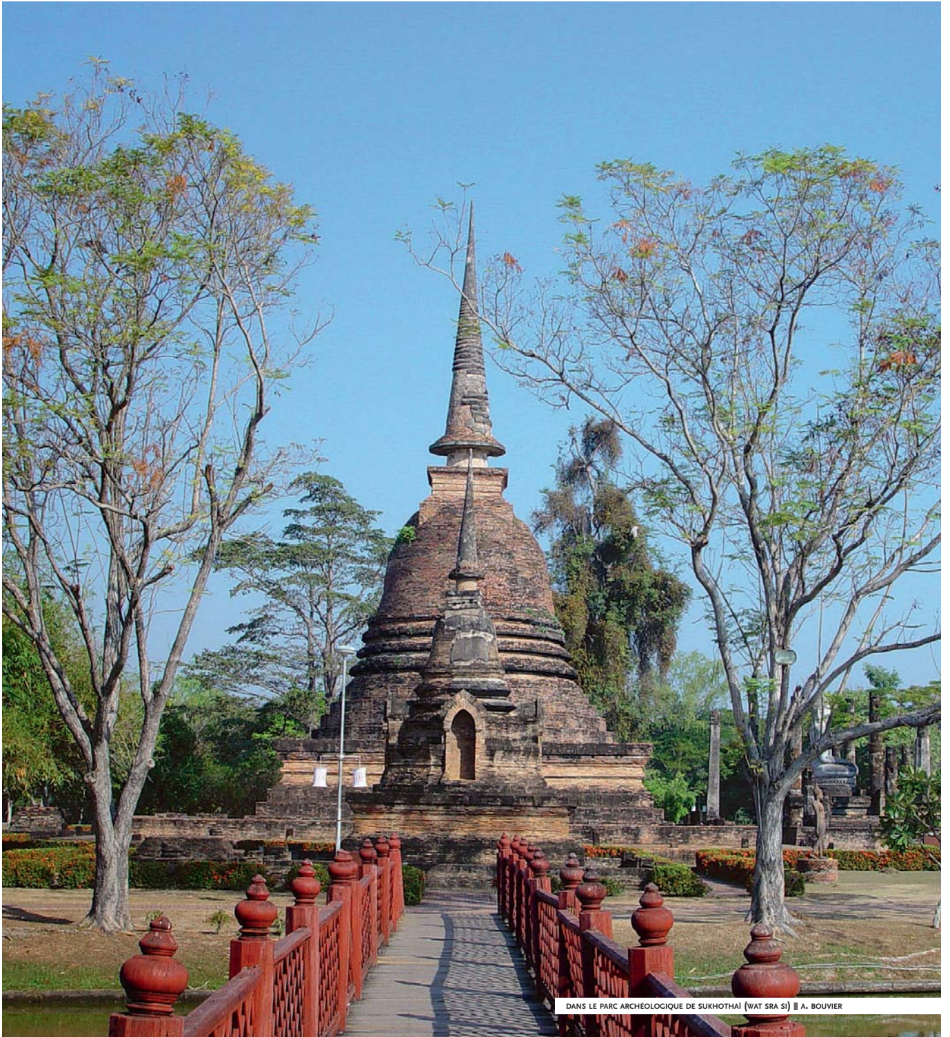
DANS LE PARC ARCHEOLOGIQUE DE SUKHOTHAI (WAT SRA SI)

[ PAR VÉRONIQUE CROMBÉ, CONFÉRENCIÈRE DES MUSÉES NATIONAUX (MUSÉE GUIMET), SPÉCIALISTE DE L'ASIE ]