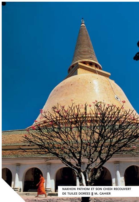
NAKHON PATHOM ET SON CHEDI RECOUVERT DE TUILLES DORÉES

comme une transcription phonétique du nom sanskrit dvâravatî . La découverte ultérieure de monnaies d'argent inscrites, à Nakhon Pathom, confirma cette hypothèse. Les historiens sont aujourd'hui largement revenus sur les certitudes concernant ce supposé royaume, terme auquel on préfère maintenant celui de culture. On ignore en effet largement quelle était la structure politique de Dvâravatî – royaume, confédération, groupe de cités-États relativement autonomes... –, quelles en étaient les limites territoriales, où se situait la capitale s'il en existait une, ou quelles furent les grandes phases de son histoire. Plusieurs sites archéologiques majeurs – Nakhon Pathom et U Thong, pour n'en citer que deux – lui sont associés. Outre des vestiges architecturaux et de multiples objets d'usage courant, ils ont livré des œuvres sculptées témoignant d'un art d'inspiration essentiellement bouddhique d'une incontestable originalité, en dépit d'influences indiennes évidentes. Cette culture – que les inscriptions semblent lier au peuple môn, également présent en basse Birmanie et sur une partie de la péninsule