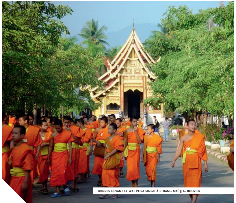
BONZES DEVANT LE WAT PHRA SINGH A CHIANG MAÏ

Tête de pont des Thaïs lors de leur arrivée dans le pays, Chiang Saen fut, dès le XI e siècle, le centre d'une petite principauté indépendante. Le futur roi Meng Rai y naquit en 1238. Il devait abattre Haripunjayan – dernier royaume môn du pays –,