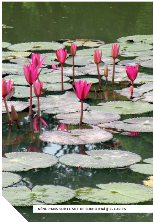
NÉNUPHARS SUR LE SITE DE SUKHOTHAI