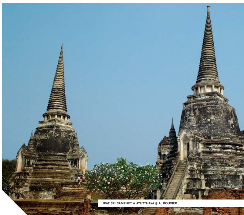
WAT SRI SAMPHET À AYUTTHAYA ■ A. BOUVIER