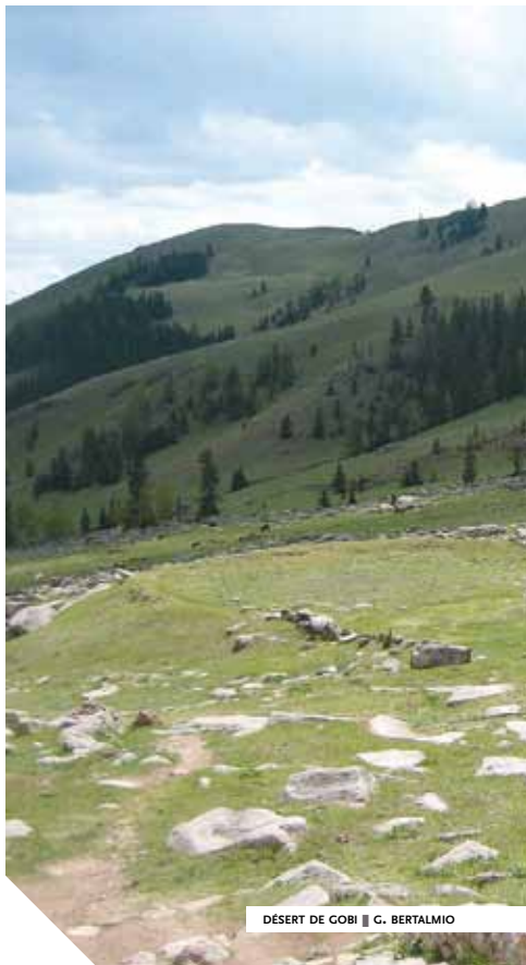
DÉSERT DE GOBI ■ G. BERTALMIO

Urga, longtemps monastère itinérant dont les bâtiments furent montés, démontés et remontés depuis sa création au milieu du xvii siècle en une vingtaine de sites différents, se fixe sur son emplacement actuel en 1779.