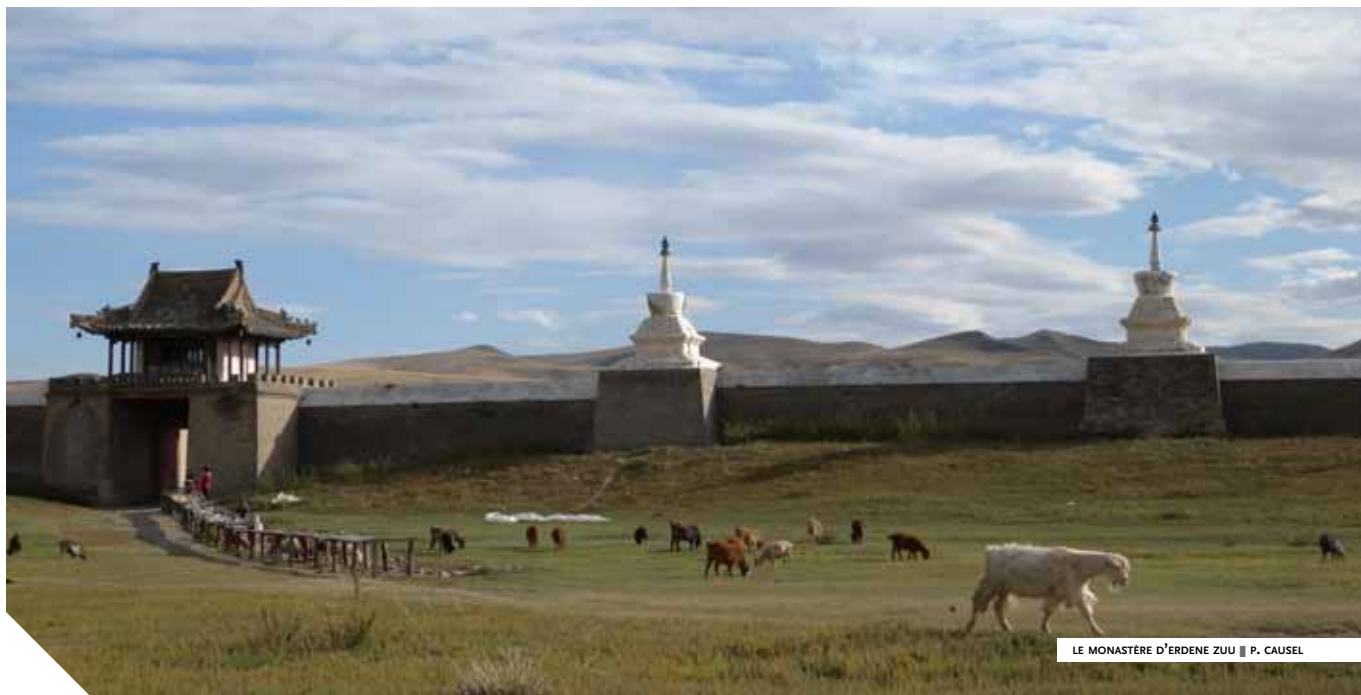
LE MONASTÈRE D'ERDENE ZUU ■ P. CAUSEL

C'est une image mitigée qui vient généralement à l'esprit dès lors que l'on évoque l'épopée mongole. Destructions et massacres n'ont certes pas manqué. Mais une fois la conquête achevée et les positions respectives stabilisées, s'établit d'une extrémité de l'Asie à l'autre une “pax mongolica” qui favorise la circulation des hommes, des marchandises et des idées. L'excellent système de postes mis en place par Gengis Khan joue à plein son rôle. Les souverains mongols font également preuve d'une tolérance religieuse qui facilite grandement les échanges, non sans mener parfois à