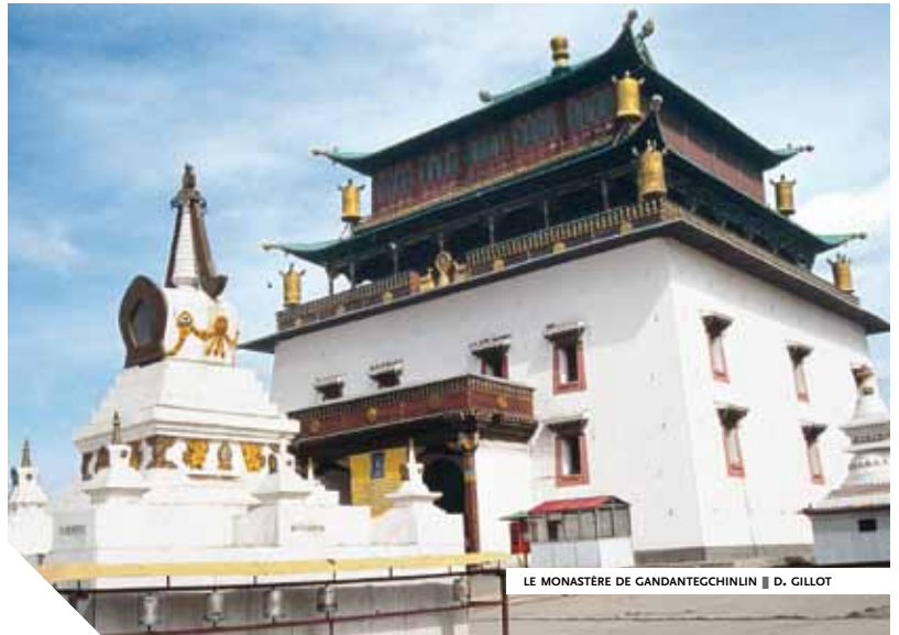
LE MONASTÈRE DE GANDANTEGCHINLIN ■ D. GILLOT

les Mandchous ont adoptée. Les nomades se voient liés à la terre par la délimitation de leurs zones de pâturages. En dépit de restrictions visant à couper les Mongols d'influences extérieures jugées pernicieuses par leurs maîtres, des marchands étrangers puis des colons chinois s'imposent et contribuent, par certaines de leurs pratiques, à ruiner progressivement le pays. La Mongolie est, au début du xx siècle, arriérée, appauvrie, en régression démographique et la religion a longtemps, et de manière exagérée, été tenue pour responsable de ces maux. Conscients du malaise croissant, des princes, quelques religieux et des représentants du peuple tentent de s'unir pour réagir. À la proclamation de la République en Chine, en 1911, les princes khalkhas se déclarent indépendants. Trois entités vont alors se dessiner. La Mongolie dite "intérieure" (à cette expression chinoise qu'ils jugent insultante, les Mongols préfèrent "Mongolie méridionale") reste intégrée au monde chinois, acquérant le statut de région autonome en 1947 avec l'intégration des zones mongoles de Mandchourie. Il en est de même pour le Xinjiang qui avait été créé en 1884. En revanche, la Mongolie extérieure se dirige vers l'indépendance, soutenue par la Russie puis par l'Union soviétique et devient, en 1924, la République populaire de Mongolie.