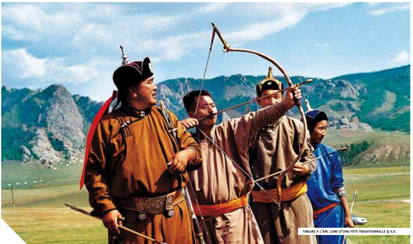
TIREURS À L'ARC LORS D'UNE FÊTE TRADITIONNELLE ■ A.V.