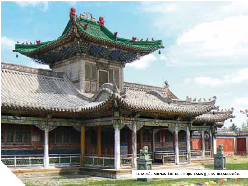
LE MUSÉE-MONASTÈRE DE CHOJIN-LAMA

et le pouvoir spirituel tibétain. Rappelons que le titre de dalaï-lama, aujourd'hui si connu, est d'origine mongole et fut conféré par Altan Khan au troisième successeur de Tsongkhapa, le fondateur des Gelugpa. L'adhésion massive des Mongols orientaux au bouddhisme devait constituer un ferment d'identité nationale important ainsi qu'un incontestable apport culturel et artistique. On ne peut toutefois nier qu'avec le temps, l'église bouddhique, devenue puissance économique et politique, fut aussi par moments facteur d'oppression.