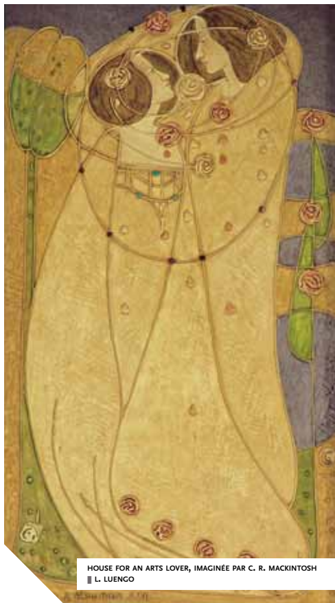
HOUSE FOR AN ARTS LOVER, IMAGINÉE PAR C. R. MACKINTOSH

Les créations de l'Art nouveau européen – tout particulièrement celles du Wiener Werkstätte (Autriche) en parallèle de l'École de Glasgow ainsi que de l'œuvre des époux Charles Rennie (1868-1928) et Margaret (1864-1933) Mackintosh – ne peuvent se concevoir sans l'impulsion salutaire que leur insuffla le mouvement Arts & Crafts (Angleterre), lui-même inscrit dans un mouvement amorcé antérieurement par les peintres préraphaélites et plus particulièrement par le foisonnant William Morris.