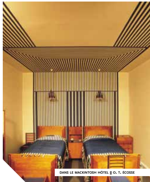
DANS LE MACKINTOSH HÔTEL ■ O. T. ÉCOSSE

Mais à y regarder de plus près, la culture néogothique de Mackintosh est plus "féodale et écossaise" qu'européenne et elle se nourrit de l'apport celtique. Ses techniques de construction (comme celles de ses confrères de Glasgow) englobe la construction navale, apprise elle aussi à la Glasgow School of Art. Au tournant du nouveau siècle, Glasgow, "seconde ville de l'Empire", est l'une des capitales de la construction navale et s'est de plus enrichie grâce à l'exploitation des mines de charbon et de fer. La ville connaît à cet instant l'apogée de sa puissance économique. Le projet d'un "bâtiment public pouvant recevoir 1 000 personnes" en 1891 permet à C. R. Mackintosh de gagner une bourse d'étude avec laquelle il voyage en Italie, avant de regagner Glasgow via Paris, Bruxelles, Anvers et Londres. Encore étudiant à la School of Art, il rencontre James Herbert MacNair (1868-1955), lui aussi apprenti chez Honeyman & Keppie. Les deux amis font la connaissance de deux autres élèves de l'école, les sœurs Margaret et Frances MacDonald. Cette rencontre donne naissance à "The Four" ou en français "Les Quatre de Glasgow".