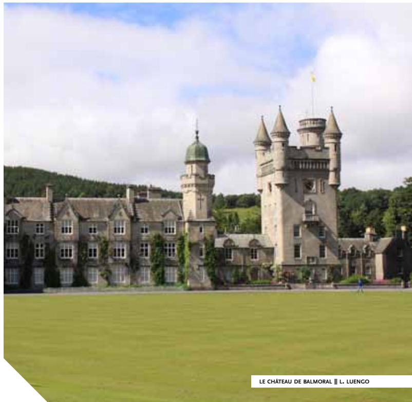
LE CHÂTEAU DE BALMORAL ■ L. LUENGO

“ Charles et Margaret savent inventer une ambiance moderne dans laquelle la lumière entre à flot ”