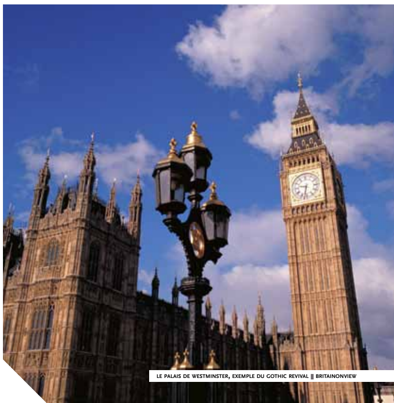
LE PALAIS DE WESTMINSTER, EXEMPLE DU GOTHIC REVIVAL

Passés en France d'une élite nostalgique, volontiers réactionnaire et revancharde, à la bourgeoisie montante aussi prospère que durable, les styles troubadour, néogothique, Viollet-le Duc, ou Henri II, selon l'humeur du jour et les progrès de l'archéologie, hérissent la campagne, de "châteaux forts" flambant neuf, orgueils du "chevalier d'industrie", qui parfois finance aussi la cathédrale en miniature, servant de paroissiale au cœur du village. En ville, ce sont les hôtels particuliers ou petits pavillons de province agrémentés de tourelles en poivrière, que l'on décore au pochoir comme de très saintes chapelles et que l'on meuble de même, les capitons boutonnés de satin rouge en plus.