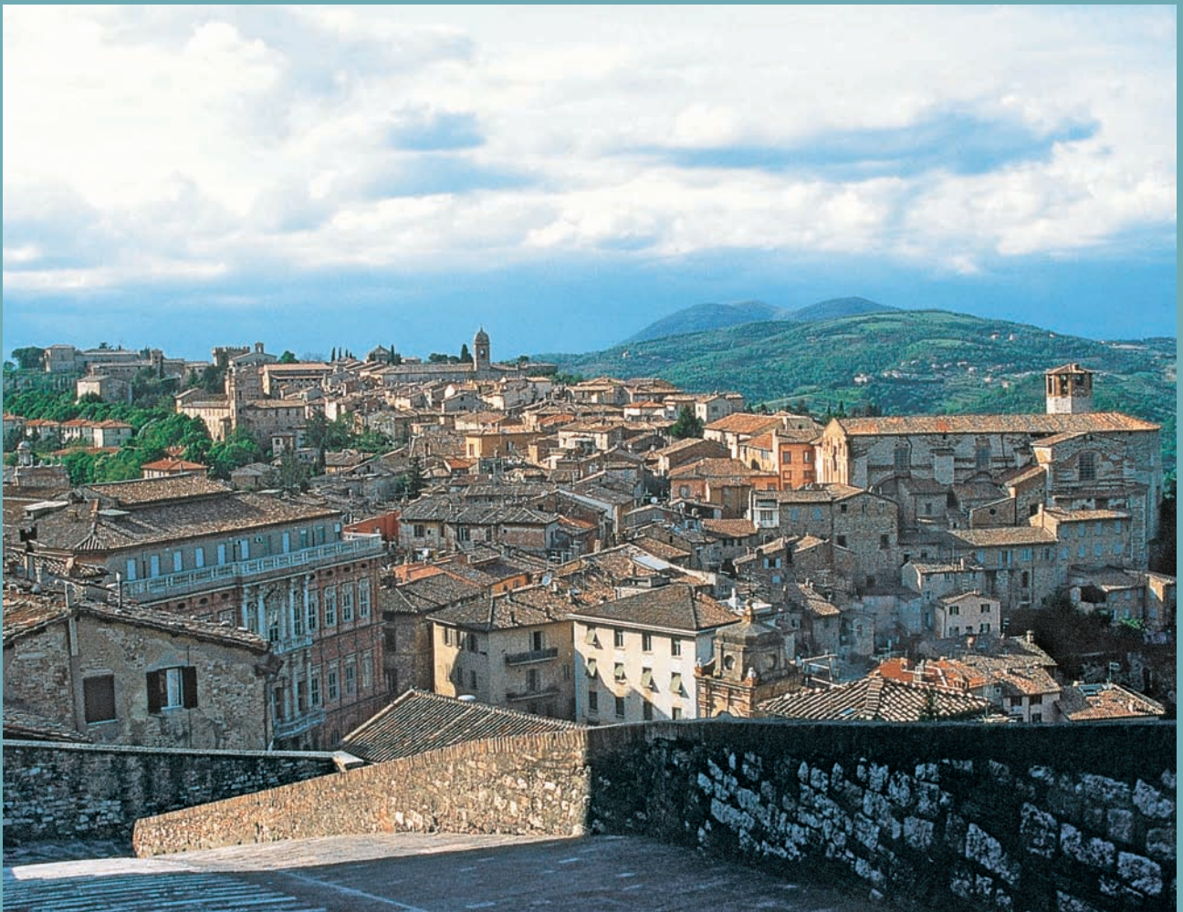
SUPERBE VILLAGE DE OMBRIE, PÉROUSE - [ S. MALLEIN ]

[ PAR CHRISTIAN LOUBET, PROFESSEUR EN HISTOIRE DES ARTS ET DES MENTALITÉS (INSTITUT EUROPÉEN D'ART, NICE) ]