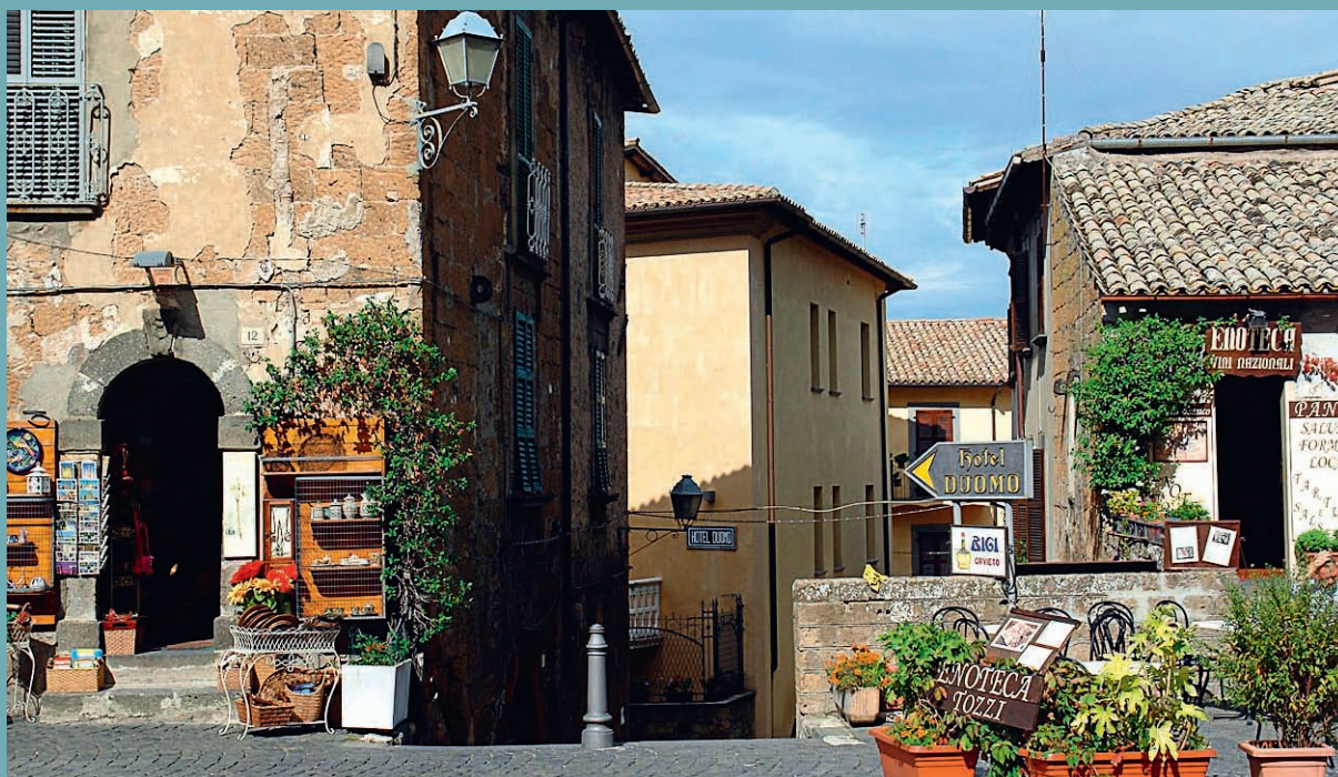
DANS LES RUES D'ORVIETO

Signorelli évolua d'un "humanisme" tempéré vers un réalisme pathétique et violent. Brillant et cultivé, il ne réussit pas toujours à affirmer sa personnalité dans la synthèse des influences. Vasari, qui l'a connu, évoque son " invention originale et capricieuse " ainsi que le caractère terrible de sa représentation des fins dernières qui annonce Michel-Ange. Plus qu'un simple illustrateur, Luca demeure un peintre de transition vers le maniérisme, la terribilità limitée par un goût de la venustà , l'inquiétude limitée par la confiance en l'humain affichée dans le corps. Or le corps humain, ambivalent, peut aussi exprimer le mal. La sensualité peut causer le péché et la mort. Si Luca a su magnifier son exhibition, il exprime justement, dans les fresques d'Orvieto, le risque de la transgression hors-limites, problématique très moderne au temps de la Renaissance comme de nos jours.