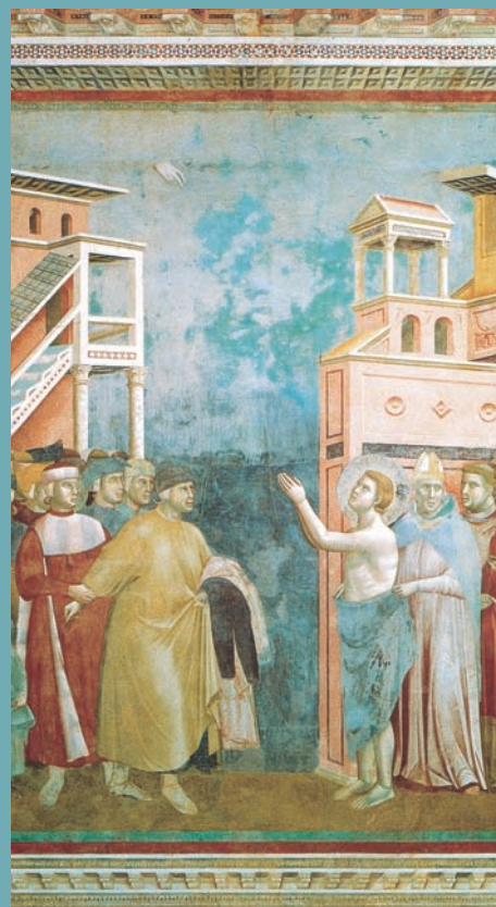
LE DÉPOUILLEMENT DE SAINT-FRANÇOIS DE GIOTTO

Regardons par exemple la séquence du Dépouillement de saint François :