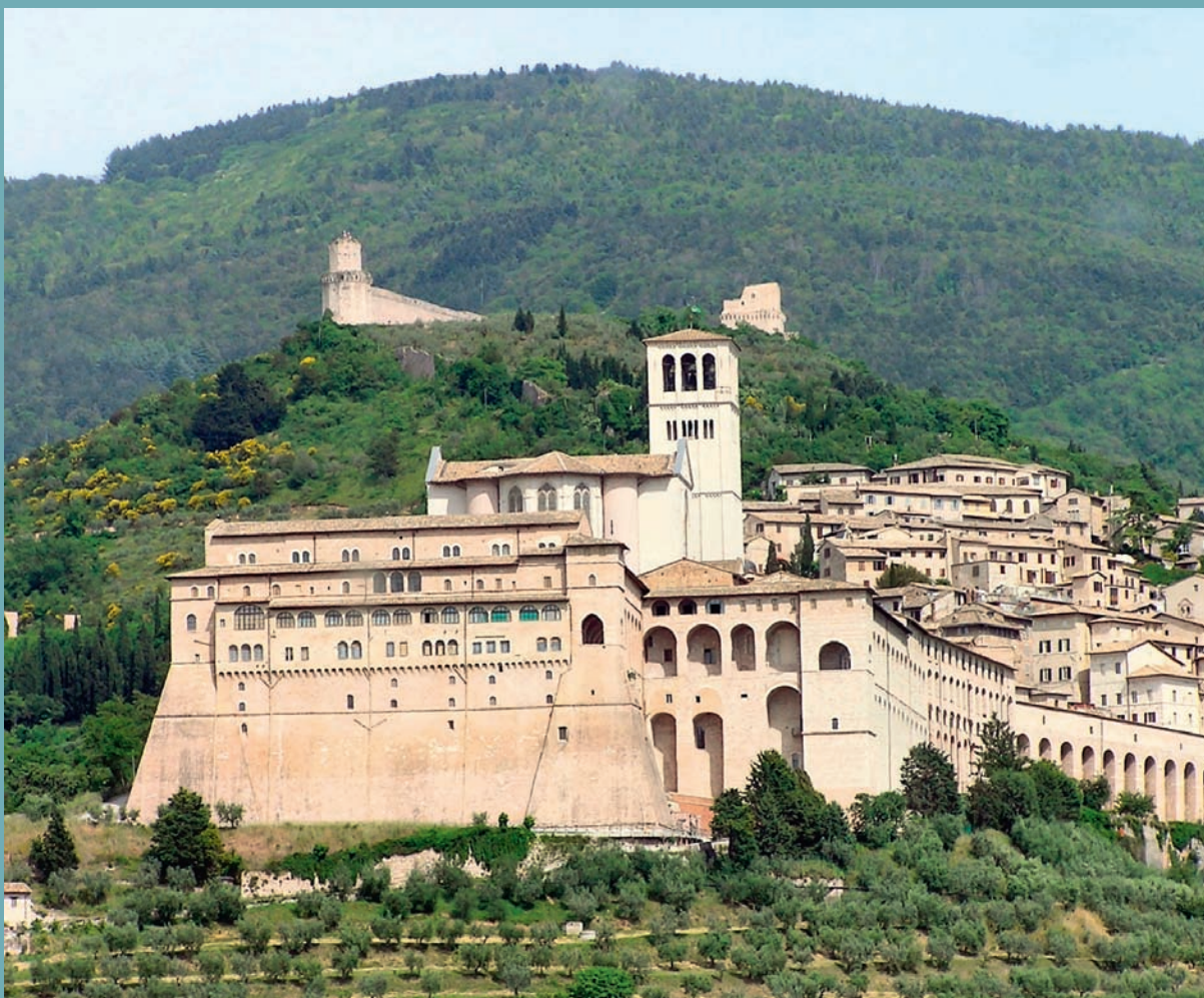
VUE SUR LES BASILIQUES ET LE COUVENT D'ASSISE

Chacun doit agir selon sa vocation pour contribuer au bien commun. L'action, la recherche et l'expression vont dans le sens de l'exploration de la nature. C'est en affrontant le monde réel que chacun s'affirme, et non dans l'idéalisme de la culture