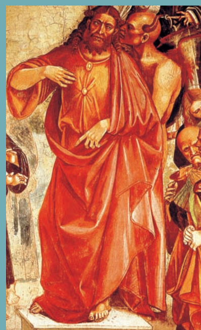
DÉTAIL DE L'ANTÉCHRIST DE SIGNORELLI

Sur la paroi gauche de la première travée, Signorelli met en scène la fin des temps. Dans un paysage ouvert et désolé, un sanctuaire est investi par des