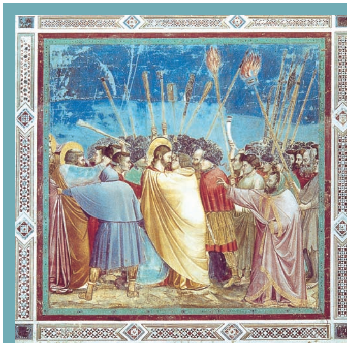
LE BAISER DE JUDAS DE GIOTTO

À la chapelle Scrovegni de Padoue (1305) la narration se concentre dans un groupe de figures au centre de l'image. Par exemple, dans Le Baiser de Judas , trois zones chromatiques portées par des figures ovoïdes se partagent l'espace. Des faciès crispés sont tendus autour des protagonistes. Jésus est "englobé", inscrit dans l'espace imposé par l'autre (le manteau refermé) mais par son regard "supérieur", il démontre sa prescience. C'est Judas qui est déjà piégé. Les formes sont traversées de forces mises en jeu par les regards, les gestes des bras, les piques tendues.