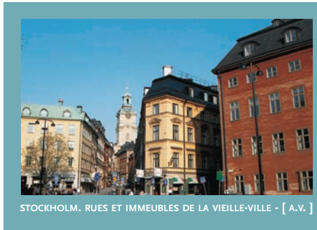
STOCKHOLM. RUES ET IMMEUBLES DE LA VIEILLE-VILLE - [ A.V. ]

Après avoir d'abord tenté de créer leur propre union de défense, les pays nordiques furent contraints de choisir une option face à la bipolarisation du monde, à la fin des années 40. Trois d'entre eux, le Danemark, l'Islande et la Norvège choisirent d'adhérer à l'OTAN, tandis que la Suède et la Finlande, pour des raisons différentes toutefois, optèrent pour la neutralité.