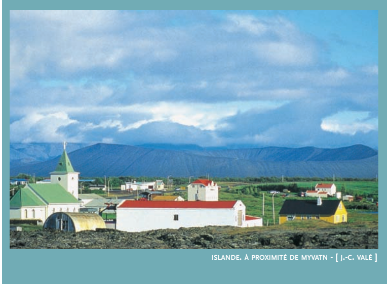
ISLANDE. À PROXIMITÉ DE MYVATN - [ J.-C. VALÉ ]

à rapprocher les législations des pays membres, ainsi que les populations. Fait important et symptomatique des limites que cet organisme s'était imposées dès le départ, les questions de politique étrangère et de défense étaient officiellement exclues des discussions. La nouvelle donne consécutive à l'effondrement de l'Union soviétique a modifié la situation dans ce domaine.