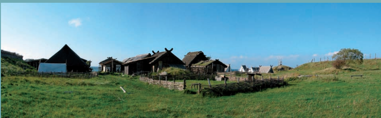
RECONSTITUTION D'UN VILLAGE VIKING MÉDIÉVAL EN SUÈDE

Contrairement à une certaine imagerie d'Épinal répandue à l'étranger, qui ne voit dans les Vikings que des barbares incultes, l'époque viking doit être considérée comme une des périodes les plus brillantes de l'histoire de ces pays. Il faut dire que c'est sur elle que s'est greffée l'un des fleurons de la littérature médiévale : les fameuses sagas islandaises et les deux Eddas, monuments littéraires qui datent essentiellement du xiii e siècle et constituent le soubassement commun à la culture de l'ensemble de la Scandinavie.