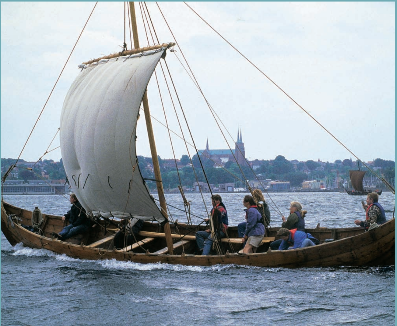
[ À BORD D'UN NAVIRE VIKING SUR LE ROSKILDE FJORD ]

[ PAR MARC AUCHET - PROFESSEUR AU DÉPARTEMENT D'ÉTUDES NORDIQUES DE L'UNIVERSITÉ PARIS-SORBONNE (PARIS IV) ]