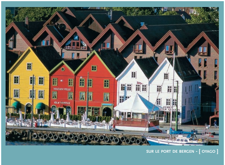
SUR LE PORT DE BERGEN - [ OYAGO ]

Il a fallu par ailleurs attendre 1973 pour que le Danemark adhère à la CEE, puis 1995 pour que la Suède et la Finlande se décident à leur tour de faire le pas 6 . Seule la Finlande a toutefois accepté l'euro. L'euro-scepticisme reste fort dans l'opinion