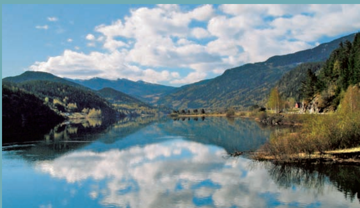
LA VALLÉE DE HALLINGDALEN EN NORVÈGE