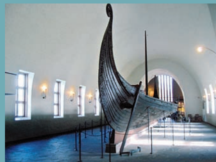
DRAKKAR AU MUSÉE DES BATEAUX VIKINGS D'OSLO

Tous les Vikings parlaient la même langue et ils s'associaient volontiers pour organiser leurs opérations lucratives ou guerrières. Ce sont toutefois des Vikings norvégiens qui colonisèrent l'Islande, à partir de 874. En 930, celle-ci créa son premier parlement et se dota d'institutions spécifiques, mais son indépendance cessa en