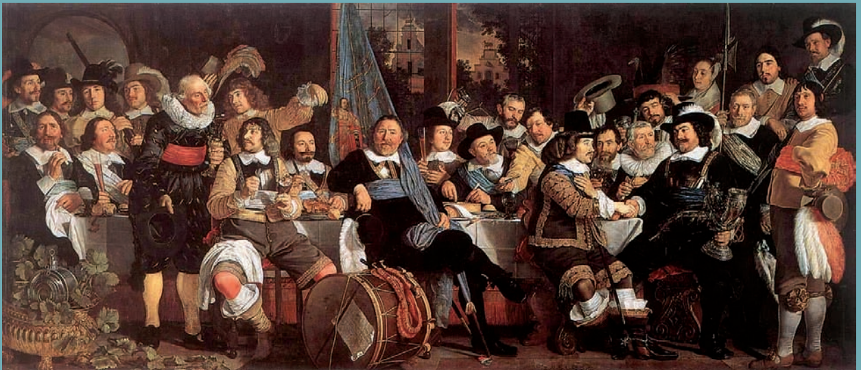
TRAITÉ DE WESTPHALIE : CÉLÉBRATION DE LA PAIX DE MÜNSTER PAR B. VAN DER HELST, 1648.

Leurs fils se lancèrent dès 1563 dans des guerres fratricides et particulièrement dévastatrices, qui se poursuivirent pendant près d'un siècle et demi. L'enjeu de ces affrontements était double : il s'agissait, d'une part, de l'hégémonie dans la Baltique, et, d'autre part, de la possession de plusieurs provinces au sud de la Suède. Cette dernière arriva petit à petit à s'imposer en tant que grande puissance, se lançant dans des guerres de conquête, annexant l'Estonie en 1595, la côte du sud-est du golfe de Finlande en 1617 et de la Livonie en 1621. En 1630, le roi Gustave Adolphe (1611-1632) entraîna la Suède dans la guerre de Trente ans, qui se solda pour son pays par l'acquisition de territoires au Nord de l'Allemagne, lors du traité de Westphalie en 1648. Les Danois, qui étaient aussi intervenus dans les guerres de Religion qui ont ravagé l'Allemagne à cette période, n'eurent pas du tout le même succès. Considérablement affaiblis, ils perdirent plusieurs territoires le long de la frontière norvégienne (1645), puis les provinces de Scanie, Blekinge et Bohuslän (1648), qu'ils avaient possédées jusque-là de l'autre côté du Sund. C'est la période que les historiens suédois appellent "l'ère de grandeur". Celle-ci se prolongea jusqu'au début du XVIII e siècle. Sorti vaincu de ses guerres contre les Russes, Charles XII précipita son pays dans la débâcle. À sa mort, en