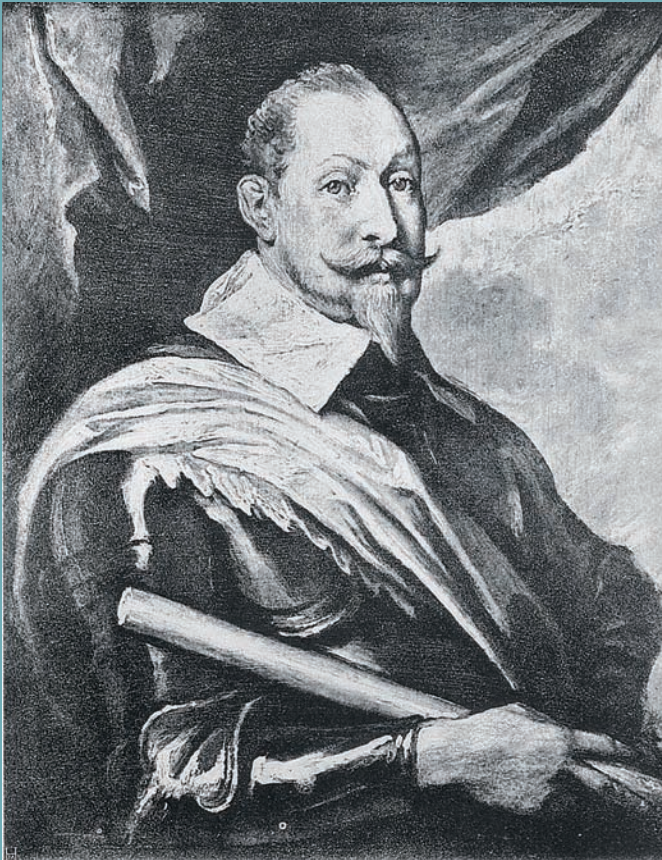
PORTRAIT DU ROI GUSTAVE II ADOLPHE

Au XVIII e siècle, un certain équilibre s'établit autour de la Baltique. Ni le Danemark ni la Suède n'avait réussi à imposer leur suprématie. À l'issue de la grande guerre du Nord (1700-1720), les deux pays s'entendirent sur un tracé de frontières quasi définitif. Le traité signé en 1720 marque la fin des affrontements.