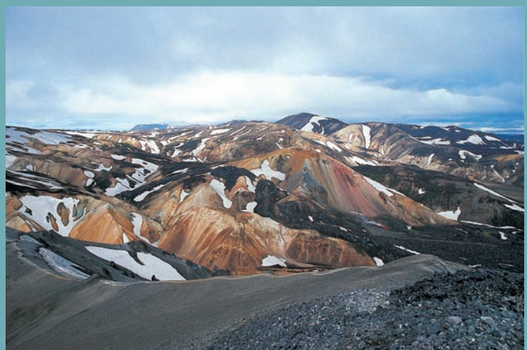
PAYSAGE DU LANDMANNALAUGAR EN ISLANDE - [ J.-B. GIOVANNANGELI ]

La grande diversité que nous venons de signaler ne doit toutefois pas masquer le fait que l’ensemble nordique se distingue tout autant par une grande unité. Qu’il s’agisse du mode de vie, du respect de l’individu, des droits de la femme, de l’égalitarisme social, de l’intérêt pour les questions d’environnement, du pacifisme ou d’un bon nombre d’autres domaines, il est indéniable que les cinq pays en question ont des valeurs largement communes. Quant à leur modèle de société, qui a tellement attiré l’attention à l’étranger ces dernières années, il repose lui aussi sur des bases largement identiques. Le cadre restreint de cette présentation ne nous permet pas d’explorer tous ces aspects. Nous nous arrêterons sur l’un d’entre eux, qui explique en bonne partie pourquoi les pays nordiques se sentent solidaires tout en restant parfaitement conscients de leurs spécificités respectives : le réseau dense de liens tissés par l’histoire.