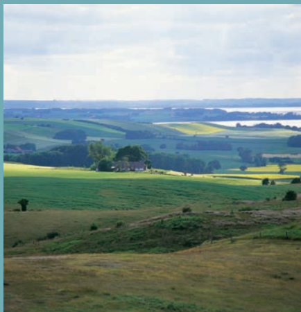
PAYSAGE DU EAST JUTLAND AU DANEMARK - [ O.T. DANEMARK ]

La plupart du temps, les étrangers ne font aucune distinction entre “pays nordiques” et “pays scandinaves”, et ils désignent abusivement sous le nom de “Scandinavie” les cinq pays qui nous intéressent ici, le Danemark, la Finlande, l’Islande, la Norvège et la Suède 1 , auxquels ils