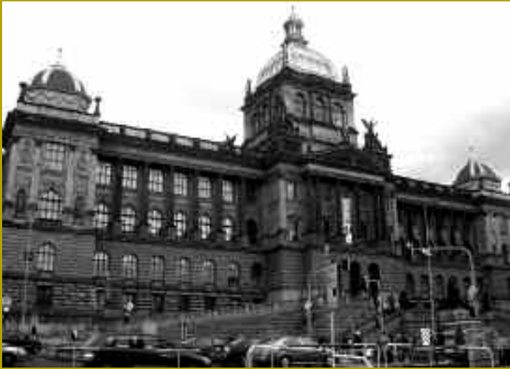
LE MUSÉE NATIONAL - [ L. CAMILLERI ]

Des institutions muséales moins classiques, comme le monumental Musée technique (fondé en 1908), ou de petites structures aux sujets très pointus (musée des Transports en commun, musée des Pharmacies historiques, musée du service des Eaux, musée du Débarcadère installé dans l'ancien octroi du quartier Podskálí, et retraçant l'histoire de la navigation à vapeur sur la Vltava...) témoignent du goût invétéré des Tchèques pour l'artisanat et le génie technique en général, dont on trouvera de très plaisants échos dans les romans de Bohumil Hrabal. Cependant, certaines institutions dont la conception remonte au XIX e siècle peinent à trouver un second souffle. C'est le cas du musée de la ville de Prague, logé dans un intéressant bâtiment historiciste (1896-1898), et abritant des collections parfois