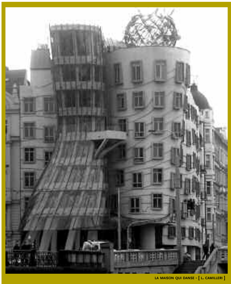
LA MAISON QUI DANSE - [ L. CAMILLERI ]

d'innombrables immeubles et maisons de rapport de style éclectique. Ce renouveau se retrouve dans la coupole à verrière du Musée national qui domine la place Venceslas, dans les chefs-d'œuvre de l'Art nouveau comme la Maison municipale, la Gare principale... et dans l'immeuble aux tendances déjà Art déco du passage Koruna sur la place Venceslas.