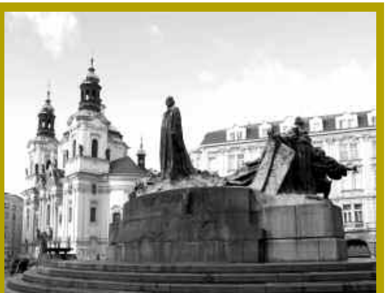
LE MEMORIAL DE JAN HUS À CÔTÉ DE L'ÉGLISE SAINT-NICOLAS SUR LA PLACE DE LA VIEILLE-VILLE - [ O.T. REPUBLIQUE TCHÈQUE ]

La tour de son observatoire astronomique domine l'ancien collège jésuite du Klementinum, le plus vaste complexe baroque de Prague. Elle est aujourd'hui la Bibliothèque nationale. Le renouveau architectural du "tournant" des xix e et xx e siècles saura encore en tirer partie : pignons d'angle, tourelles néorenaissance ornent