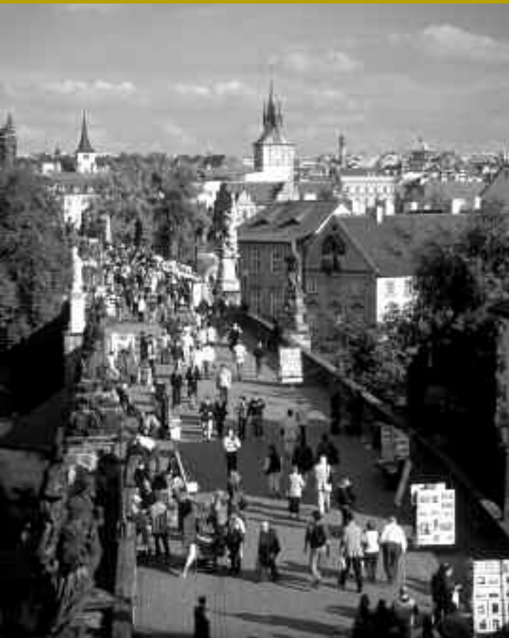
BALADE SUR LE PONT CHARLES - [ O.T. RÉPUBLIQUE TCHÈQUE ]

Des institutions muséales moins classiques, comme le monumental Musée technique (fondé en 1908), ou de petites structures aux sujets très pointus (musée des Transports en commun, musée des Pharmacies historiques, musée du service des Eaux, musée du Débarcadère installé dans l'ancien octroi du quartier Podskálí, et retraçant l'histoire de la navigation à vapeur sur la Vltava...) témoignent du goût invétéré des Tchèques pour l'artisanat et le génie technique en général, dont on trouvera de très plaisants échos dans les romans de Bohumil Hrabal. Cependant, certaines institutions dont la conception remonte au XIX e siècle peinent à trouver un second souffle. C'est le cas du musée de la ville de Prague, logé dans un intéressant bâtiment historiciste (1896-1898), et abritant des collections parfois