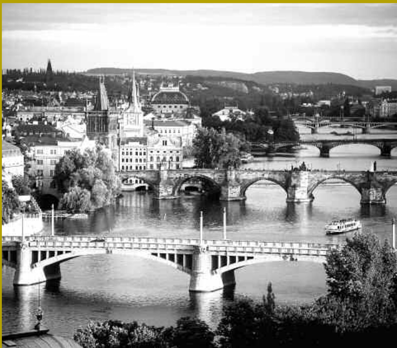
VUE SUR LES PONTS DE PRAGUE

PRAGUE FAIT PARTIE DES VILLES QUI ONT TOUR À TOUR MIS À PROFIT ET CHER PAYÉ LEUR SITUATION DE CARREFOUR. ENTRE EST ET OUEST, ENTRE RUSSIE ET ALLEMAGNE, ENTRE MONDES GERMANIQUE ET SLAVE. LE PATRIMOINE CULTUREL PRAGUOIS EN FAIT L'UNE DES CAPITALES LES PLUS PRESTIGIEUSES D'EUROPE. FOYER TARDIF DU GOTHIQUE, AU XIV e SIÈCLE ; VILLE MAJEURE DU MANIÉRISME À LA FIN DU XVI e ; JALON IMPORTANT DANS LA CONSTELLATION DES VILLES BAROQUES D'EUROPE CENTRALE AUX XVII e ET XVIII e ; ENFIN CAPITALE D'UN PAYS RAPIDEMENT INDUSTRIALISÉ DÈS LE XIX e , ET SIÈGE D'UNE BOURGEOISIE ENTREPRENANTE ET ATTIRÉE PAR LA MODERNITÉ. DURANT L'ENTRE-DEUX-GUERRES, AVANT D'ÊTRE ENTRAÎNÉE DANS LA SPIRALE DES TOTALITARISMES, PRAGUE S'EST RÉVÉE COMME UNE CITÉ ÉMANCIPÉE, UNE "CAPITALE SECRÈTE DES AVANT-GARDES". UN STATUT QUE, DEPUIS LA CHUTE DU COMMUNISME EN 1989, SON ÉLITE CULTURELLE TENTE DE LUI RESTITUER.