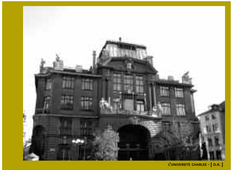
L'UNIVERSITÉ CHARLES

“ Comparée aux autres capitales européennes, Prague naît relativement tard. ”