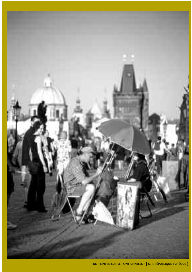
UN PEINTRE SUR LE PONT CHARLES - [ O.T. RÉPUBLIQUE TCHÈQUE ]

(collections tchèques du XIX e siècle) et la Maison “à l’anneau d’or” – U zlatého prstenu – (collections tchèques du XX e siècle), et dédie deux espaces à de remarquables expositions temporaires (dans la Maison gothique “à la cloche de pierre” – U kamenného zvonu – et dans le bâtiment de la Bibliothèque municipale).