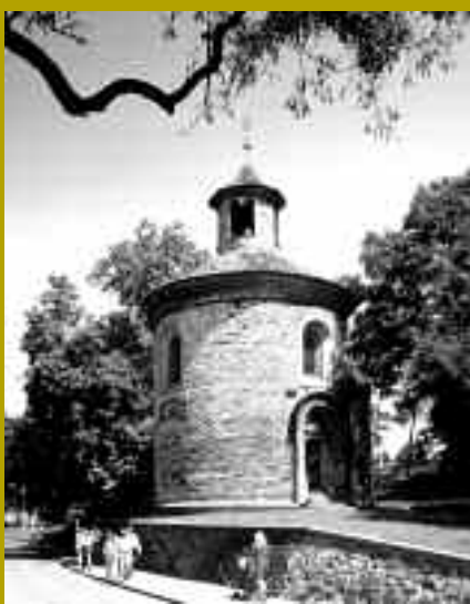
LA ROTONDE SAINT-MARTIN À VYŠEHRAD - [ O.T. RÉPUBLIQUE TCHÈQUE ]

Après la bataille de la Montagne-Blanche (1620), le parti catholique mené par la maison d'Autriche, triomphe des protestants. Le catholicisme redevient l'unique