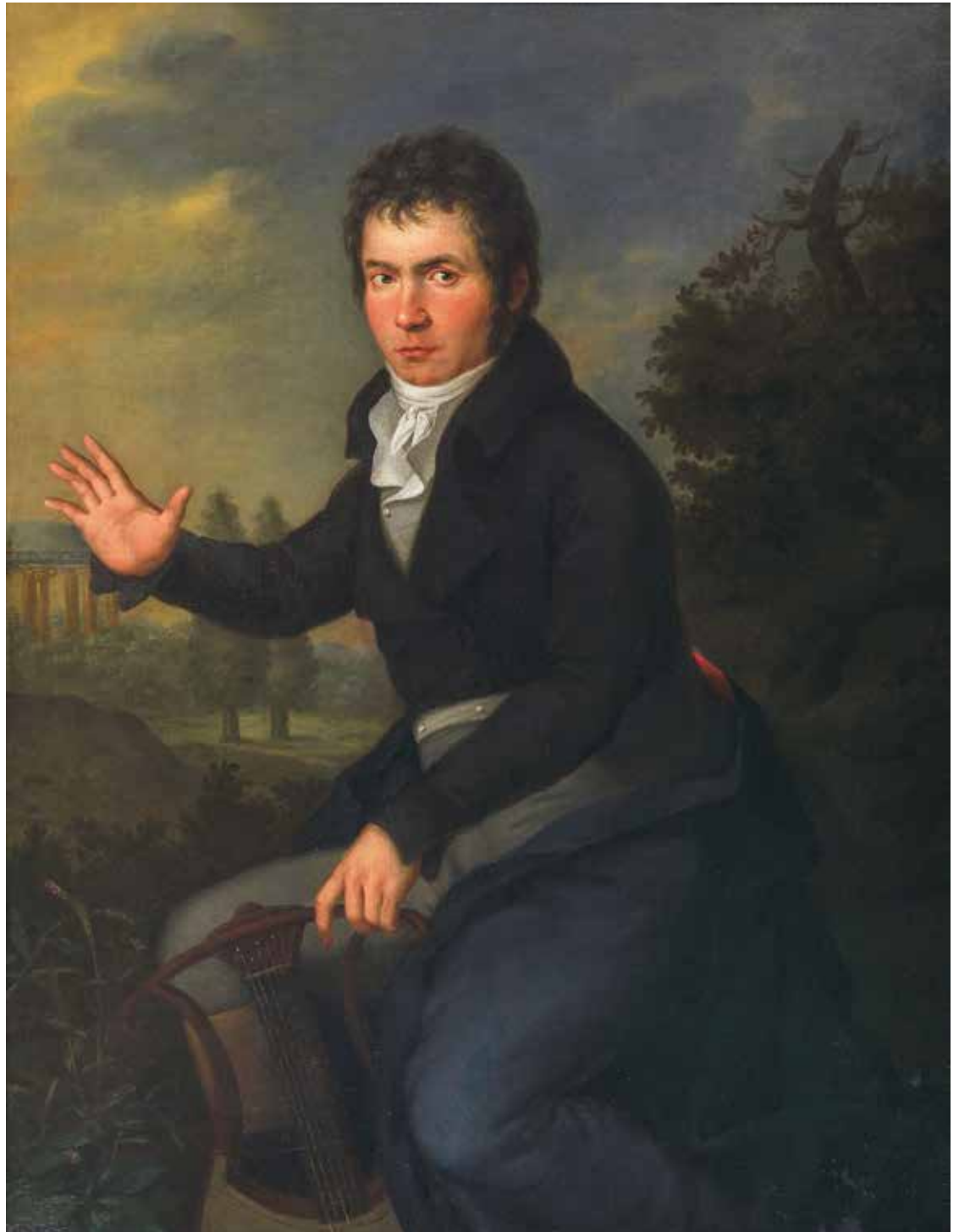
Ludwig Van Beethoven (1804-1805), tableau de Willibrord Joseph Mähler au musée Beethoven 📍 Wien Museum