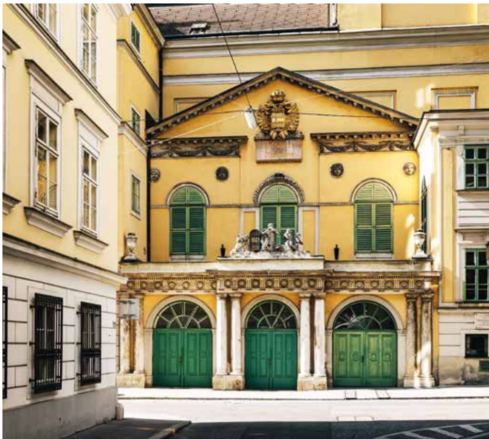
Le Theater an der Wien

Opéra politique, plaidoyer pour la liberté contre l'arbitraire, glorification de l'amour conjugal, [ Fidelio ] est une œuvre éminemment beethovénienne.