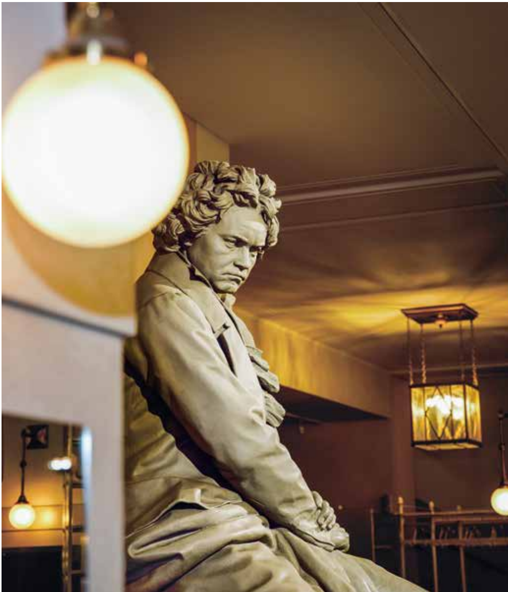
Buste de Beethoven au Wiener Konzerthaus