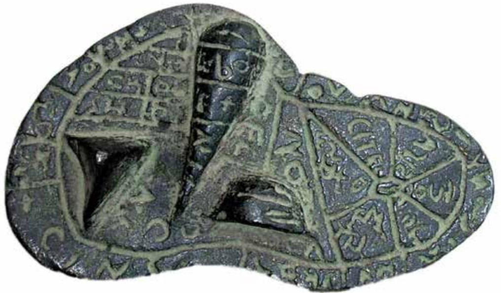
Le foie de Plaisance, objet étrusque qui aurait été utilisé pour les pratiques divinatoires ■ Piacenza, Museo Civico

Mais la critique des Romains portait plus globalement sur les manières de vivre des Étrusques. Les Grecs, d'abord, leur avaient reproché leurs jeux – scéniques ou athlétiques – donnés lors des obsèques d'un Grand, et non dans le cadre de la vie civile de la cité. Mais ces Romains les vilipendaient surtout pour leur manie du banquet. Et ils se gaussaient volontiers de l' oboesus etruscus , l'Étrusque obèse. De fait, ces Étrusques aimaient à se faire représenter dans la pose du "banqueteur" couché sur son lit de table, et de nombreuses fresques montrent effectivement des banquets, qu'il s'agisse d'un repas funèbre, ou, assez tard, de l'image de la vie bienheureuse du mort, dans