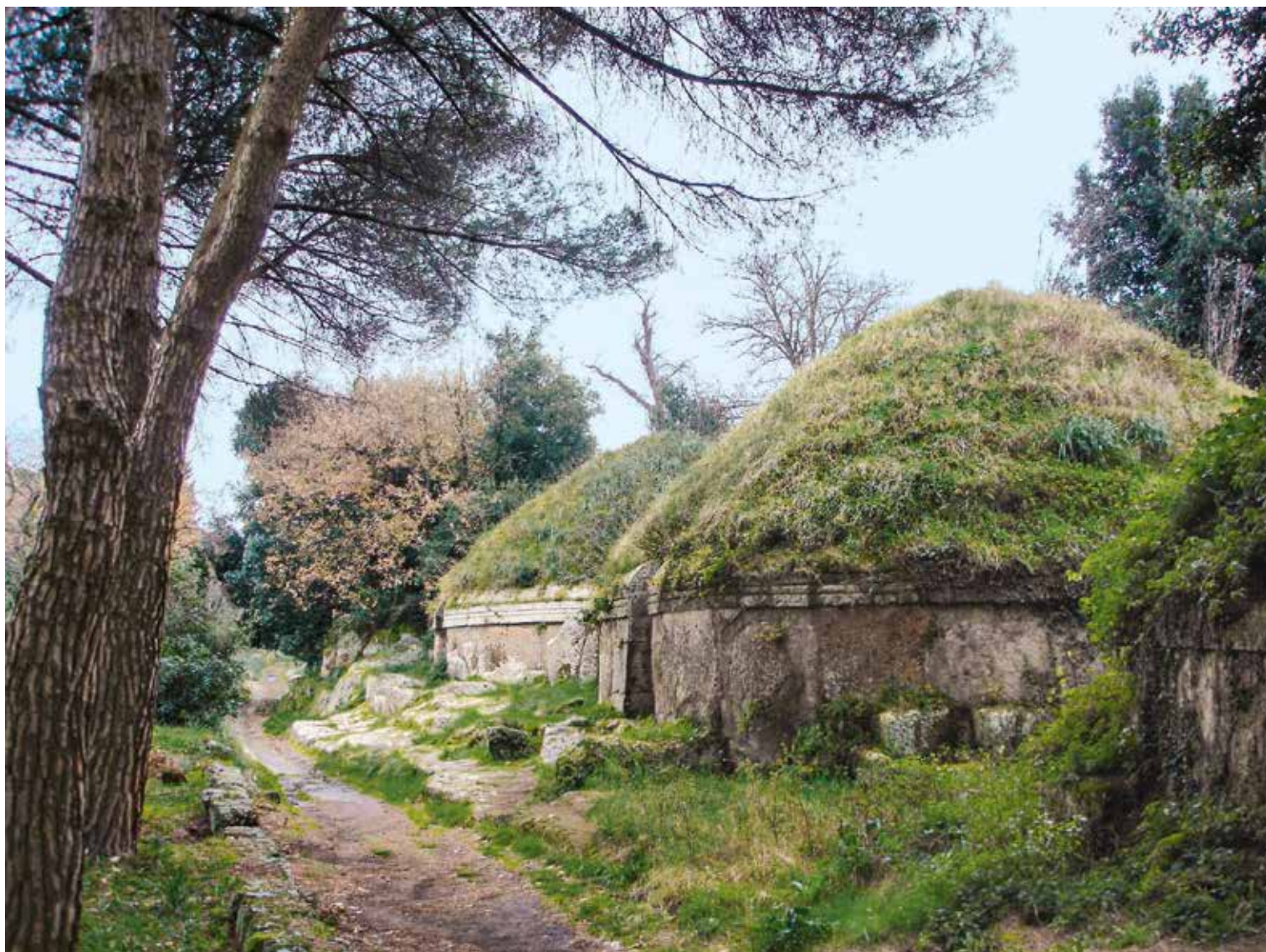
Tumulus à la nécropole de Cerveteri (ou Caere) ■ A. Roux

Paradoxe ! Si cette écriture se lit aisément (c'est du grec), la langue qu'elle dénote nous échappe largement. Nous sont transparentes les formules récurrentes, exprimant, par exemple, l'âge du défunt, sur une inscription funéraire : lupu avils XXII signifie ainsi "est mort à 22 ans", et nous savons que père se dit apa , mais les textes "longs" déroutent jusqu'aux spécialistes. On n'en dénombre en fait que trois : le cippe de Pérouse, la tuile de Capoue et le livre de lin, déjà évoqué, de Zagreb. Le premier est une borne, séparant, semble-t-il, deux terrains, la deuxième porte le texte, assez obscur, d'un calendrier religieux, le troisième, évidemment très incomplet, est