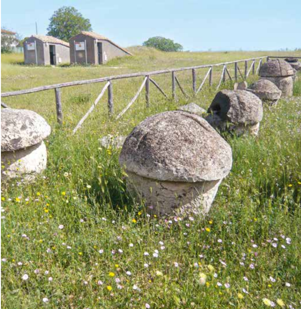
La nécropole de Tarquinia

Les Étrusques écrivait beaucoup : nous avons gardé 10 000 de leurs inscriptions, du début du VI e siècle av. J.-C. au I er , date à laquelle leur langue disparaît.