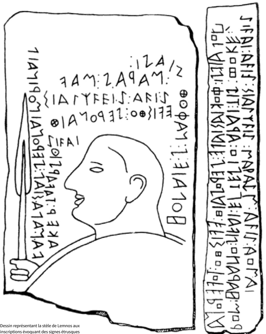
Dessin représentant la stèle de Lemnos aux inscriptions évoquant des signes étrusques Wikimedia Commons

Mais qui étaient donc ces Étrusques, que les Grecs, un temps, avaient tenus pour de redoutables pirates, capables de torturer leurs prisonniers en les liant à des cadavres ? Et que les Romains, faute de bien les connaître, se plaisaient tellement à détester ? Ils leurs reprochaient leur truphê , c'est-à-dire leur mollesse, leur goût du luxe, leur manie des banquets, mais voyaient aussi en eux les “plus religieux des hommes”. Car ces Tusci – ou Lydi ou Tyrhheni – passaient en effet pour les maîtres de la divination, c'est-à-dire des relations avec les dieux dont ils savaient mieux que personne reconnaître les avertissements. C'étaient certes des vaincus, des gens qui avaient occupé la Ville un siècle durant et que les Romains avaient chassés, disait l'histoire officielle, en 509 av. J.-C., pour instaurer leur République, cette libera civitas qui devait durer plus de quatre siècles. Mais leur “mystère” demeurait, et, sous Auguste, il ne manquait pas de savants, comme le Grec de Rome Denys d'Halicarnasse, pour souligner leur originalité : “Cette nation est indigène”, dit-il dans ses Antiquités Romaines , très ancienne, “sans la moindre parenté avec quelque autre race, qu'il s'agisse de la langue ou du genre de vie.” Pour les Romains, donc, c'était un peuple bien mystérieux, dont ils ignoraient jusqu'à l'origine.