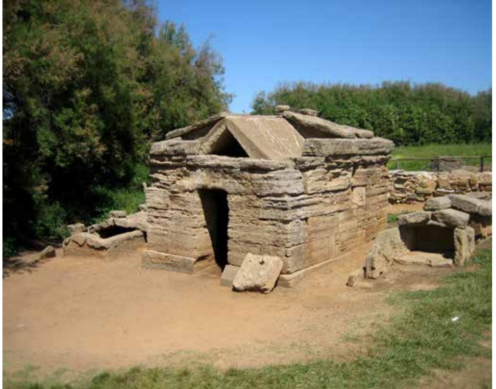
Vestiges d'une tombe étrusque à Populonia

La riche culture étrusque se serait développée sous l'effet de plusieurs causes conjuguées, liées sans doute, à différents moments, à des transferts ponctuels de population.