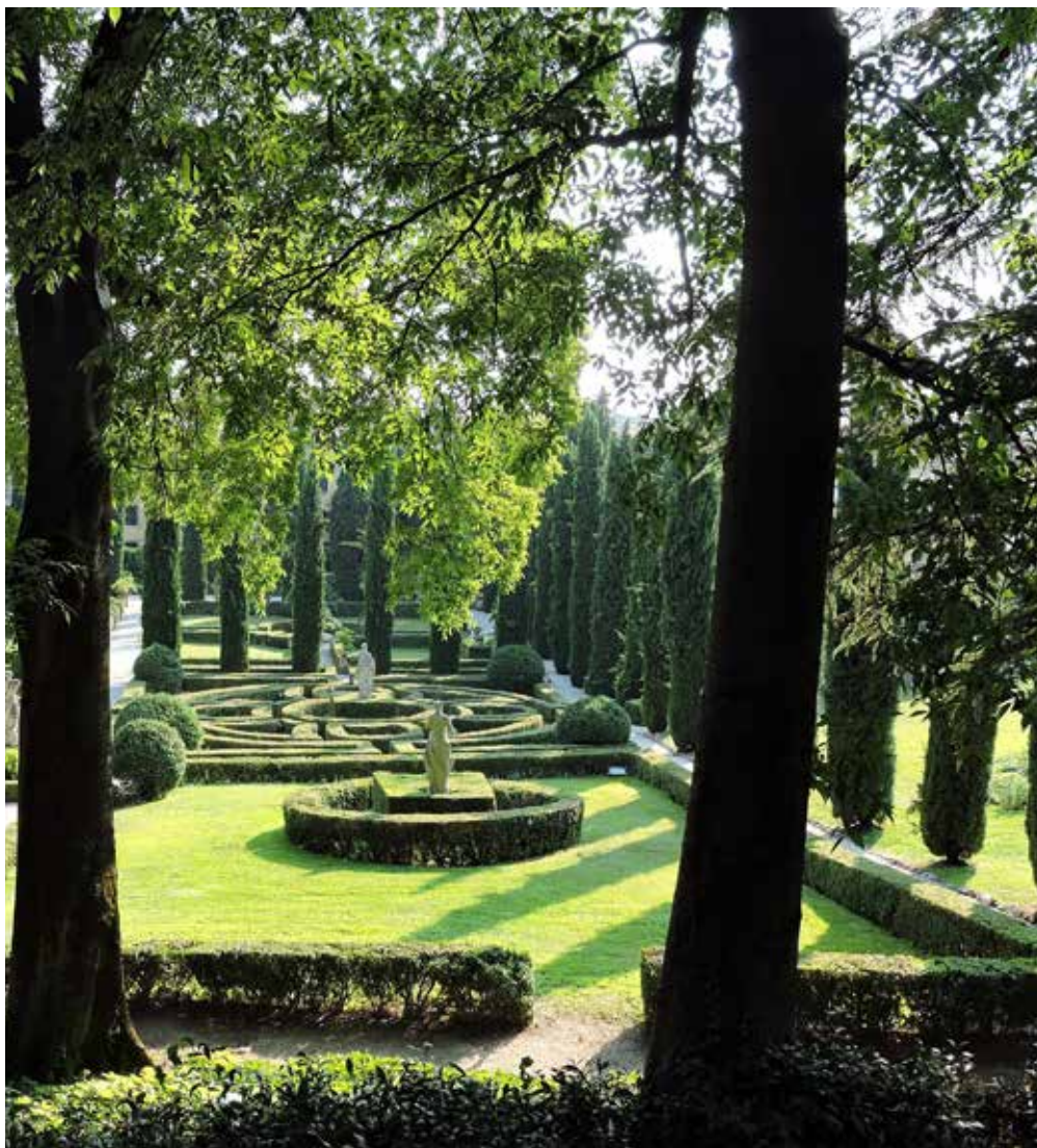
Le jardin Giusti à Vérone

Les traités d'agronomie nous renseignent sur la technique de l'art topiaire, et surtout la taille directe. Ainsi, au livre VI de son De Re Rustica , l'agronome latin Columelle (I er siècle ap. J.-C.) décrit la falx , une sorte de serpe servant à tailler les topiaires, et il précise dans son De Arboribus qu'après avoir coupé la branche à la falx , la partie restante sur le végétal est ensuite lissée aux ciseaux. Pline évoque lui aussi les “massifs de buis aux mille formes et [les] petits arbrisseaux que les ciseaux empêchent de grandir.” Des siècles plus tard, les jardiniers vont utiliser le cordeau, le fil à plomb et le niveau à bulle pour réaliser les parterres et les topiaires. En effet, conduire la sève d'un végétal pour lui imposer une structure requiert certains outils, notamment le gabarit, un triangle – de bois d'abord, puis de métal – sur lequel est fixé un bras diagonal mobile qui permet de tourner autour de l'arbuste de façon régulière. Il en résulte des