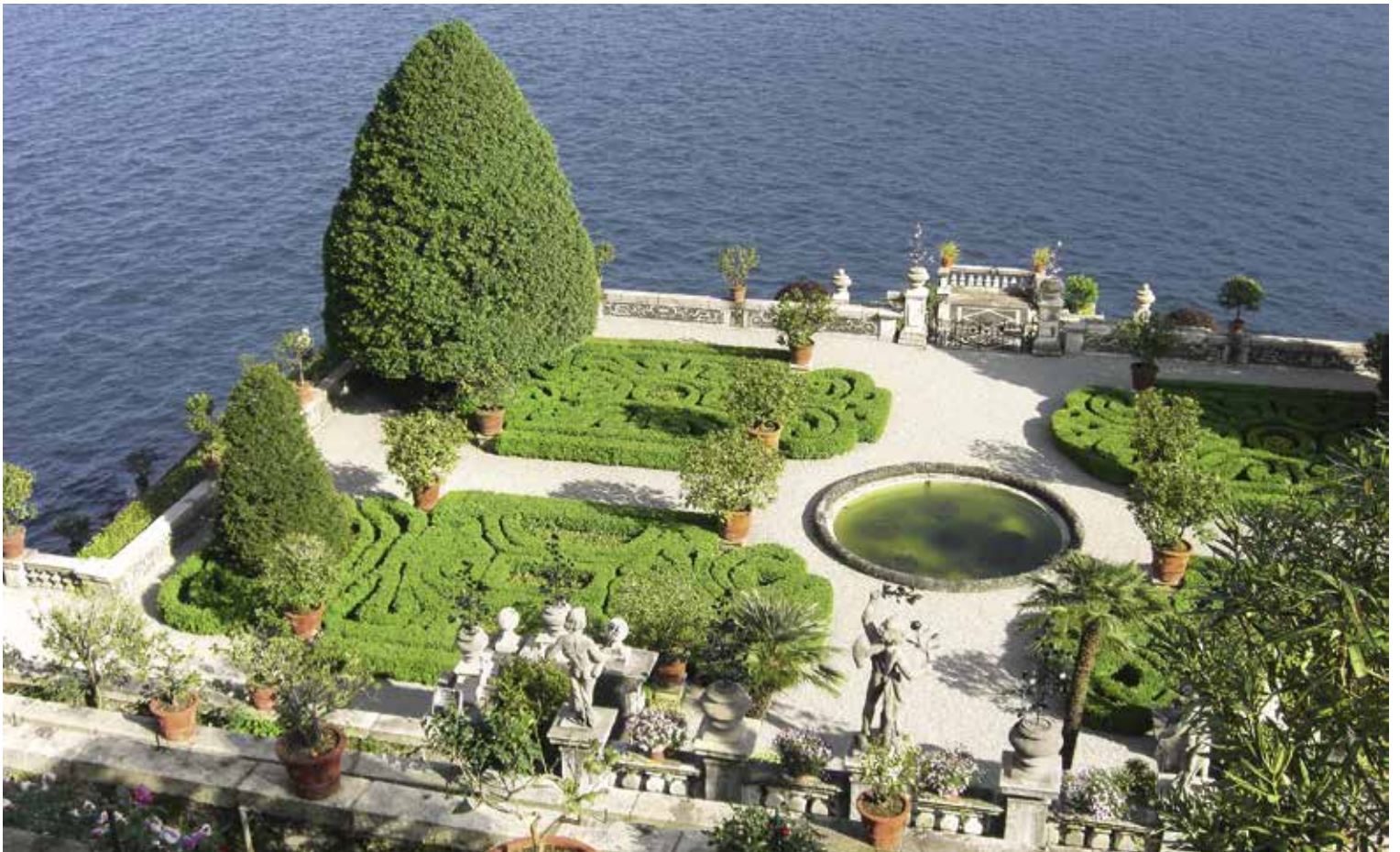
Vue d'un jardin sur l'Isola Bella A.-M. Mazzariol