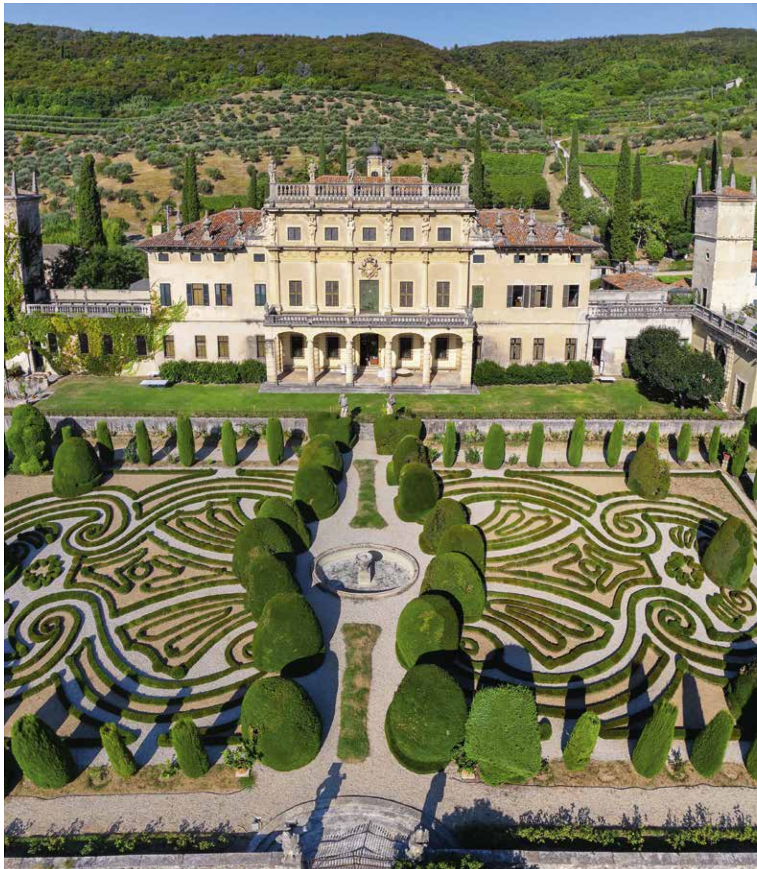
La villa Arvedi et ses jardins à l'italienne 📍 Villa Arvedi