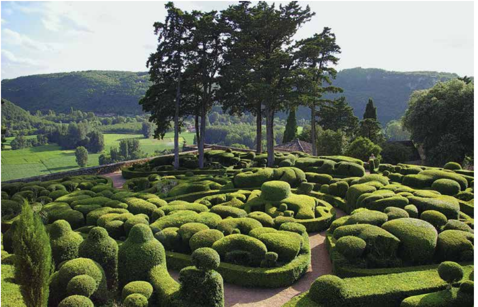
Les jardins de Marqueyssac