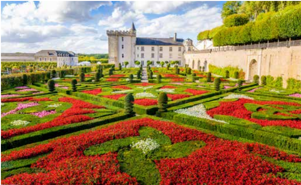
Les jardins du château de Villandry

Après la chute de l'Empire romain, les techniques de culture et de jardinage se sont transmises, grâce notamment aux monastères, lieux de sauvegarde des savoirs botaniques et des pratiques horticoles.