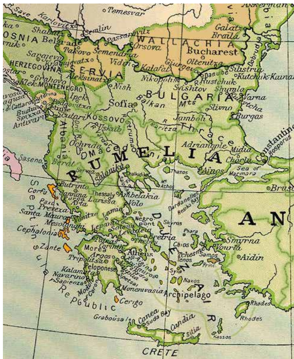
Carte de Roumélie en 1817 – la Grèce sous occupation ottomane

L'épisode est rapporté par un médecin français, admirable connaisseur de la Grèce de son temps, authentique philhellène, ancien consul de France à Ioannina, François Pouqueville, qui, dans son Histoire de la régénération de la Grèce (1824), le hisse pratiquement au niveau du miracle : le 25 mars était en effet le jour de l'Annonciation, les prophéties du métropolite recoupaient de vraiment très près, sous sa plume, le déroulé des événements à venir et le cri de ralliement des Grecs assemblés, La Victoire de Dieu ! rappelait étrangement celui des Maccabées bibliques en révolte. Quoi qu'il en fût, l'Επανάσταση (la Révolution) grecque avait bel et bien commencé et elle avait son indispensable héros fédérateur.