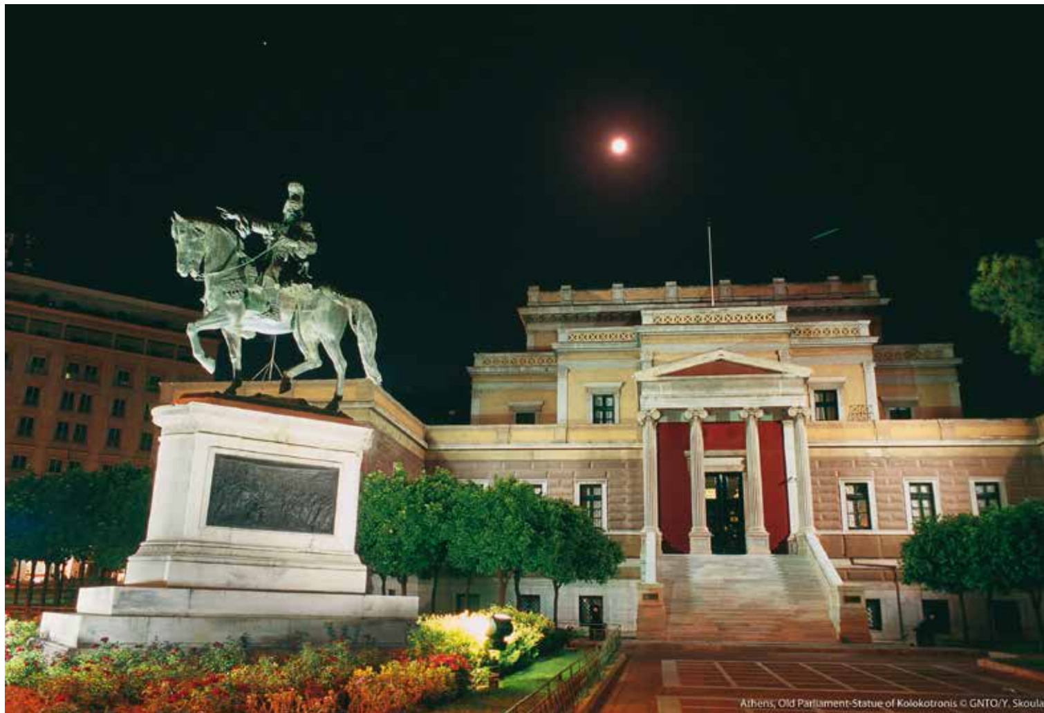
Statue en hommage à Theódoros Kolokotrónis, héros de la guerre d'indépendance grecque, à Athènes