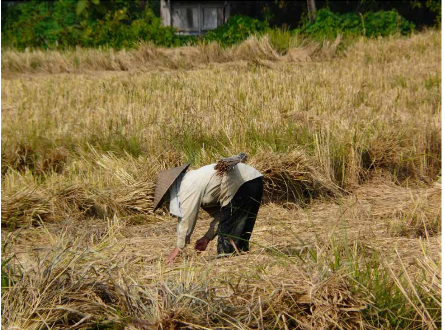
La récolte du riz, principale culture du Laos

Seul parmi les pays d'Asie du Sud-Est à ne pas avoir de façade maritime, le Laos, souvent disputé entre ses voisins (Vietnam, Cambodge, Thaïlande, Myanmar et Chine), a été à la fois un État "tampon" et un lieu de passage pour les hommes et les denrées commerciales. Cette situation particulière a en partie forgé un esprit laotien qui rend le pays des plus attachants.