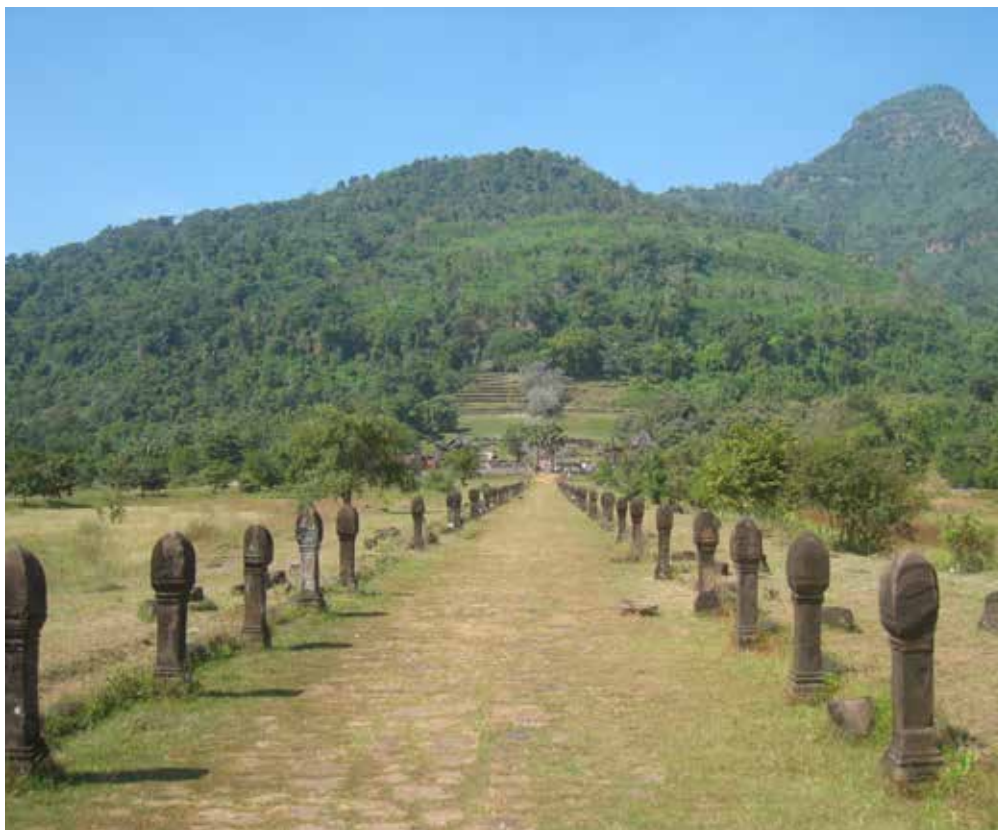
Le site de Wat Phou, le Phou Kao dominant en arrière-plan

Dans la province de Champassak, à 120 km au nord des chutes de Khone qui marquent la frontière avec le Cambodge, le Phou Kao culmine à 1 476 m d'altitude. Cette montagne est couronnée par une formation naturelle évoquant un linga, symbole du dieu Shiva. Des inscriptions khmères témoignent que, dès la seconde moitié du v e siècle, elle est connue sous le nom de Lingaparvata. Les sources épigraphiques, confirmées par l'archéologie, révèlent que la région, d'abord occupée par les Chams (originaires du Vietnam), fut conquise par les Cambodgiens. C'est sur les flancs du Lingaparvata que fut construit l'ensemble khmer de Wat Phou. De fondation préangkorienne, il s'agit d'un complexe monumental hindou des x i e et x ii e siècles qui se développe sur 7,4 km selon un plan axé est-ouest. De la hauteur de la plaine jusqu'à 100 m au-dessus se succèdent deux grands réservoirs ( baray ) suivis par une allée de bornes qui se termine par deux "palais" symétriques ; ensuite, une grande allée conduit à des séries d'escaliers escadant la pente. Ils donnent accès à la terrasse supérieure, soutenue par sept grandes terrasses en gradins. En haut, le sanctuaire principal s'ouvre à l'est. La terrasse est bordée au nord par un portique autrefois couvert, adossé à une falaise où coule une source sacrée qui alimentait probablement la cella (sanctuaire interdit aux profanes) en eau lustrale.