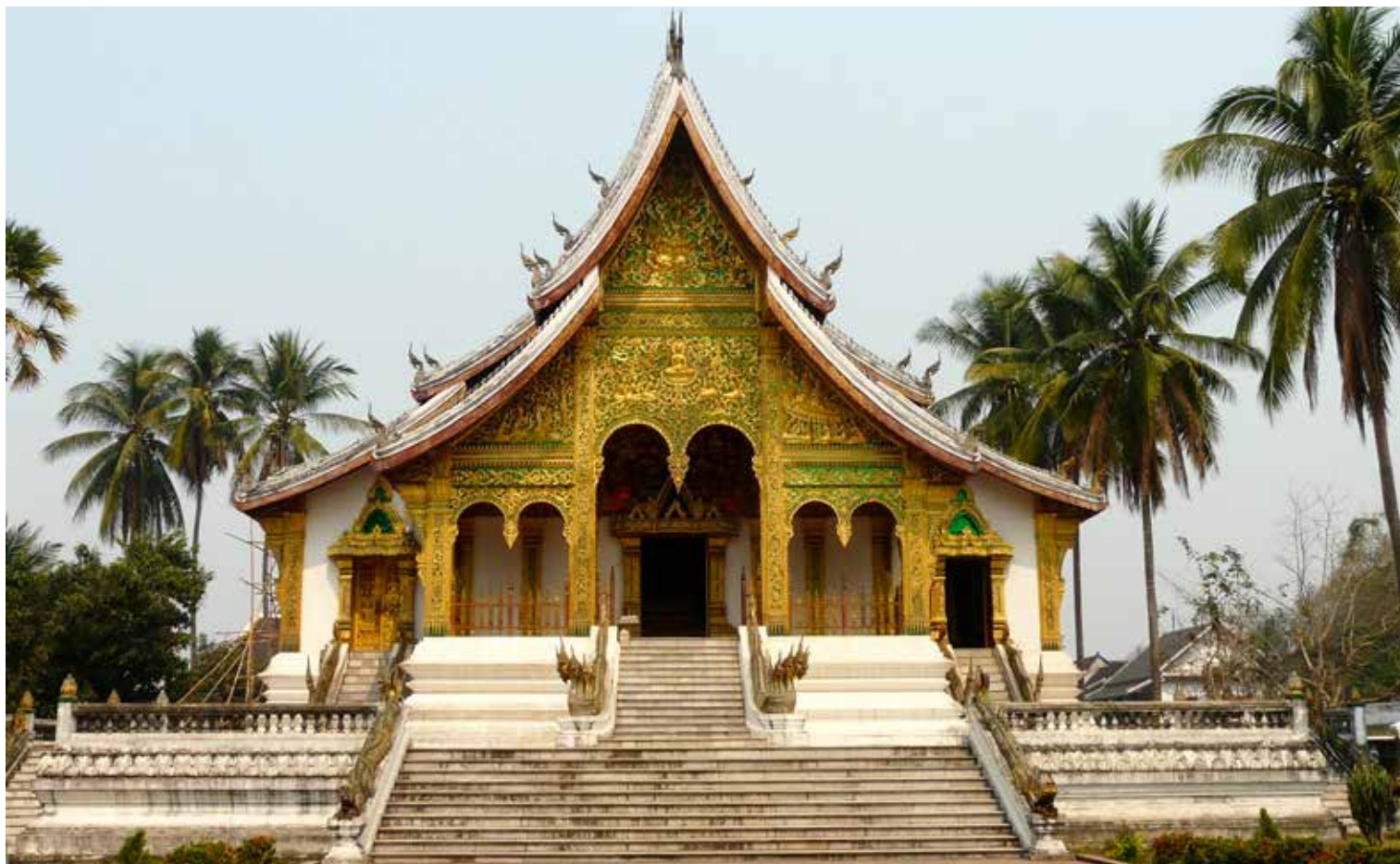
La chapelle du Palais royal abritant le Prabang, à Luang Prabang 🇇🇵 M.-F. et J. Charles