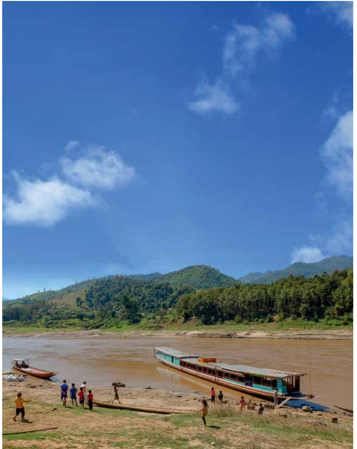
Les rives du Mékong, aux environs de Pakbeng