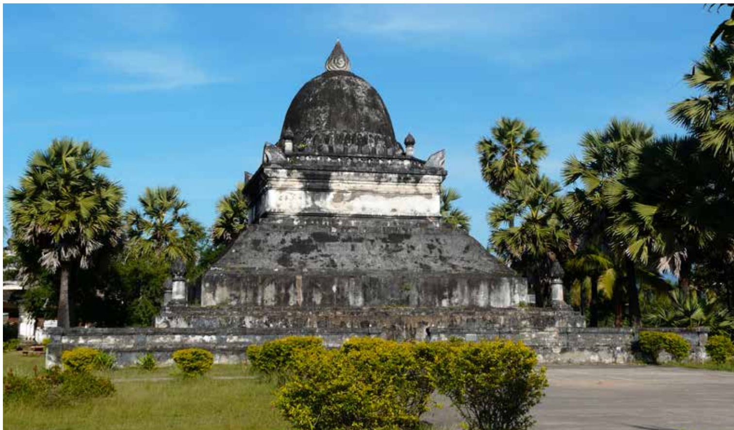
Le Tat Mak Mo, ou Watermelon Stupa

La toiture en bâtière débordante, souvent à recouvrements, permet d'assurer la protection de porches ou d'une galerie autour du bâtiment. Cette toiture a tendance à descendre assez bas dans les sim du nord du pays pour protéger contre le froid. Dans le sud, la toiture plus courte sur de hautes colonnes donne aux sim une silhouette plus proche de celle des sanctuaires thaïs, tel le Wat Phra Keo à Vientiane. La partie centrale de l'arête faîtière est ornée d'un Dok So Fa, "bouquet de fleur de ciel", symbolisant la montagne du centre du monde, le mont Meru. Il se compose de 1 à 7 petits édicules miniatures étirés en hauteur, de parasols ou même de nagas (créatures mythiques mi-hommes mi-serpents) de taille décroissante à partir d'un motif central. Le fronton triangulaire est généralement sculpté de divinités, de scènes bouddhiques ou inspirées du Ramayana lao.