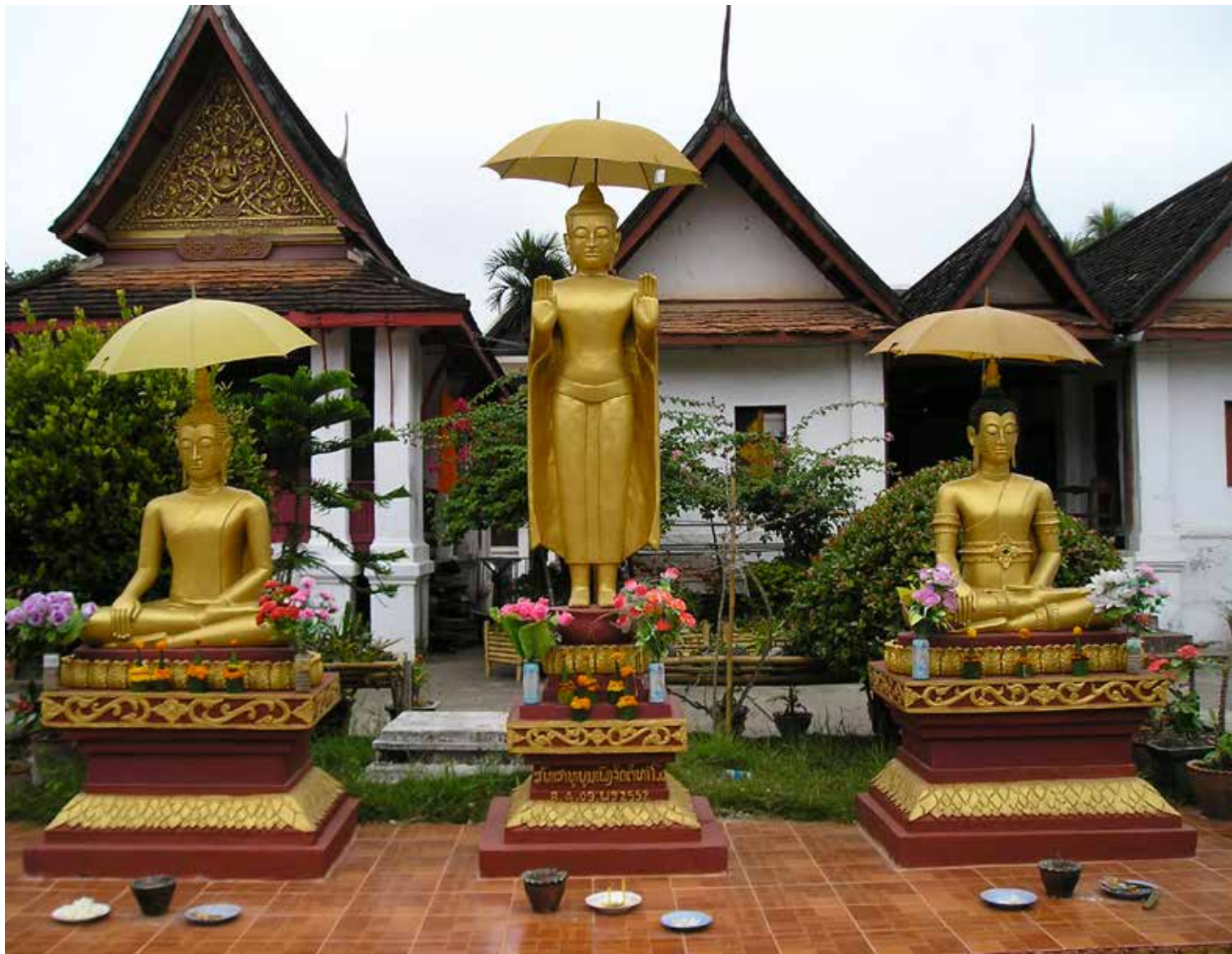
Statues de Bouddha dans ses deux poses les plus traditionnelles