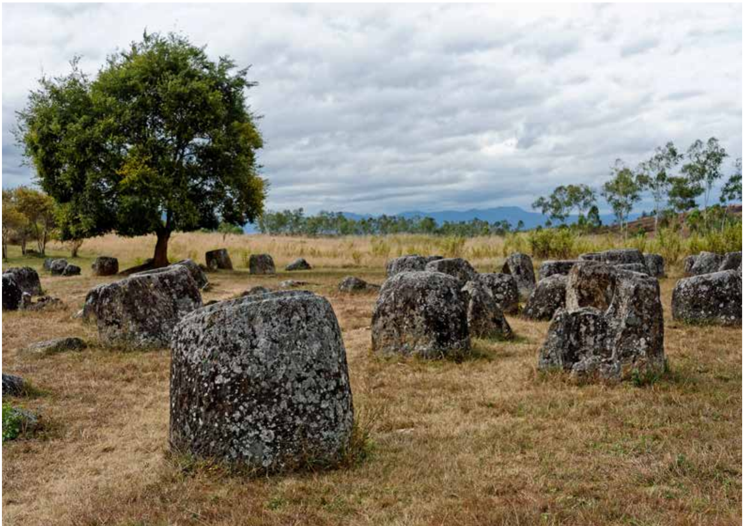
La plaine de Jarres, dans le nord du Laos

Dirigé par un gouvernement issu du Pathet Lao qui prit le pouvoir le 2 décembre 1975, se relevant difficilement de ses meurtrissures, le Laos s'est ouvert au tourisme au début des années 1990. En 1995, Luang Prabang, son ancienne capitale, était inscrite sur la liste du patrimoine mondial de l'Unesco.