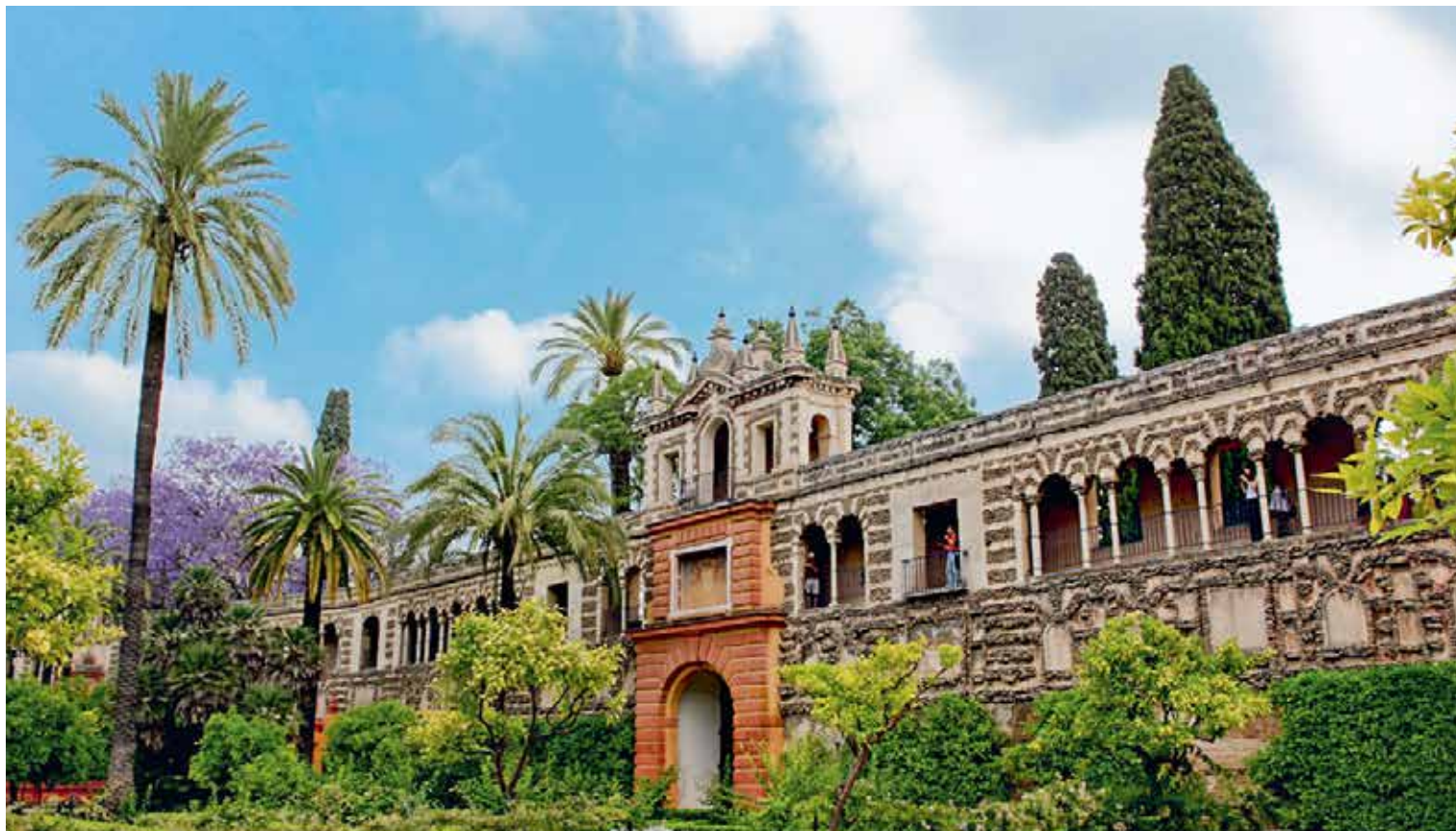
L'Alcázar à Séville 📍 Turismo de Sevilla