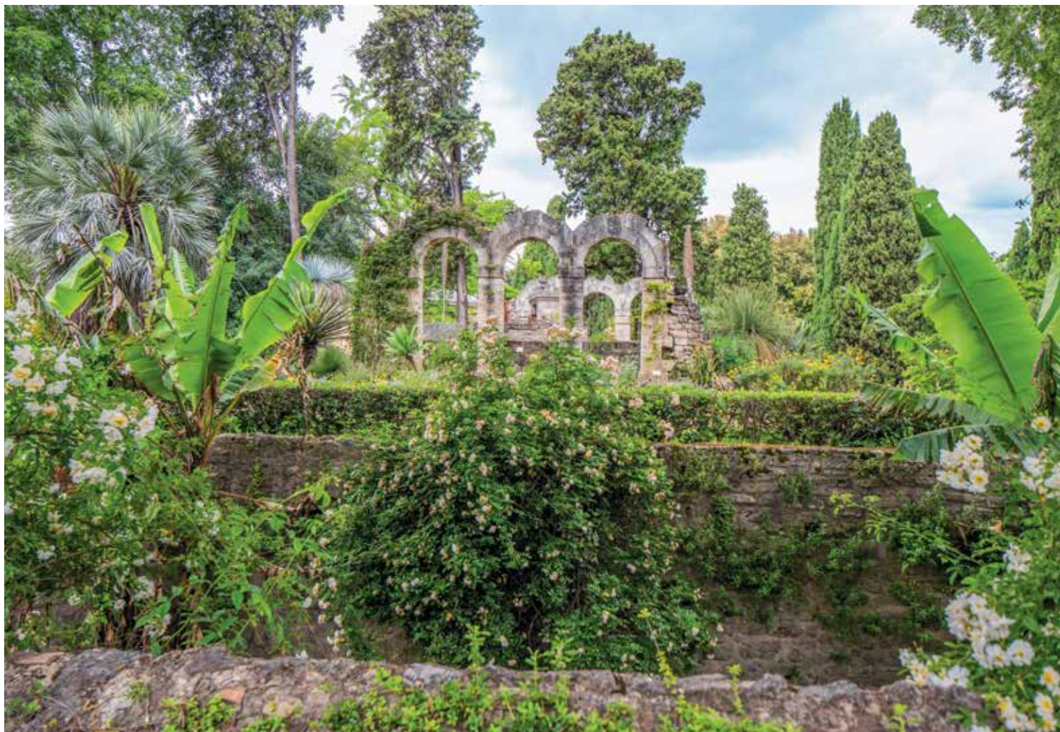
Le jardin botanique de Montpellier 📍 O.T. de Montpellier

profitent de vastes panoramas et facilitent la promenade le long de ces pentes abruptes. D'héritage agricole, ces terrasses de culture en pierres sèches restituent la nuit, la chaleur emmagasinée pendant la journée et permettent de lutter contre le ruissellement des eaux lors des épisodes pluvieux d'automne. Traditionnellement, ces restanques combinent sur un même terrain fruitiers, oliviers, céréales, légumes et fleurs. Jean Giono, dans La pierre, Arcadie, Arcadie , a chanté le bonheur simple que l'on y ressent : "Sur ces terrasses, la vie est non seulement aisée mais belle. [...] Qu'on vienne à ces terrasses pour bêcher autour des arbres ou pour flâner, c'est un délice. Dans l'arrière-saison, le soleil s'y attarde ; le feuillage de l'olivier ne fait pas d'ombre, à peine comme une mousseline."