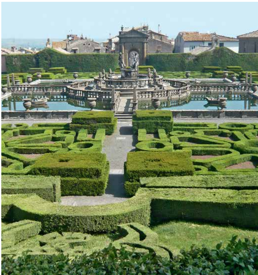
Le jardin de la villa Lante, à Bagnaia

Le second paysagiste se nomme Ferdinand Bac (1859-1952). Artiste aux multiples talents – peintre, dessinateur, romancier – et à la longévité exceptionnelle, il commence à créer des jardins sur la Côte d'Azur à partir de 1912, pour de riches particuliers. Il aménage d'abord le jardin de la villa Croisset, à Grasse, un jardin en terrasses qui s'inspire de la villa d'Este et du jardin du Generalife de Grenade. Puis le jardin de la villa Fiorentina, au cap Ferrat, pour la comtesse de Beauchamp. Enfin, son œuvre-maitresse est le jardin Les Colombières, créé à Menton dans les années 1920-1926. Il y développe une architecture de sentiment, basée sur la réminiscence des sites célèbres de la Méditerranée vus au cours de ses nombreux voyages. Ainsi, on trouve aux Colombières un bassin espagnol, un casino de Palladio, un obélisque et un banc romain, notamment. Pour Ferdinand Bac, le rivage méditerranéen est toujours le séjour des nymphes et des dieux ; il les convoque dans ses jardins et leur rend hommage par des statues ou des inscriptions lapidaires qui émaillent les différentes scènes paysagères.