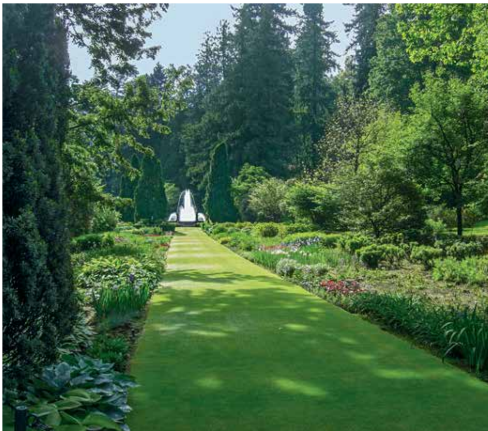
Les jardins de la villa Taranto

“Sur les bords de la Méditerranée, les jardins, pour être des lieux de repos et de délices, associent aux parfums vifs du jour et de la nuit, aux couleurs harmonieuses rivales des fleurs incessantes, des feuillages et des faïences, les ombrages et la fraîcheur des eaux.”