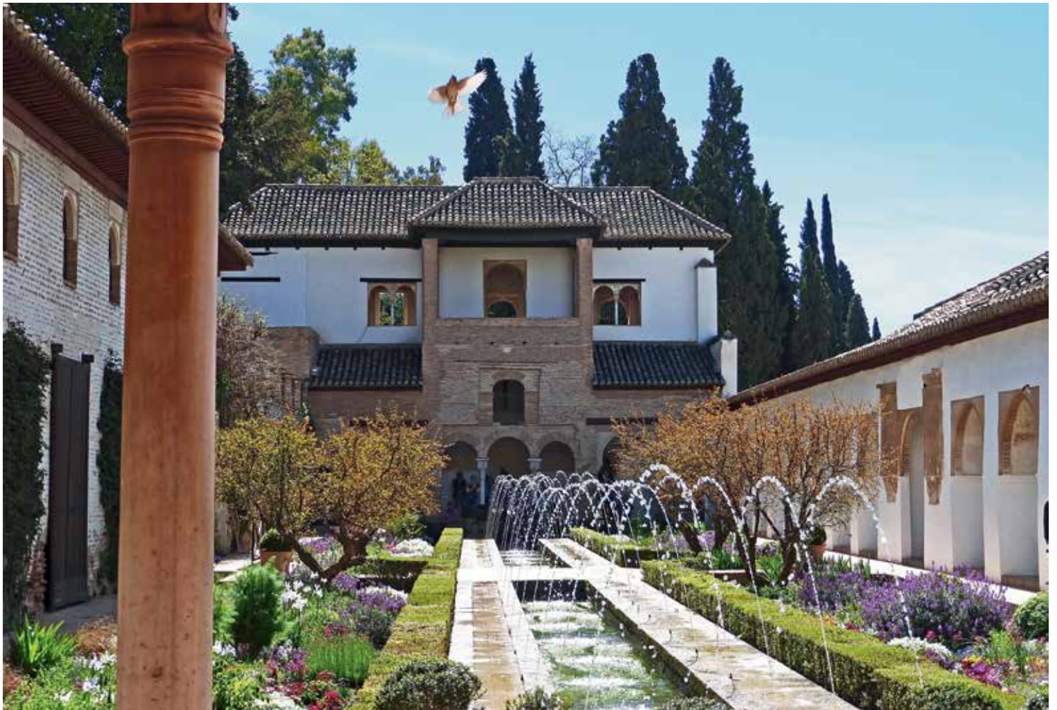
Dans les jardins du Generalife, à Grenade 🇪🇸