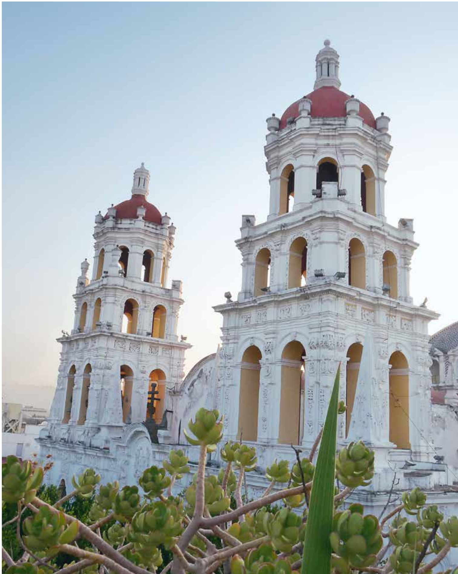
Vue sur l'église de Puebla 📍 C. Le Scao