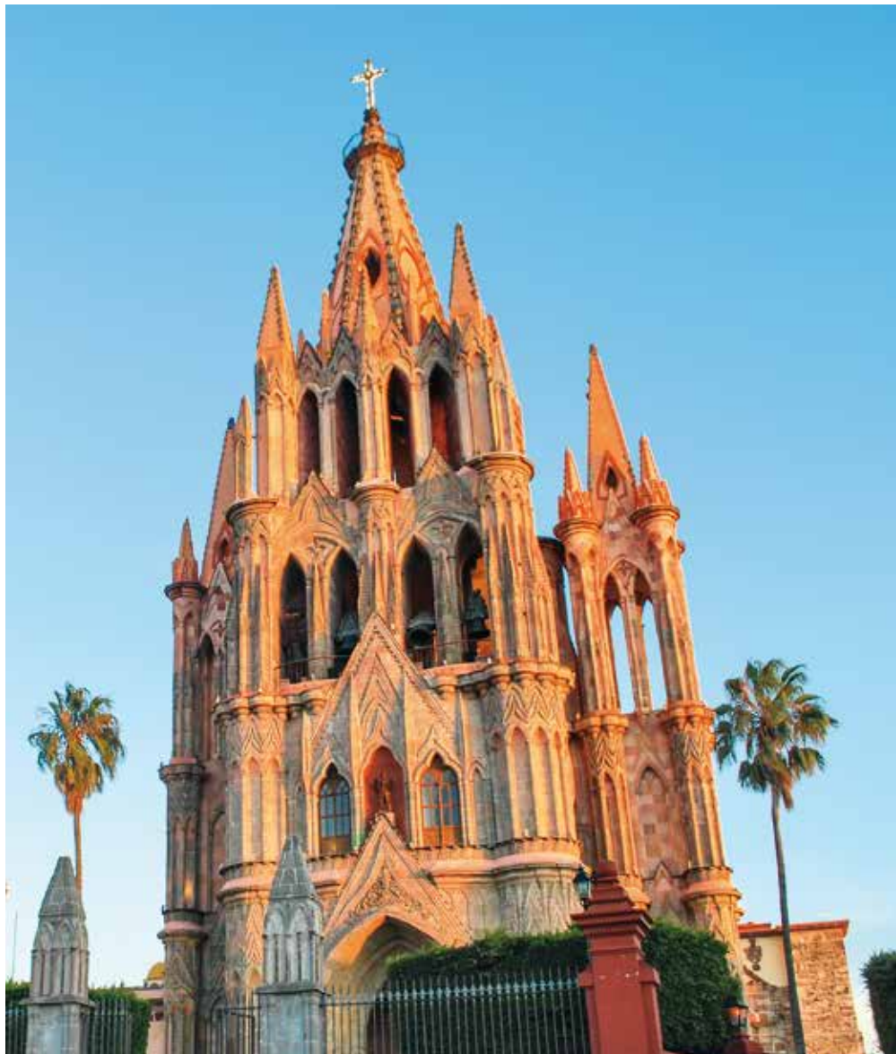
Église à San Miguel de Allende

La Puebla de los Angeles est l'archétype de la ville espagnole. C'est une des premières villes fondée après la Conquête (1531) au pied des volcans et à proximité de la grande cité indigène de Cholula réputée à l'époque précolombienne pour son enceinte sacrée et ses temples. Puebla acquiert rapidement un grand rôle en raison de sa situation sur l'un des axes économiques majeur de la Nouvelle-Espagne, la route de Mexico à Veracruz, qui draine l'essentiel des richesses du pays et des marchandises importées. Elle est le siège d'un évêché important, le premier fondé en Nouvelle-Espagne en 1525. Elle compte en 1570 trois établissements des ordres mendiants. La construction de Puebla repose en grande partie sur la main d'œuvre réquisitionnée par les autorités dans les villages alentour. La population augmente régulièrement quoique modestement tout au long du XVI e siècle, elle passe de 50 vecinos en 1531 à 1 500 en 1600. Elle possède aussi des quartiers indigènes. Elle devient bientôt l'une des villes les plus importantes de la Nouvelle-Espagne.