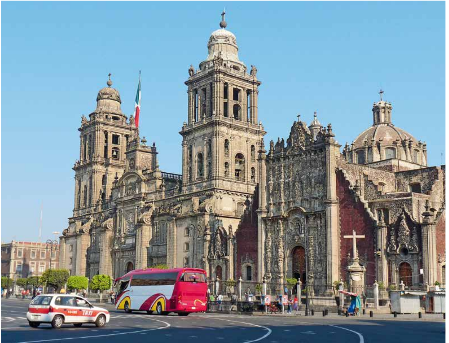
La cathédrale Metropolitana de Mexico 📍 C. Le Scao