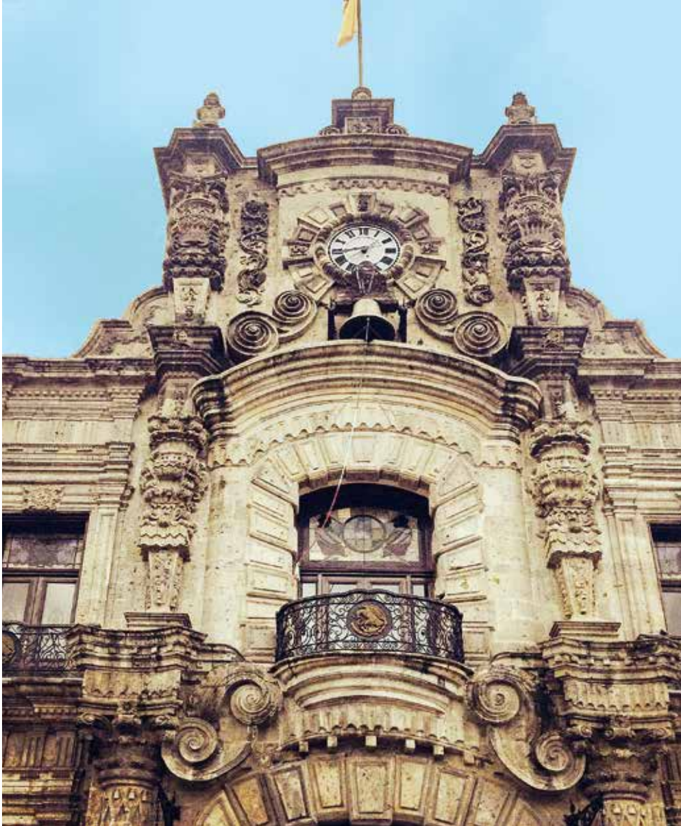
Le palais du gouvernement à Guadalajara

Les terres sont exploitées. Des chemins et des routes reliant les principaux centres de production et d'échange sont construits. Deux d'entre eux occupent une place fondamentale pour l'économie de la Nouvelle-Espagne : d'une part le chemin royal, le camino real , allant de Mexico à Veracruz, qui est la porte d'entrée de tous les produits venant de l'empire espagnol, et qui passe par Puebla, et d'autre part, le chemin allant de Mexico aux zones minières du Nord, qui draine le minerai d'argent qui y est exploité, et qui est ponctué de villes nouvellement fondées par les Espagnols : Guanajuato, Querétaro, San Miguel.