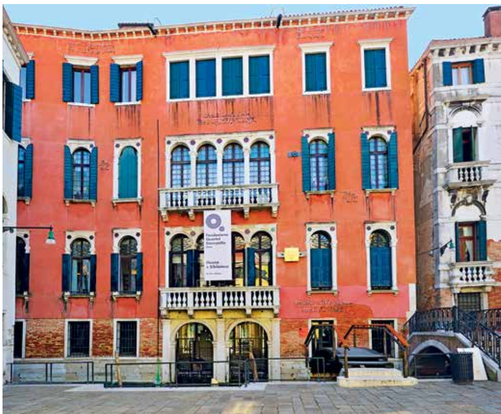
La façade de la fondation Querini Stampalia, à Venise