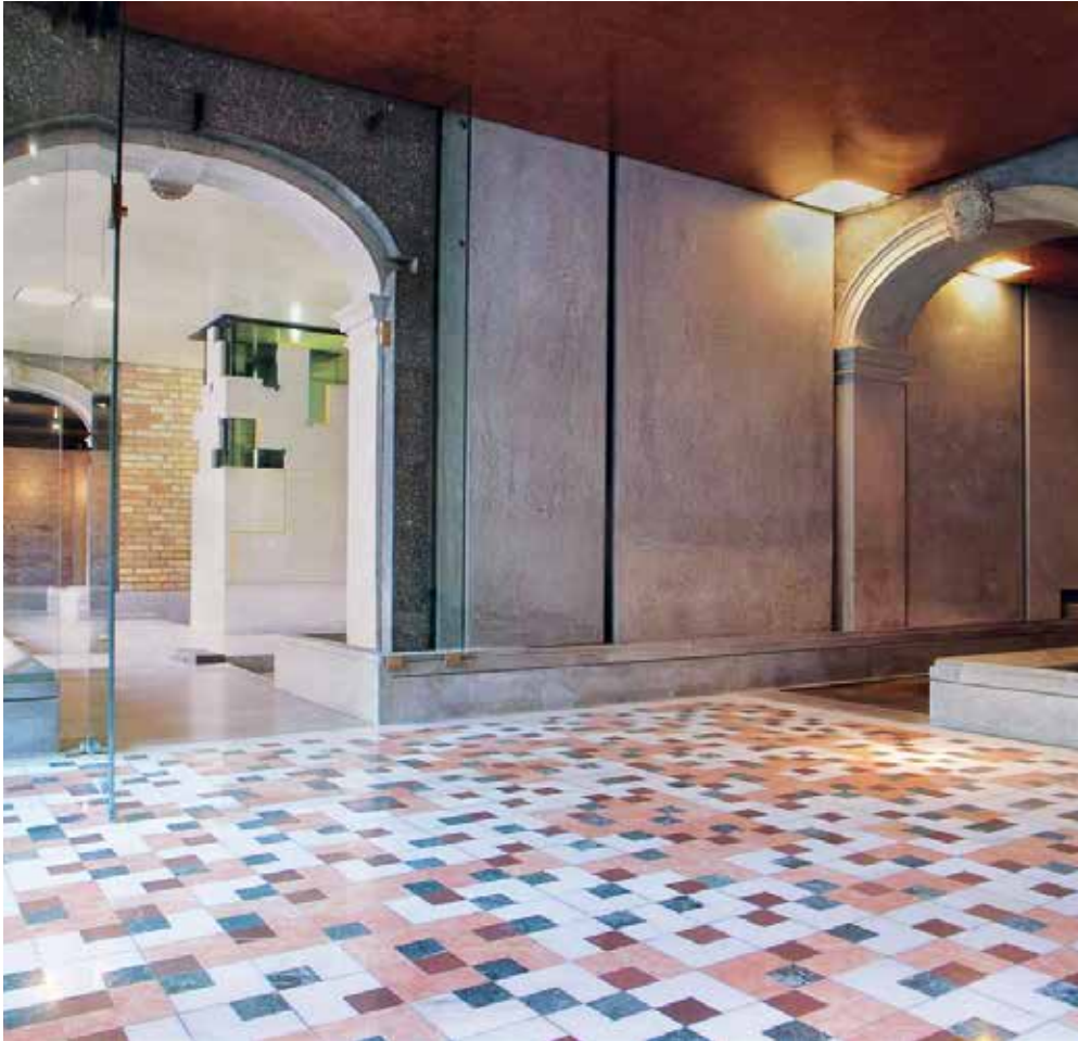
Couloir dans la fondation Querini Stampalia, à Venise