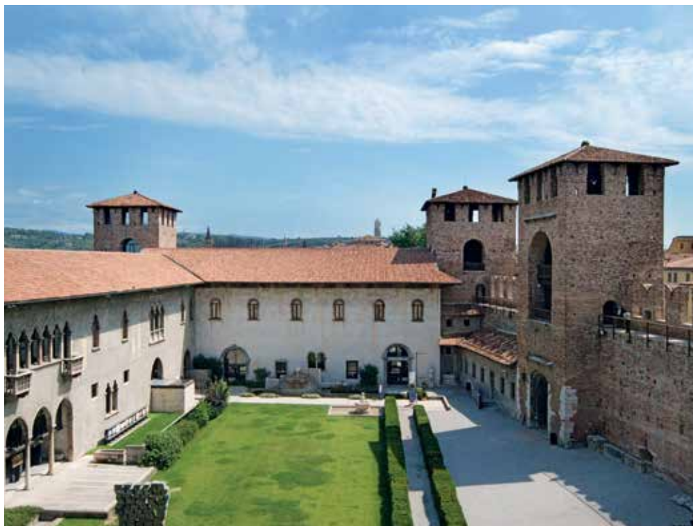
Le musée de Castelvecchio à Vérone

Ce ne sera qu'au cours des années 1950, au bout de 25 ans d'activité (comme pour son ami L. Kahn), que les bases définissant le génie architectural de Scarpa seront jetées. Son univers mental n'en demeurera pas moins composite, retenant en matière de sources architecturales, Wright et Hoffmann pour les matériaux et la conception spatiale, et Le Corbusier pour l'orientation fondamentale ; du côté des arts plastiques, la grammaire néo-plastique de De Stijl et de Mondrian en particulier, mais aussi l'expérience néo-Liberty parce qu'elle valorise l'ornement et les apports de l'artisanat, sans oublier l'univers proche et extrême-oriental dont l'esprit le fascine. Il continuera d'expérimenter et de créer aux frontières de l'architecture et des arts visuels, avec une remarquable capacité à sélectionner des références dans les systèmes figuratifs les plus divers. Ensuite, lors du processus de conception, les modes opératoires sont fort diversifiés et souvent simultanés : synthèse, fusion, assemblage, collage... d'où l'impression de richesse et de complexité, à l'inverse des grands architectes de son temps, chefs de file aux opinions affirmées et pénétrés de convictions.