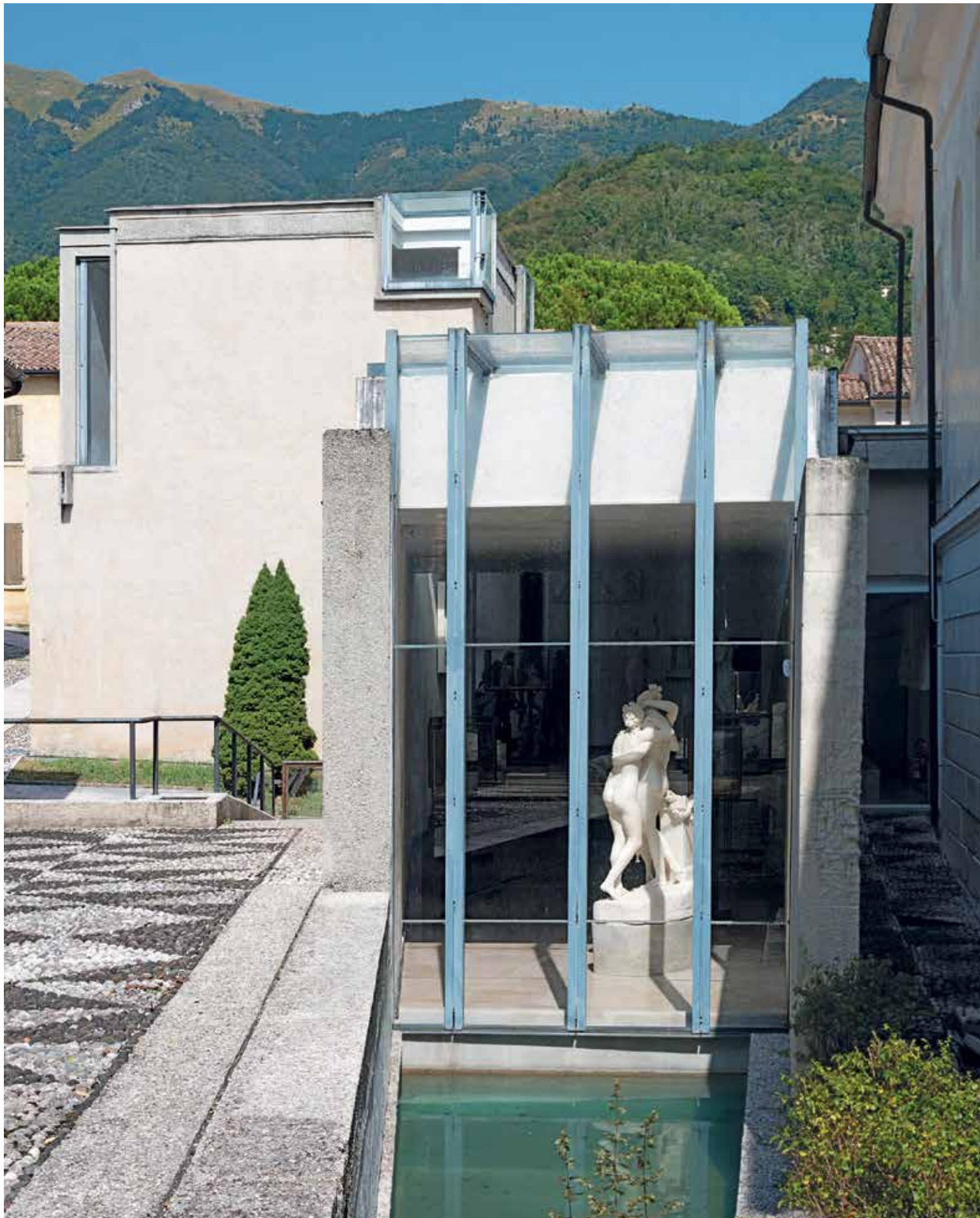
Le Musée Canova à Possogna 📍 Musée Canova