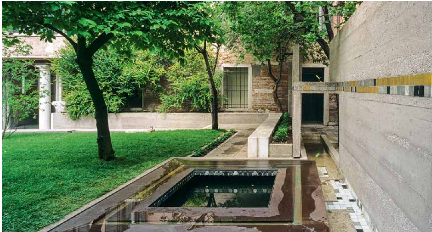
Dans les jardins de la fondation Querini Stampalia, à Venise

L'organisation des parcours, bien que simple et linéaire, n'est pas moins savante. Le cheminement est pensé en séquences avec des temps de suspension hors exposition qui favorisent des points de vue sur une ambiance, celle des jardins, de l'édifice, des bassins ou des objets précieux. Grâce à ces pôles d'attraction, l'alternance entre moments d'attention et de repos est équilibrée pour maintenir la capacité d'attention. Les œuvres présentées sont peu nombreuses et les lieux sont ajustés pour induire la plus forte relation avec elles. L'itinéraire respecte l'ordre chronologique et les regroupements thématiques, parfois moins les genres, instaurant des proximités insolites.