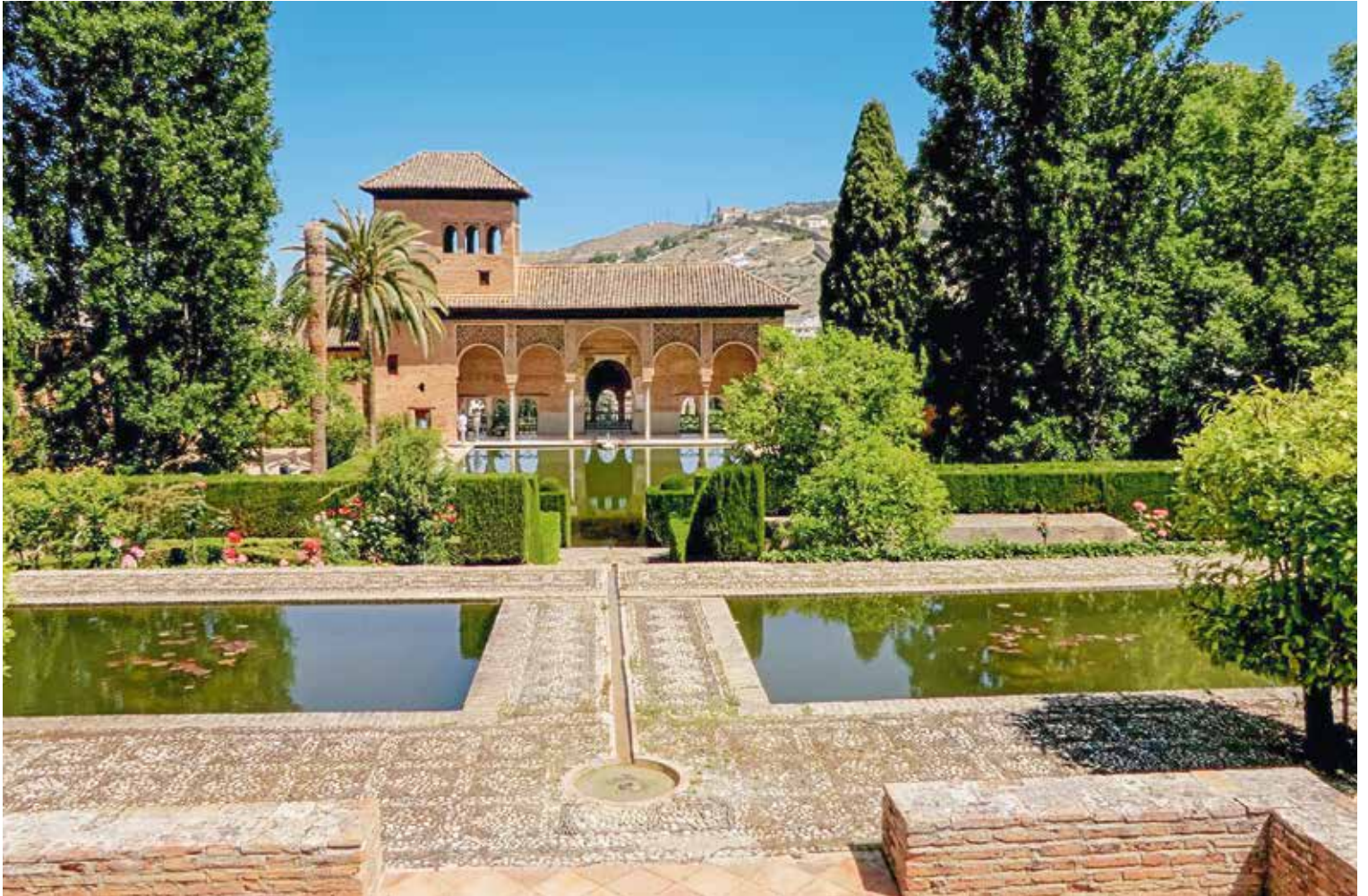
Les jardins du Partal à l'Alhambra, réaménagés au xx e siècle.

Sonore et démonstrative, l'eau est mise en scène grâce à l'industrie des hydrauliciens arabes. Symbole de la générosité du calife qui calme la soif de son peuple, l'eau est chantée par les poètes de l'Alhambra, et notamment par Ibn Zamrak, au xiv e siècle. Les vers qui courent autour de la fontaine des Lions proclament que "cette fontaine est pareille à un nuage bienfaisant dont les gouttes inonderaient les lions. Comme des récompenses ruisselant des mains du calife qui distribue les prises à ses lions de guerre, les flots s'écoulent sur ces fauves qui rampent devant leur maître." Sur les murs de la cour des Myrtes, antichambre de la salle du Trône, le visiteur peut lire : "Celui qui viendra à moi assoiffé, je le conduirai vers un endroit où l'eau est fraîche, douce et claire."