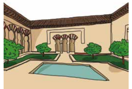
Reconstitution du patio de la Alberca, à Medina az-Zahara

Cette ville palatiale construite en 936 par le calife 'Abd al-Rahman III près de Cordoue, au pied du massif de la Sierra Morena, recèle les premières traces de jardins arabo-andalous. Prospère, elle compte jusqu'à vingt mille habitants mais est détruite par des mercenaires au XI e siècle, lors de la chute du califat de Cordoue ; c'est pourquoi elle reste le symbole du luxe éphémère. Les fouilles archéologiques indiquent que toutes les demeures possèdent une cour plantée de végétation pouvant recevoir un bassin, à l'image de la cour du Bassin ( patio de la Alberca ) qui est un jardin carré divisé en deux parterres par une allée centrale menant à un bassin. Fontaines et canaux animent la ville du bruit de l'eau et rafraîchissent l'atmosphère.