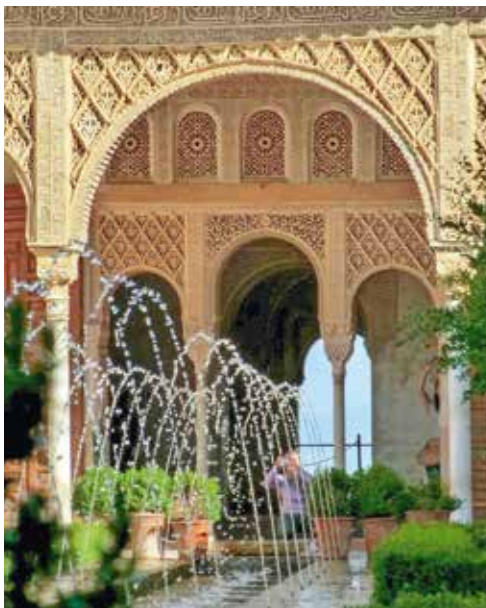
La cour du Canal dans les jardins du Generalife 📍 A. Roux

Jardin d'été des sultans de Grenade, ce jardin de plaisance, dont le nom signifie "jardin de l'architecte" ( jannat al-arif ), date du XIV e siècle. Jardin en terrasse, voisin du palais de l'Alhambra, il renferme plusieurs cours jardinées, dont la cour du Canal ( patio de la Acequia ), célèbre pour ses jets d'eau qui se croisent au-dessus d'un canal central. Ce patio est le plus ancien jardin privé d'agrément d'Europe et un des rares jardins médiévaux resté en usage de sa construction jusqu'à nos jours.