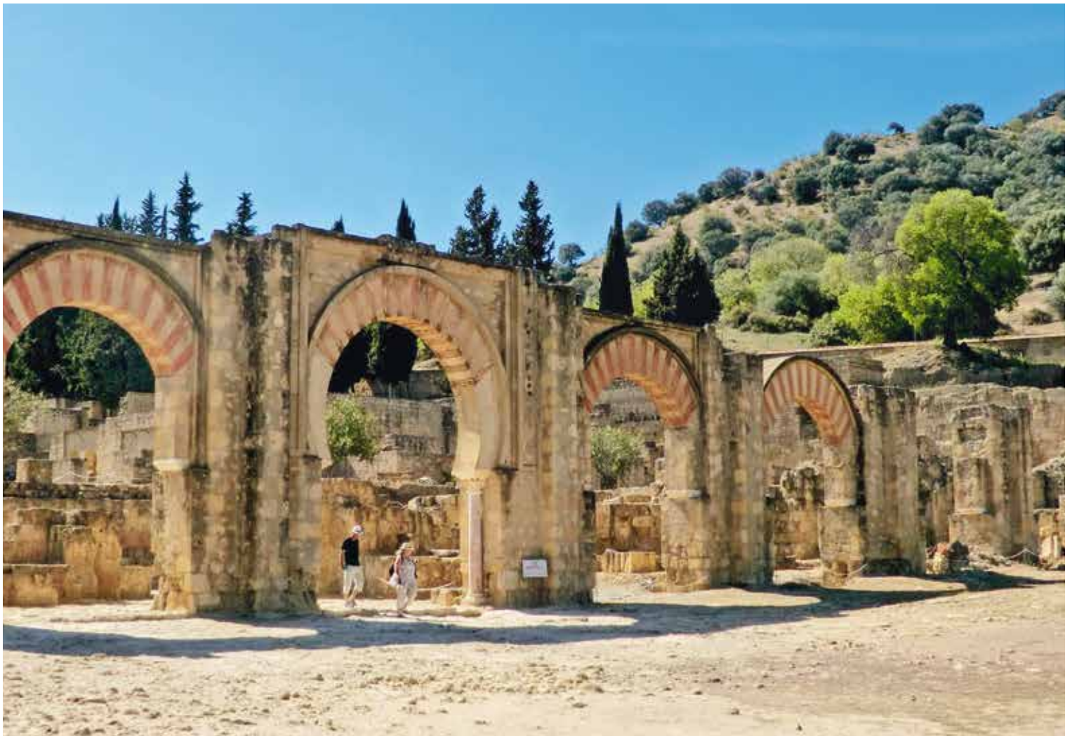
Les vestiges de Medina az-Zahara

Un autre pavillon, à Tolède, le pavillon de Cristal du sultan al-Mamun, aujourd'hui disparu, a permis au souverain de profiter de la fraîcheur grâce à un ingénieux système faisant ruisseler l'eau depuis le toit du pavillon.