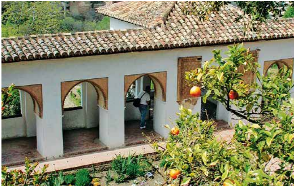
Dans les jardins du Generalife

Cette métaphore du paradis promis au fidèle est un procédé rhétorique qui s'inscrit dans une tradition littéraire d'éloge du paysage ; elle ne signifie pas que les jardins arabo-andalous sont l'incarnation matérielle d'une transcendance ou d'un principe religieux.