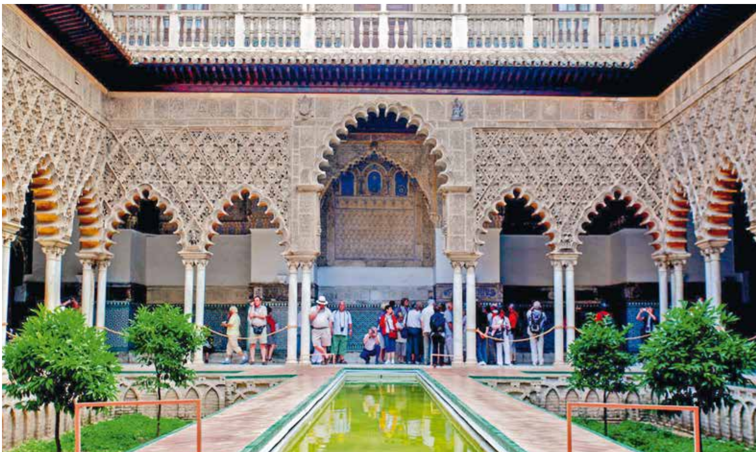
Exemple de jardin aux parterres encaissés, dans la cour des Demoiselles à l'Alcázar de Séville 🇪🇸 Turismo de Sevilla