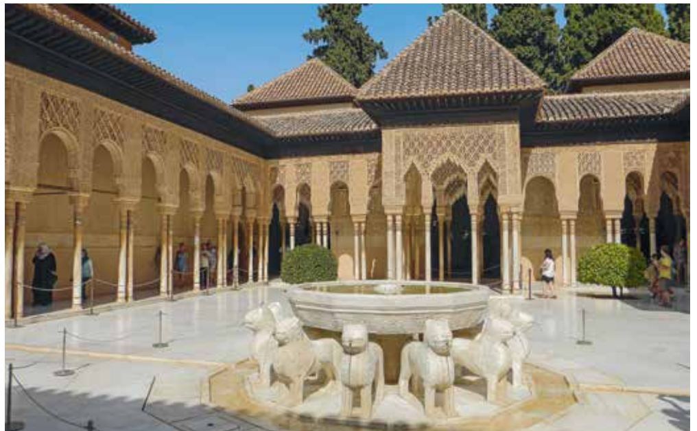
La fontaine de la cour des Lions, à l'Alhambra 📍 C. Chenu

Dans le palais de l'Alhambra, l'eau assure la continuité d'un espace à l'autre : elle circule dans des canaux creusés à même le sol qui relient entre elles les différentes salles et dépendances du palais avant de converger vers la fontaine des Lions, située au milieu de la cour des Lions, au centre du palais. Cette fontaine, taillée dans un seul bloc de marbre posé sur douze lions sculptés, a comporté à l'origine deux vasques surmontées d'un grand jet d'eau.