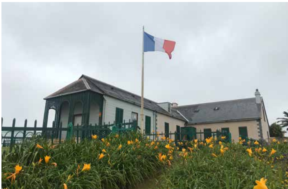
Longwood House, dernière résidence de Napoléon Ier à Sainte-Hélène

Contre cette décision de l'envoyer à Sainte-Hélène, Napoléon eut beau protester, tempêter, rien n'y fit. Il ne serait jamais accueilli en terre anglaise. Avant d'entreprendre le grand voyage, il resta quelques jours en rade de Plymouth sans toutefois pouvoir toucher terre, les Anglais n'ayant aucune envie qu'en vertu de l' habeas corpus un avocat ne vienne entraver devant un tribunal la déportation qu'ils projetaient. Dans la rade, une multitude de barques remplies de curieux mais aussi d'admirateurs s'approcha très près du vaisseau britannique le Bellorophon dans l'espoir d'apercevoir "Boney". Quand il parut sur le pont et se mit à saluer la foule aux aguets, une clameur s'éleva au milieu des flots. Le peuple britannique lui rendait hommage.