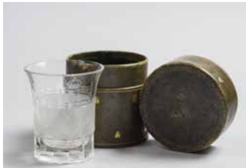
Verre gobelet de Napoléon Ier et son étui

Et s'il lui venait une petite soif, il lui suffisait de demander à l'officier qui l'accompagnait de sortir de son rangement un nécessaire en peau cramoisi renfermant trois flacons de cristal, deux verres à vins, deux verres à liqueurs, deux autres verres à vin avec leur étui et deux autres verres à liqueurs taillés en diamants également avec étui. Quant aux boissons, elles étaient bien protégées dans deux cantines placées sous les sièges. Au choix, Napoléon pouvait boire du Chambertin, son vin préféré, mais aussi d'autres cépages ainsi que des liqueurs. En voyage, il pouvait également prendre du repos. Il suffisait alors de déplier le lit replié dans les sièges et d'y mettre le matelas conçu lui aussi pour la berline. Comme on n'est jamais trop prudent, en plus des armes emportées par sa suite, cinq emplacements étaient réservés à des pistolets. Enfin, un tiroir secret renfermait son importante cassette faite pour les imprévus du voyage, un trésor pouvant aller jusqu'à plusieurs centaines de milliers de francs or.