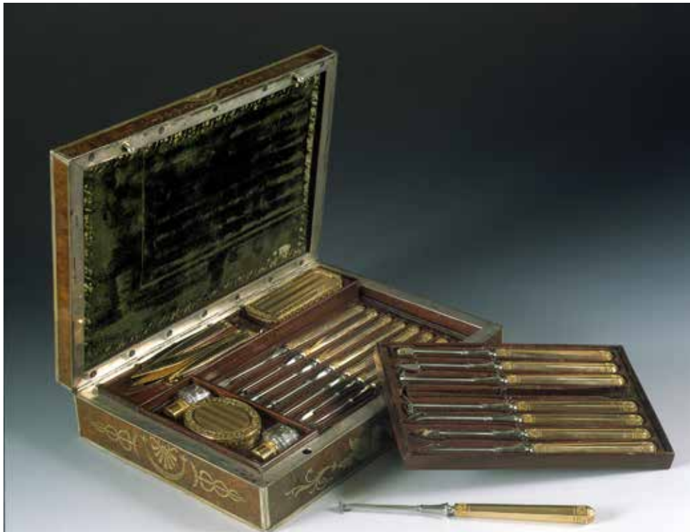
Nécessaire d'hygiène dentaire de Napoléon Ier

Quand Napoléon ne logeait pas dans un palais réquisitionné par son armée, il bivouaquait. La Maison de l'empereur prenait alors place au sein du Grand Quartier général impérial où se trouvaient les services du major général Berthier. Et le moins que l'on puisse dire, c'est que tout avait été prévu pour que son confort soit très convenable. Pour l'empereur, une série de quatre tentes fabriquées en coutil rayé liées par des corridors formait un premier salon, un deuxième salon, un cabinet et une chambre à coucher. À nouveau, on retrouvait à minima les dispositions d'étiquette du palais impérial. Les fourgons de la Maison contenaient tout ce qu'il fallait pour meubler élégamment le logis impérial : tapis en moquette forte avec un dessin en peau de tigre, écrioires roulants, tables pliantes en chêne fabriquées par Jacob Desmalter,