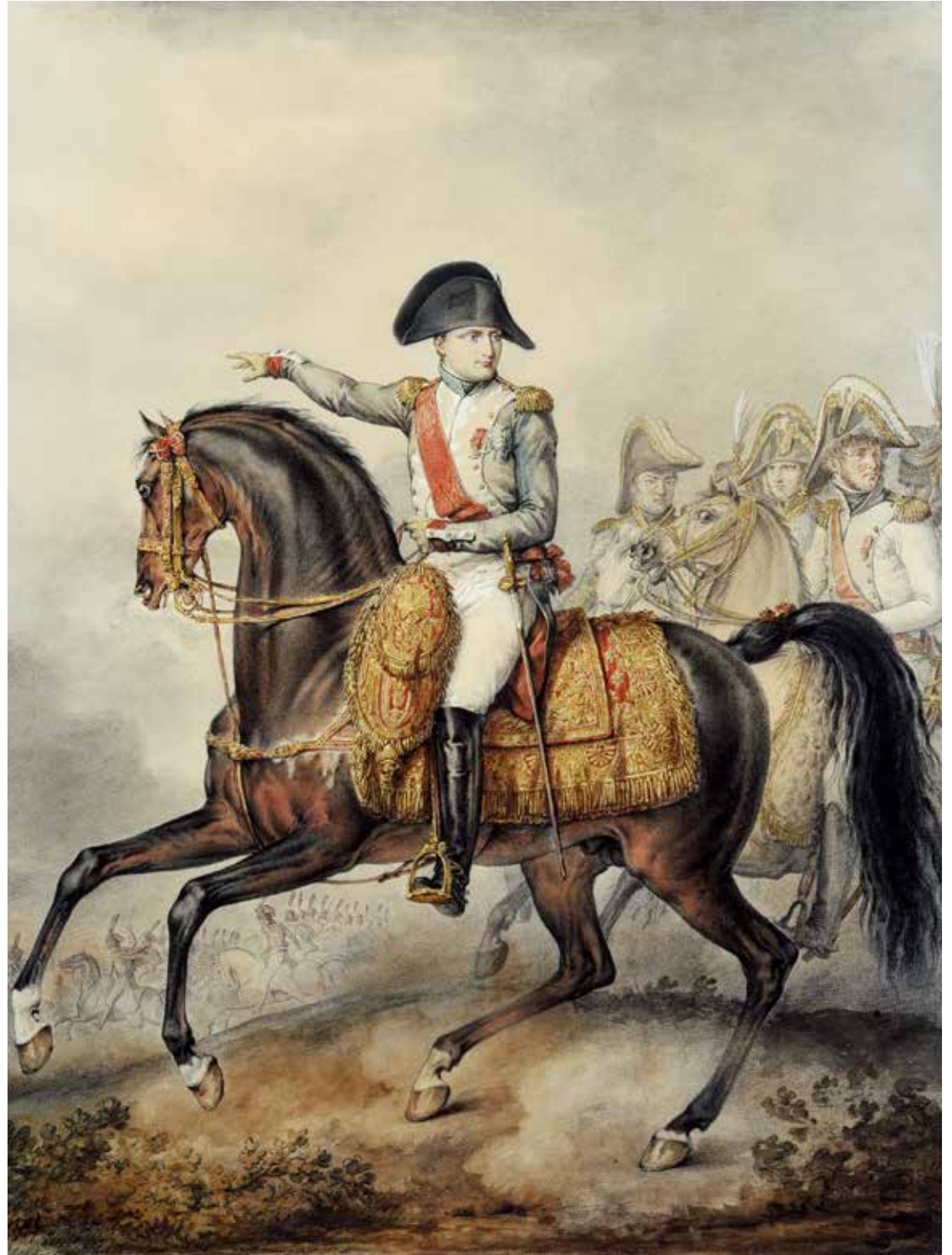
Bataille du Mont-Saint-Jean, dite de Waterloo, par Carlisle Vernet. Fondation Napoléon