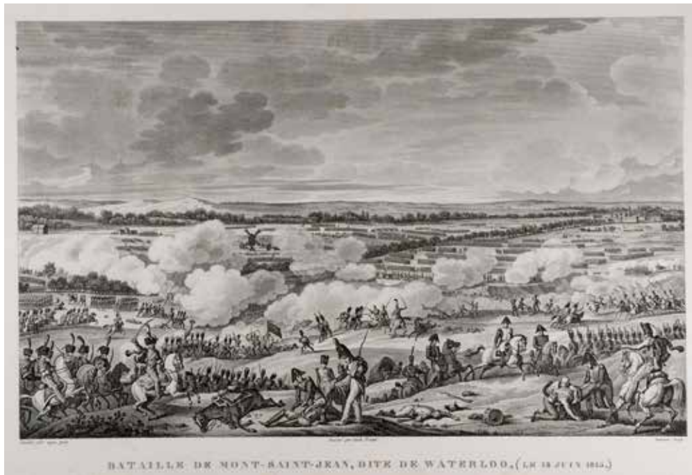
Bataille du Mont-Saint-Jean, dite de Waterloo, par Carle Vernet