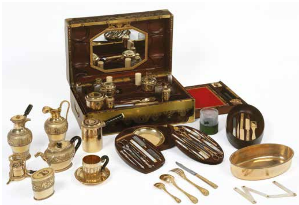
Nécessaire de voyage fabriqué par l'orfèvre Biennais