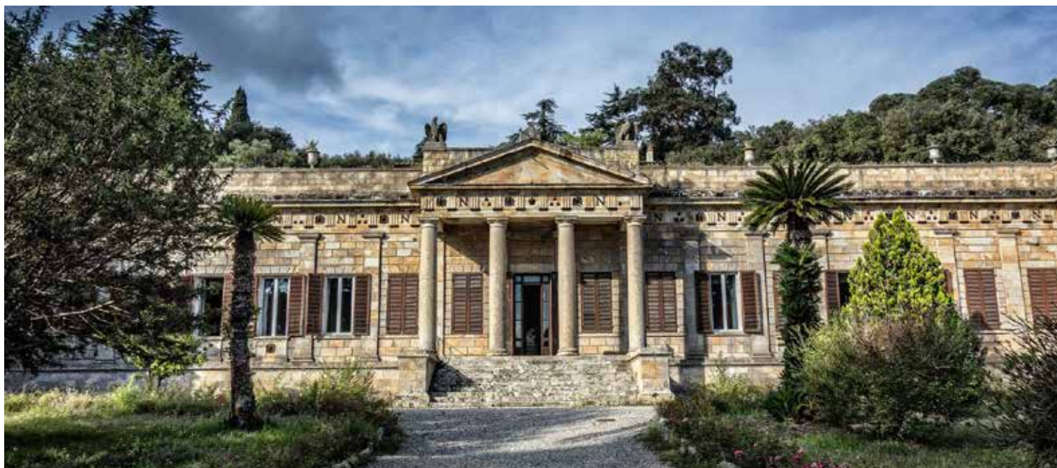
La villa San Martino, l'une des résidences de Napoléon sur l'île d'Elbe

retrouve absolument partout, des étals de supermarché aux tables des restaurants. Détestant les mauvaises odeurs comme la saleté, Napoléon fut toujours très attentif à l'hygiène publique comme à son hygiène corporelle. Le bain était par exemple un rituel auquel il ne dérogeait jamais. Plongé dans l'eau chaude, il restait des heures entières dans sa baignoire. Dans le plus simple appareil, il lui arrivait souvent de travailler avec ses secrétaires ou conseillers, dictant, lisant ou écrivant. Pour sa propreté, il utilisait de l'eau de Cologne en grande quantité (avant son départ en Russie, il en fit acheter par exemple 18 caisses). Pour sa toilette, Napoléon utilisait les "savonnettes fines à l'orange" ou les briques de savon de Windsor du parfumeur Gantier aux arômes raffinés. Napoléon était aussi amateur des magnifiques "nécessaires" fabriqués par l'orfèvre Biennais. Certains nécessaires pouvaient contenir jusqu'à 75 objets. Il en existait à toilette, à thé, à dents ou à écrire. Napoléon possédait ainsi cinq grands nécessaires de voyages et au moins dix petits nécessaires dits de porte-manteau contenant les objets les plus usuels, des ciseaux à la brosse à dent. Comme il prenait soin de sa dentition, les coffrets de voyage emmenaient notamment tout ce qu'il fallait pour son hygiène dentaire.