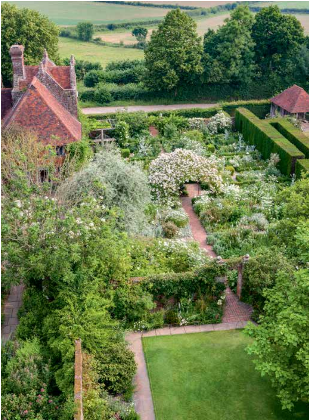
Le jardin blanc au manoir de Sissinghurst