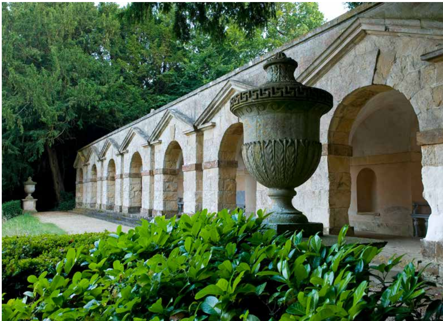
La terrasse de Praeneste dans le jardin de Rousham