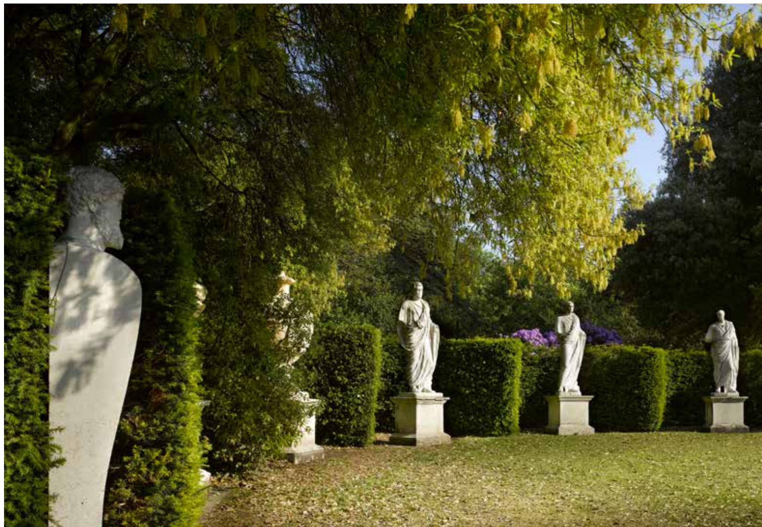
Les statues des grands hommes de l'Antiquité dans les jardins de Chiswick House 📍 Chiswick House & Gardens Trust

Dissertation on Oriental Gardening (1772). Nommé architecte du roi George III qui mène un patriotisme artistique, Chambers s'illustre en construisant la pagode chinoise de Kew Gardens, jardin à la gloire de l'empire britannique, qui comporte aussi des serres, un théâtre, un temple du Soleil, un temple de Pan et Aréthuse et des répliques du palais de l'Alhambra et d'une cathédrale gothique.