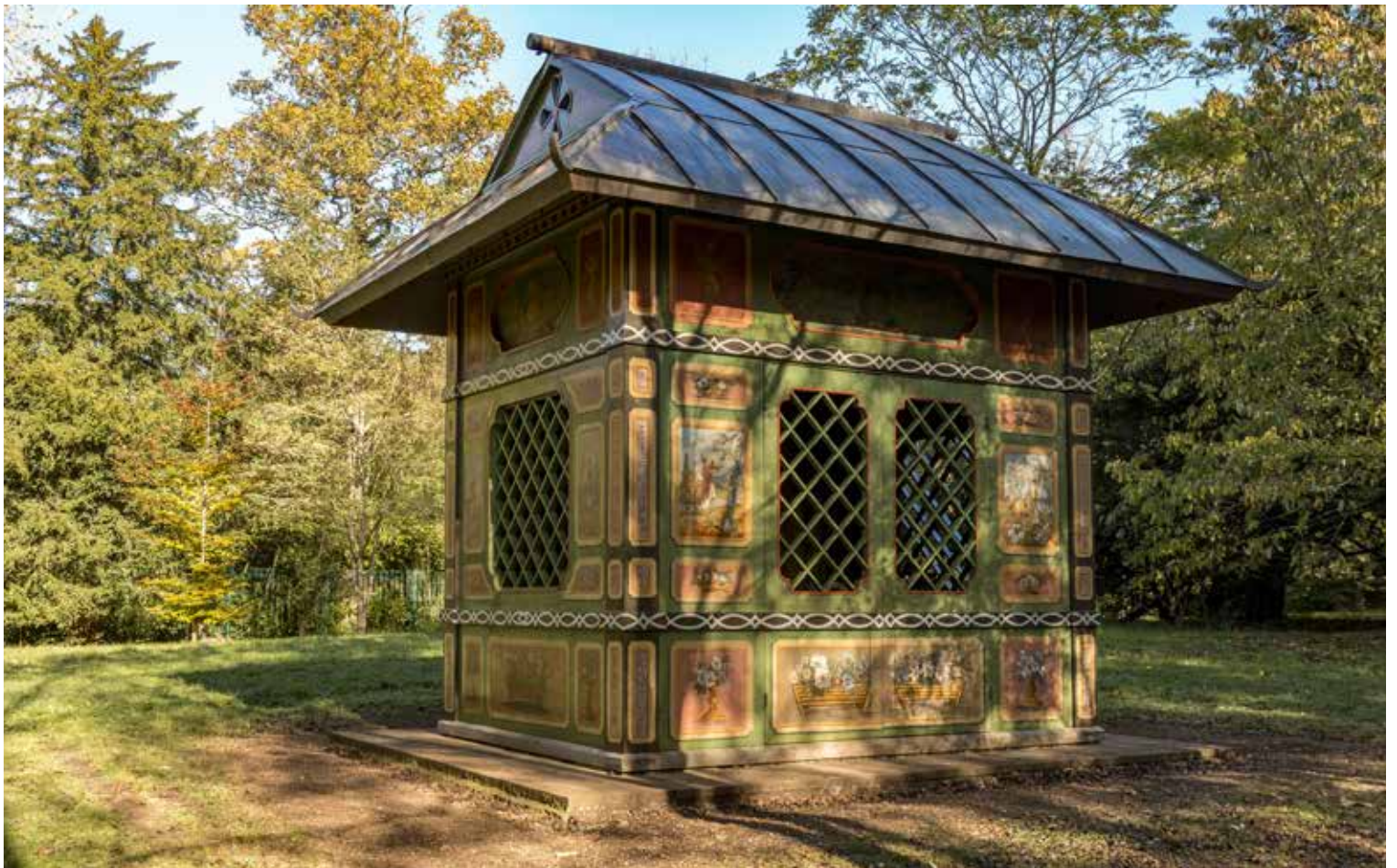
Le pavillon chinois du jardin de Stowe

Des créateurs contemporains réinterprètent cette tradition d'art des jardins, dans une perspective post-moderne qui joue sur le pastiche et le détournement