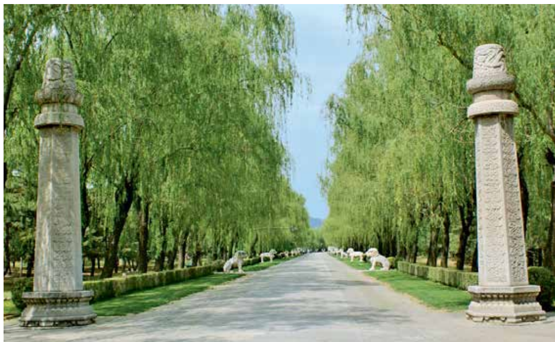
La voie sacrée menant aux tombeaux des empereurs Ming, construits sous le règne de Yongle ■ M. Gervais