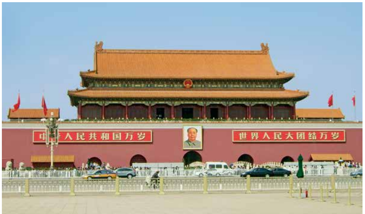
Le portrait de Mao sur la place Tian'anmen

En 1911, le régime impérial s'éteignit ; l'année suivante, la république fut proclamée. Dans un premier temps, son éphémère président, l'ancien général Yuan Shikai – qui tenta brièvement de restaurer l'empire à son profit –, maintint à Pékin son statut de capitale.