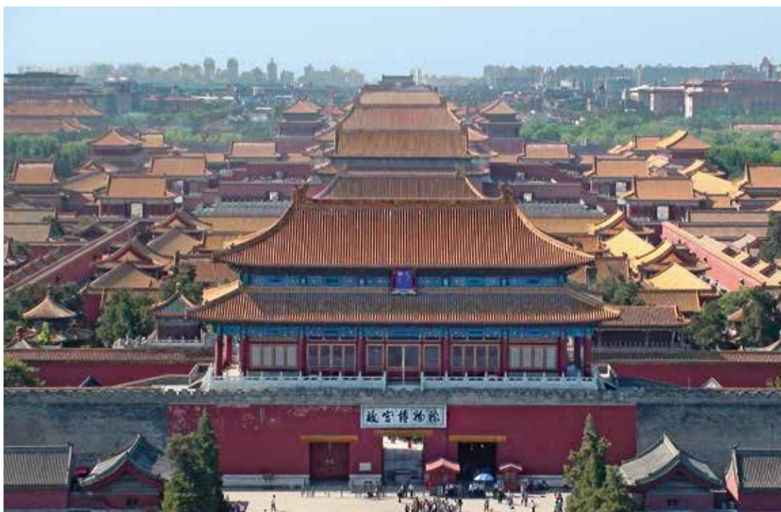
Vue d'ensemble sur la Cité interdite

Le temple de Confucius, situé non loin de l'ancien collège impérial, le temple du Pic de l'Est et le temple des Nuages blancs, qui se rattachent tous deux au taoïsme, témoignent de la présence de religions dites natives.