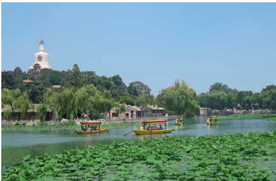
Vue sur le parc Beihai, où se trouvait anciennement le palais de l'empereur Kubilai Khan