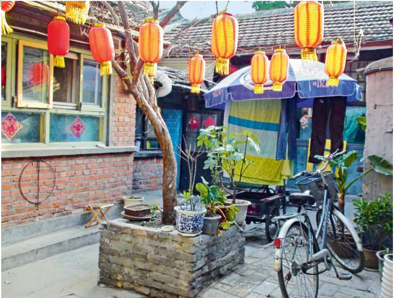
Dans un hutong