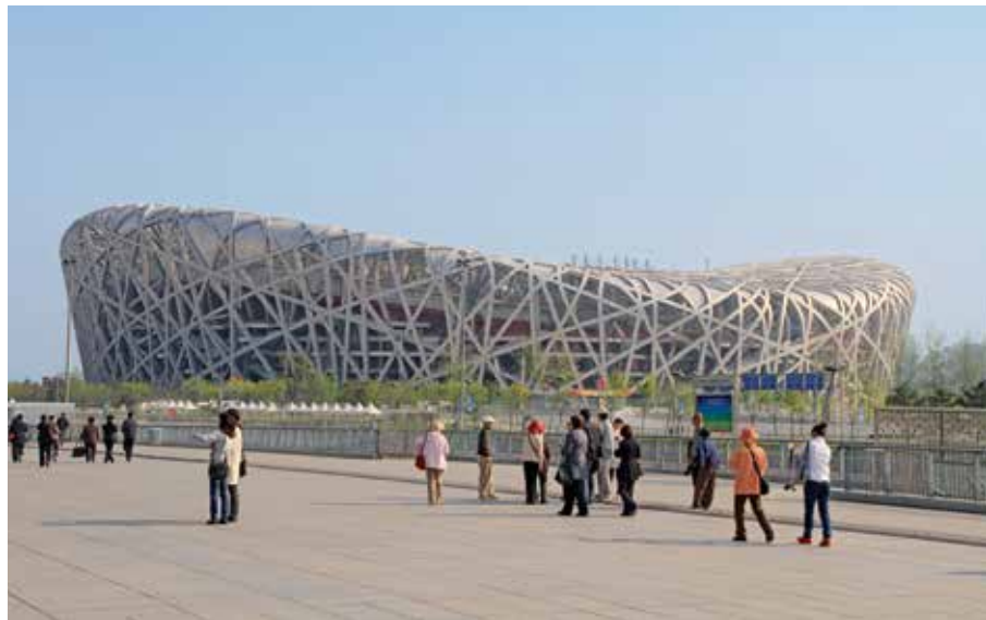
Le "Nid d'oiseau", stade construit à l'occasion des Jeux olympique de 2008

À chaque pas ou presque, où qu'il tourne son regard, le promeneur attentif rencontre un marqueur de l'histoire ancienne ou plus récente de la ville, de sa littérature et de sa vie artistique : les tours de la Cloche et du Tambour, le pont Marco-Polo, le dagoba blanc du parc Beihai, les édifices coloniaux du quartier des légations, la place Tian'anmen réaménagée dans les années 1950, le mausolée de Mao Zedong, les résidences devenues musées de Mei Lanfang – star de l'opéra chinois –, de Song Qingling – veuve de Sun Yat Sen –, ou encore des écrivains Lao She et Mao Dun. Puis, témoignant des toutes dernières mutations, les tours ultramodernes des nouveaux quartiers financiers, du pôle technologique de Zhongguancun et, bien sûr, les constructions directement liées aux Jeux olympiques de 2008.