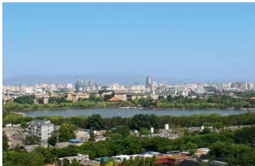
Vue d'ensemble sur Pékin

Des habitats néolithiques furent découverts dans plusieurs zones de la ville, confirmant l'ancienneté du peuplement de la région. Les premiers sites urbains, ou du moins villageois, ne firent toutefois leur apparition que bien plus tard. Une agglomération assez primitive s'implanta d'abord non loin de l'actuel pont Marco-Polo, avant de se déplacer et de se fortifier à l'époque des Zhou (du XI e au VIII e s. av. J.-C.). Les textes désignaient alors la ville par le nom de Ji et, pendant la période dite des Royaumes combattants (de -481 à -221), elle fut le centre de l'État de Yan.