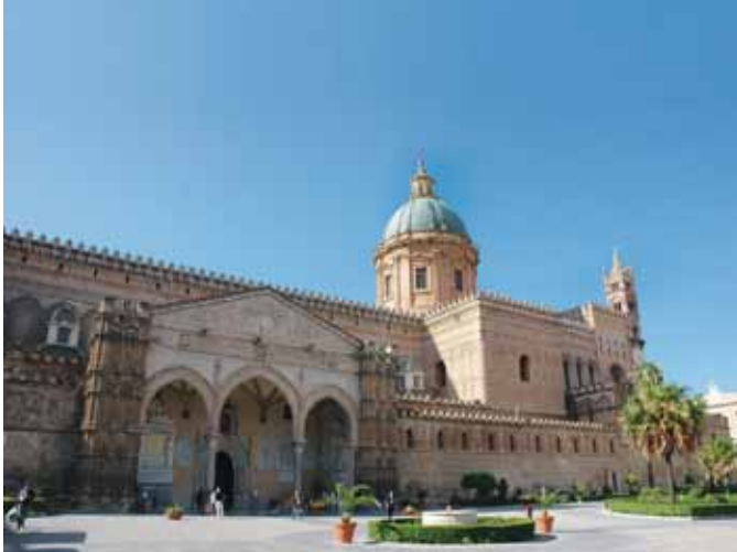
La cathédrale De Palerme - M. Richard

CHRISTIAN LOUBET, PROFESSEUR EN HISTOIRE DES ARTS ET DES MENTALITÉS