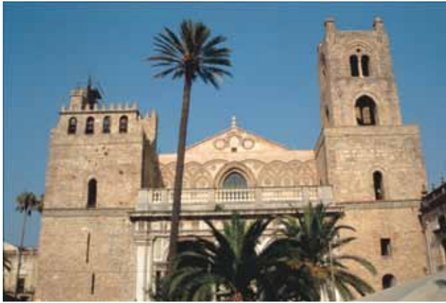
La cathédrale des Normands à Cefalù

Pour dessécher les cadavres, on plaçait les défunts sur une grille de tubes en terre cuite dans un caveau muré, le lendemain du décès. Le corps sorti de cet "égouttoir", était exposé au soleil, après un bain de vinaigre et d'herbes, parfois de chaux vive. Les visiteurs pouvaient alors toucher ces squelettes vêtus et présentés debout ou couchés. L'exhumation fait de ces défunts des permanents apprivoisés, ce qui peut être moins angoissant que de potentiels revenants. La promiscuité ne choque pas ici, où l'on supporte mal la solitude. Autrefois à la Toussaint, les ancêtres étaient censés apporter des cadeaux aux enfants et les familles allaient partager au cimetière leur repas de fête. Les surréalistes auraient apprécié ces "cadavres exquis". Francesco Rosi, qui reprend ce titre, a situé le début de son film dans les catacombes