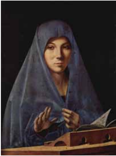
Annunziata, Antonello De Messine

Il faut sortir de Palerme pour trouver au village de Bagheria, dans le parc de la villa du prince Palagonia, les vestiges étranges d'une scénographie fantastique, parmi les groupes de figures monstrueuses en pierre dressées au fil des allées. L'ensemble des statues (il en reste 60 sur 600) fut entrepris par Ferdinand Gravina à partir de 1747. Taciturne, secret et introverti, Gravina était chambellan du roi Charles III et Grand d'Espagne au moment où s'imposait à Madrid le style churrigueresque (baroque ultime). À l'intérieur de sa villa, les pièges de l'illusion se déploient avec une audace subversive. Dans le parc, on constate la métamorphose de créatures hybrides, dans une étourdissante invention plastique, quasi-surréaliste. La légende fait du prince un jaloux qui aurait conçu ses monstres pour mieux garder une jeune épouse. Dominique Fernandez voit plutôt en Gravina un spéculateur "métaphysique" très sicilien qui révèle l'imposture des apparences, la défaite de la raison, le mystère de l'univers. Ce pessimiste lucide s'accorde avec l'emblème de la Sicile, la monstrueuse Gorgone céphalopode à trois jambes... Vers 1900, on retrouvera dans les "folies" de l'Art nouveau un écho à ces délires (le Teatro Massimo ou la villa Florio conçus par Ernesto Basile).