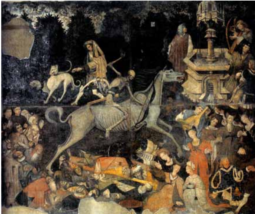
Détail du Triomphe de la mort

L'étrange monolithe au centre de la Méditerranée est un conservatoire, justement à cause des dominations successives subies, assumées et jamais effacées. Nulle part ailleurs on ne trouve autant de civilisations qui s'y sont succédé, en témoigne le fonds d'une culture populaire métissée et vivace, dans ses récits, sa musique et ses images. À Palerme, par exemple, d'anciennes mosquées sont devenues des églises romanes enrichies de mosaïques byzantines par les Normands, puis recouvertes d'une façade baroque (la Martorana).