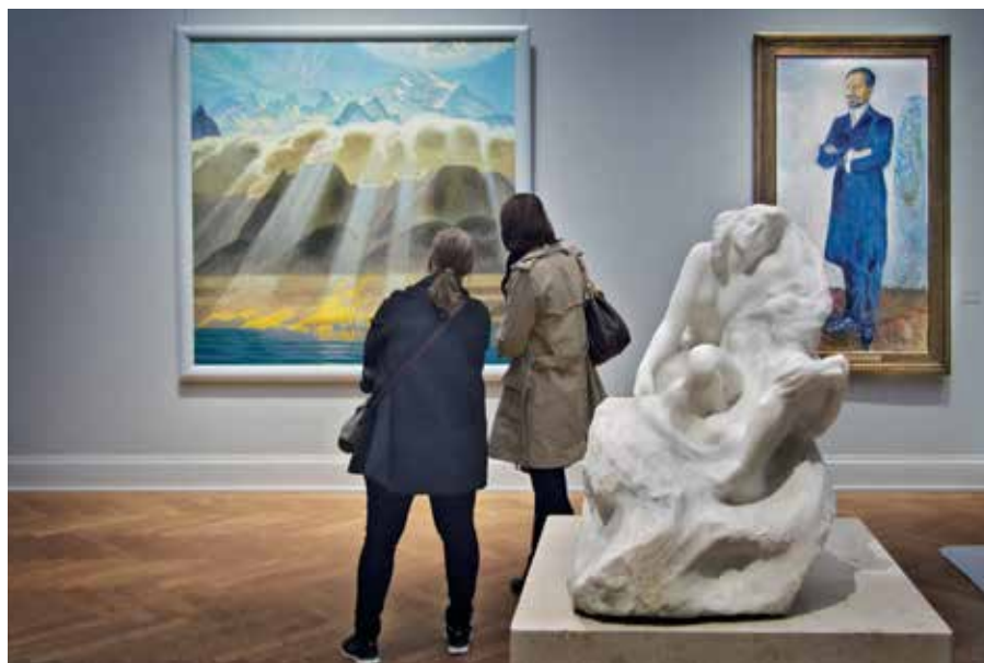
Dans une des salles de la galerie Thielska à Stockholm