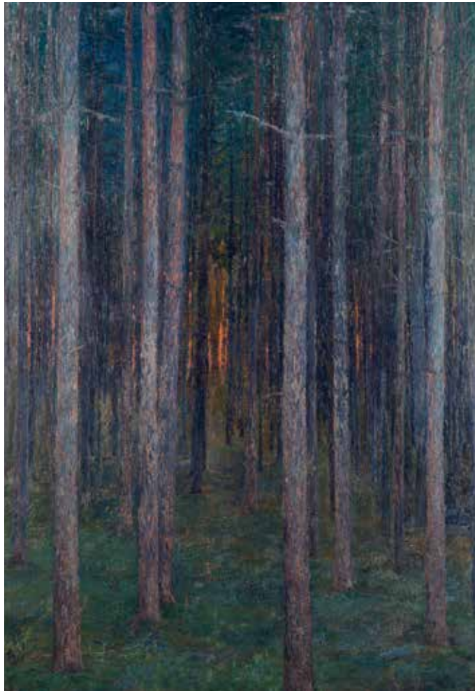
La Forêt, tableau du Prince Eugène datant de 1892 ■ Göteborgs Konstmuseum

PAR CHRISTIAN LOUBET, PROFESSEUR EN HISTOIRE DES ARTS ET DES MENTALITÉS