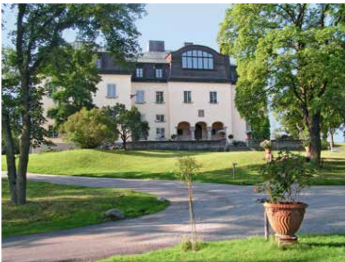
La villa du Prince Eugène à Stockholm ■ Prins Eugen Waldemarsudde/ Photo : Kjell Renblad

Les valeurs partagées par ces artistes : d'une part le vitalisme, le sens de la vie simple en symbiose avec la nature (objectivement puis subjectivement), d'autre part une mélancolie nostalgique, un sentiment de précarité, et une aspiration à la lumière et à la sérénité. Fréquemment s'exprime une intention sociologique (témoignage social et folklore) ou historique (évoquant des mythes).