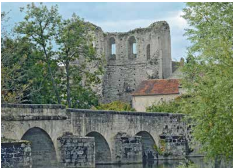
Vue sur le vieux pont et la tour de Ganne à Grez-sur-Loing, où de nombreux peintres séjournèrent

Deux marginaux anticipent sur le xx e siècle. Josephson fut, avant la lettre, un expressionniste pathologique dès 1890. Strindberg, célèbre auteur dramatique, inscrit sa démarche entre W. Turner et l'Action Painting, traduisant des émotions par des formes indistinctes colorées spatulées avec force.