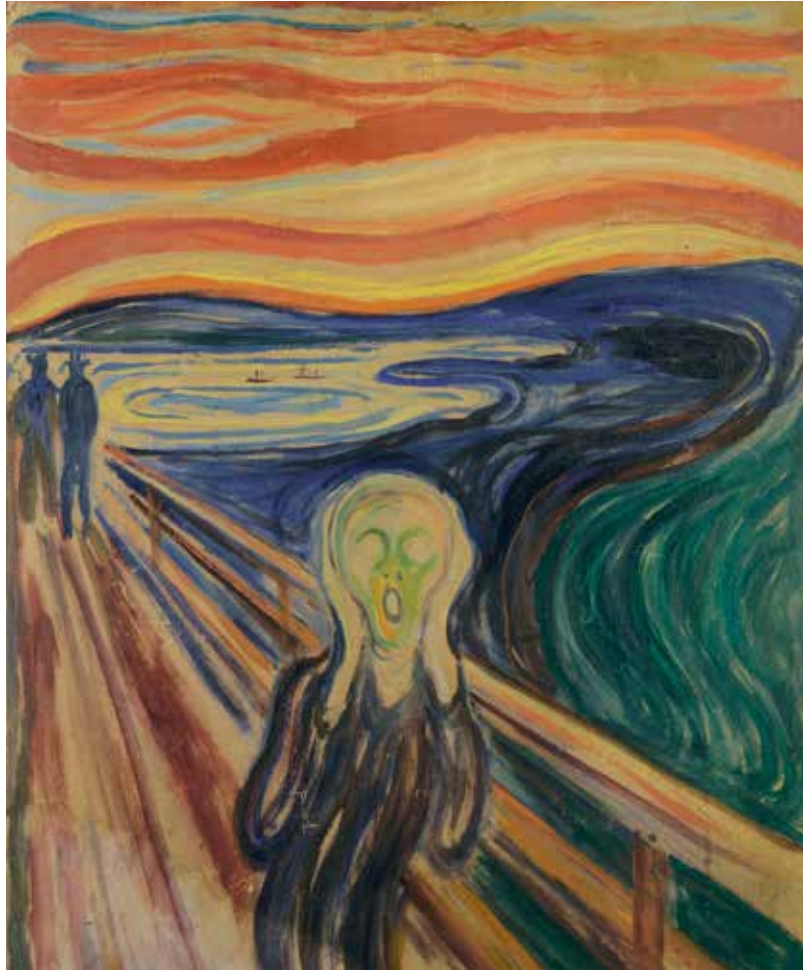
Le Cri d'Edvard Munch ■ Edvard Munch : Le CRI, 1910 ?, The Munch Museum