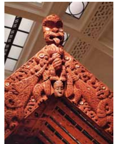
Auckland, Memorial Museum – C. Ragil

Les Maoris vécurent à l'écart de toute autre civilisation jusqu'à l'arrivée des premiers explorateurs européens au milieu du xviii e siècle. Les premiers contacts furent violents car les Maoris craignaient pour leur territoire. Cependant, au cours de quelques échanges pacifiques, les explorateurs troquèrent avec eux de nouvelles plantes et de nouveaux animaux contre des livres, des outils scientifiques et des armes à feu, bouleversant profondément leur façon de vivre. L'acquisition de mousquets par certaines peuplades déstabilisa l'équilibre qui existait entre les tribus maories. Il en résulta une période de guerres inter-tribales sanglantes, connues sous le nom de "guerres des Mousquets", dont les conséquences furent l'extermination de nombreuses tribus et la déportation d'autres hors de leur territoire traditionnel. Environ un siècle plus tard, les premiers colons s'installèrent durablement sur l'archipel. Les européens affluèrent au xviii e siècle, attirés par l'espoir d'une vie meilleure, et un important flux de missionnaires anglicans vint évangéliser les tribus maories. En 1840, après plusieurs tentatives pour persuader les indigènes d'accepter l'annexion de leurs terres, le gouvernement anglais et la reine Victoria signèrent avec les chefs maoris le traité de Waitangi qui faisait des Maoris des sujets de la Couronne britannique en échange de l'intégrité de leur droit de propriété des terres et de l'autonomie des tribus. Ce texte est considéré comme