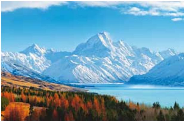
Parc national du mont Cook

Lorsque les premiers Maoris venus de Polynésie accostèrent avec leurs pirogues sur les rivages de Nouvelle-Zélande vers les années 1060-1300 (la date de leur arrivée reste un sujet de controverse