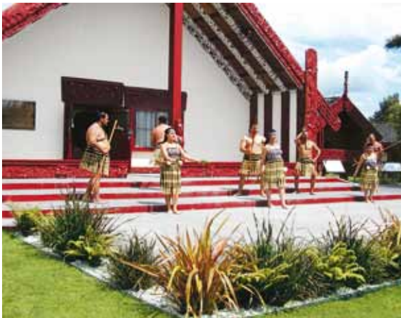
Danse traditionnelle maorie à Rotorua

l'acte fondateur de la Nouvelle-Zélande en tant que nation mais aussi comme la charte garantissant les droits des Maoris. Il reste une référence, un point de ralliement pour ce peuple malgré le peu de considération des gouvernements successifs pour ce traité et les motivations insidieuses des Anglais. L'une des hypothèses proposées par les historiens laisse en effet entendre que le gouvernement britannique signa ce traité pour contrecarrer l'influence des Français et des Américains dans la région et ainsi asseoir leur autorité.